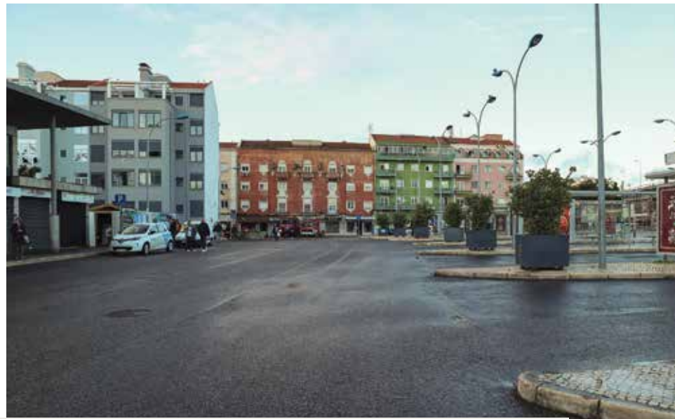
LARGO DA ESTAÇÃO DE ALGÉS, ANTES E DEPOIS DA OPERAÇÃO DE LIMPEZA