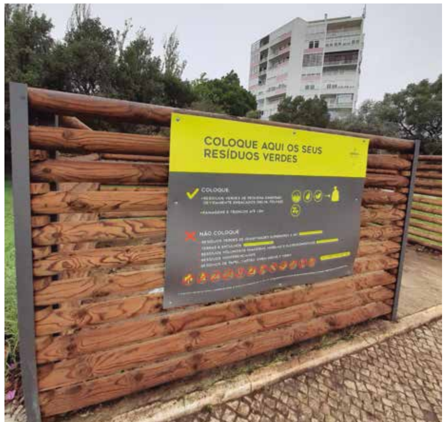
Estruturas de deposição exclusiva de resíduos verdes

Não abandone os seus resíduos. Ajude-nos a manter o nosso concelho limpo. •