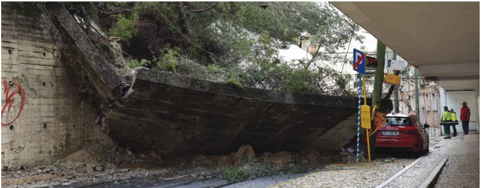
QUEDA DE MURO NA RUA SACADURA CABRAL, NO DAFUNDO