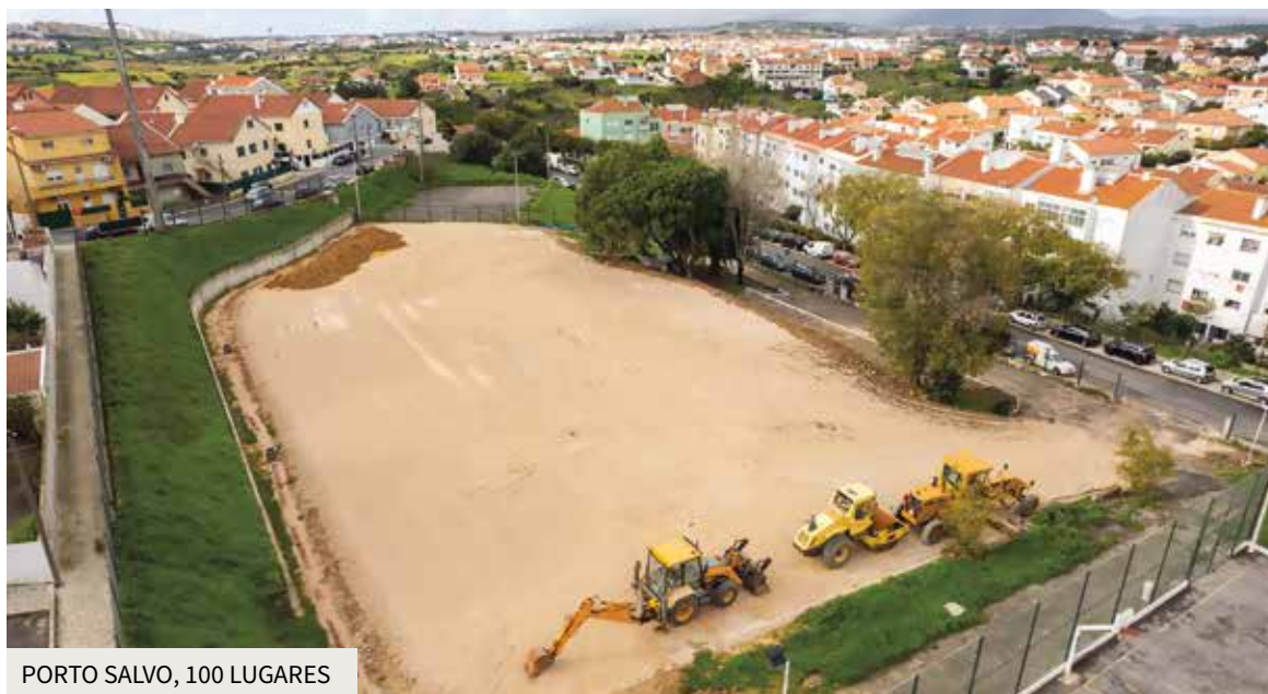
PORTO SALVO, 100 LUGARES

No lote da antiga Escola Custódia Marques, no bairro Autoconstrução, em Porto Salvo e enquanto se elabora o projeto de execução para o futuro Centro Escolar, parque infantil e estacionamento subterrâneo, está a ser concretizado, provisoriamente, um espaço gratuito de estacionamento com capacidade para mais de 100 lugares, o qual permitirá criar uma alternativa aos moradores e visitantes da Rua do Comércio, Rua 7 de junho e envolvente à Estrada das Portelas. Permitirá também criar condições para uma futura reorganização do espaço público nesta área da freguesia onde, atualmente se verifica a constante ocupação de passeios com estacionamento indevido. •