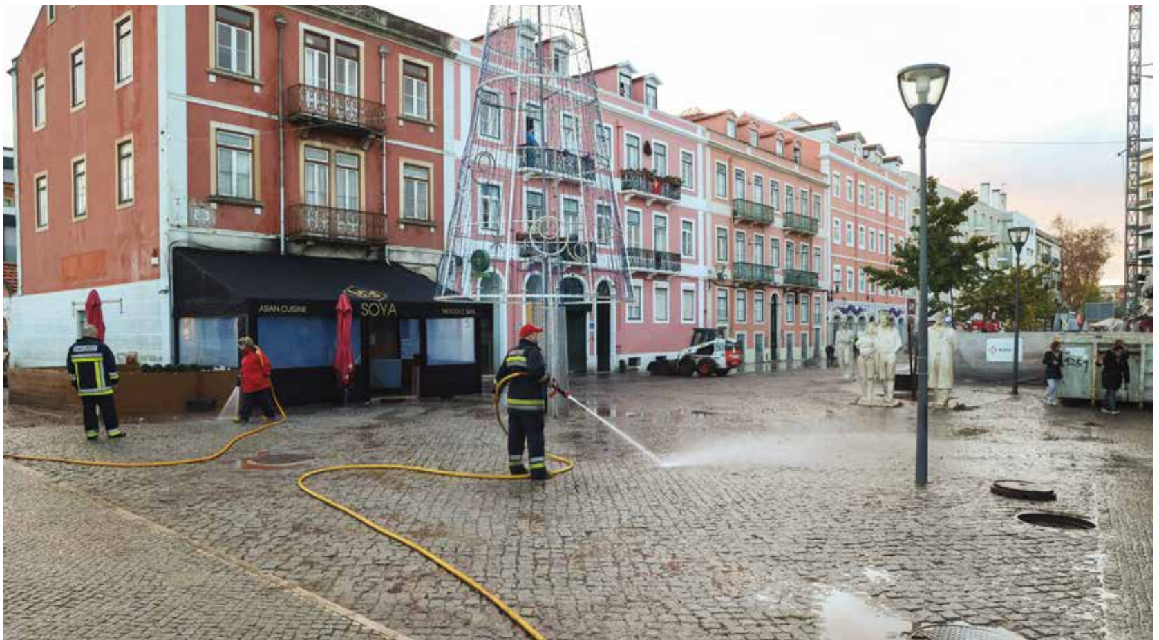
RUA MAJOR AFONSO PALLA, EM ALGÉS, ANTES E DEPOIS DA OPERAÇÃO DE LIMPEZA

Há mais de quatro décadas que não se registava uma tal concentração de precipitação, num intervalo tão curto de tempo, em Oeiras. As fortes chuvadas que caíram na noite de 7 para 8 de dezembro provocaram inundações, ao longo da noite e madrugada, e motivaram diversos pedidos de socorro. As equipas do Município, dos Serviços Intermunicipalizados de Água e Saneamento de Oeiras e Amadora, da Polícia Municipal, da Polícia de Segurança Pública e das diversas corporações de bombeiros do concelho estiveram no terreno, garantindo a continuação da vida em comunidade e procurando acudir a todos quantos necessitaram de ajuda. •