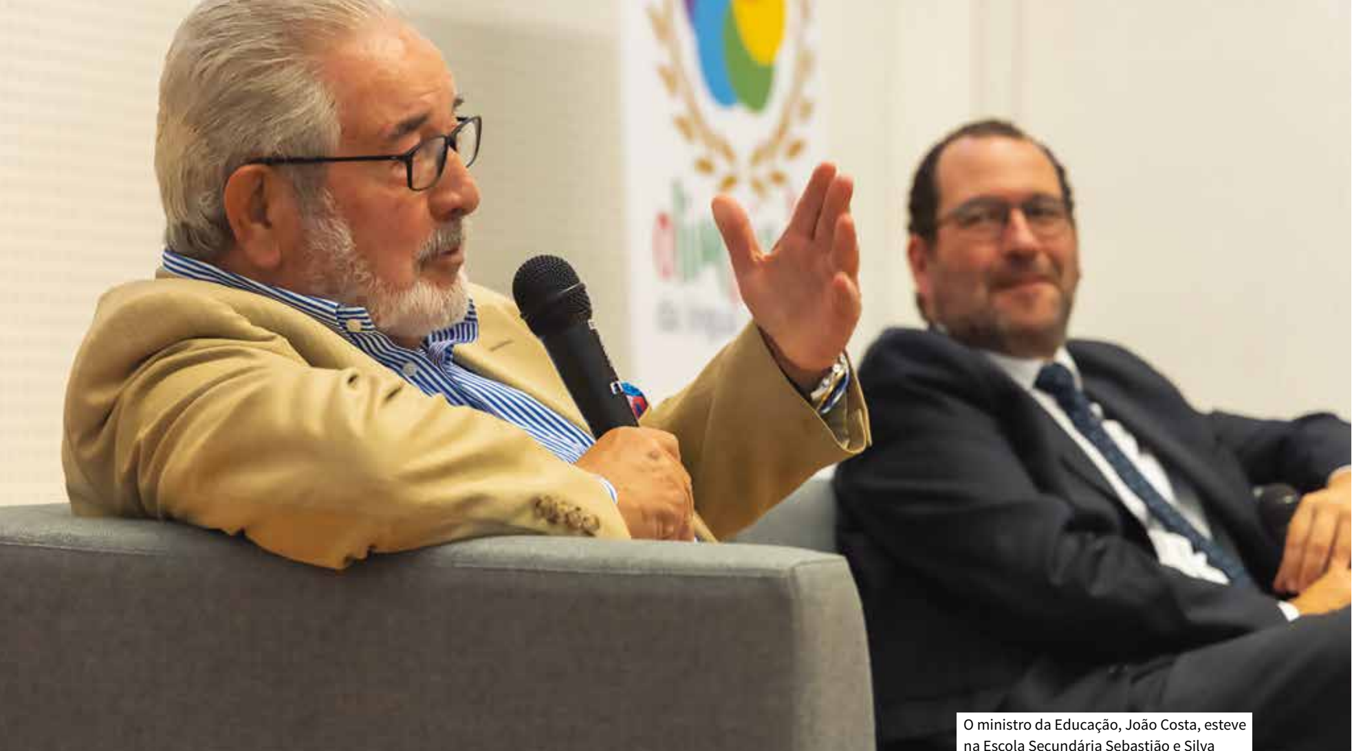
O ministro da Educação, João Costa, esteve na Escola Secundária Sebastião e Silva