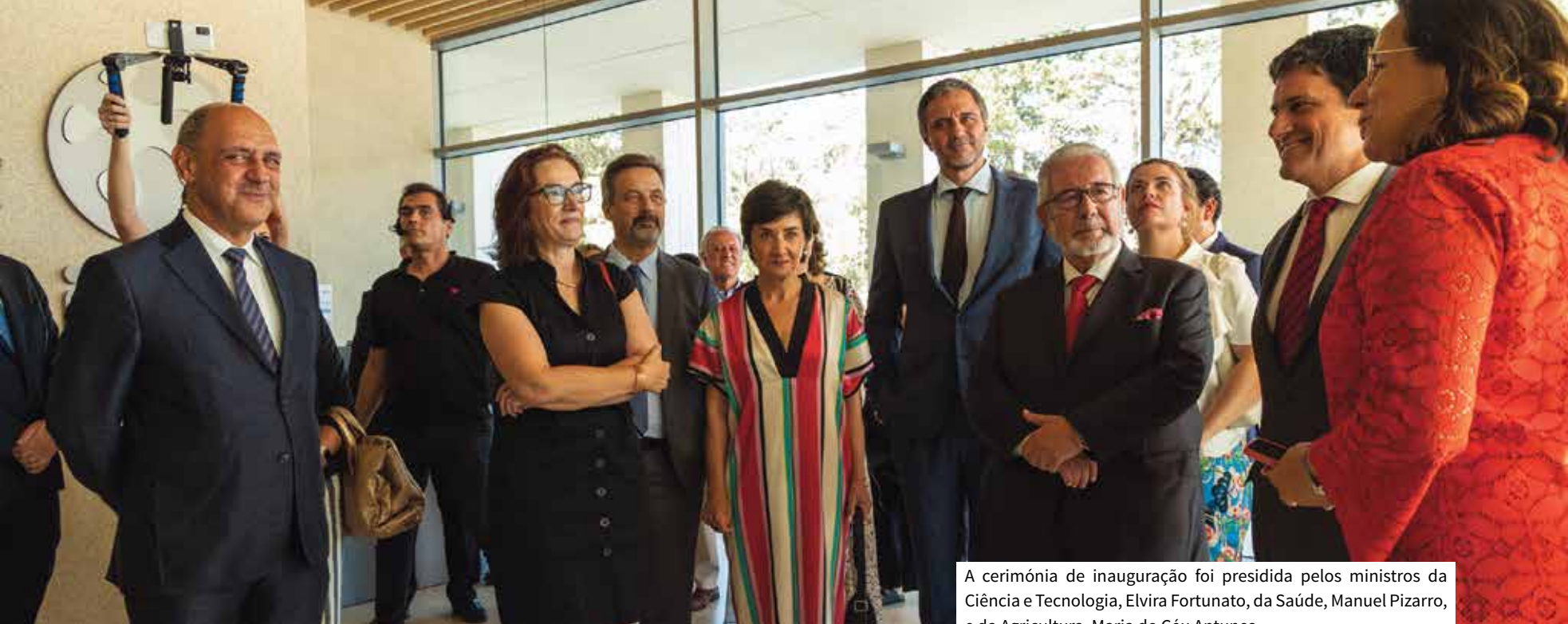
A cerimónia de inauguração foi presidida pelos ministros da Ciência e Tecnologia, Elvira Fortunato, da Saúde, Manuel Pizarro, e da Agricultura, Maria do Céu Antunes