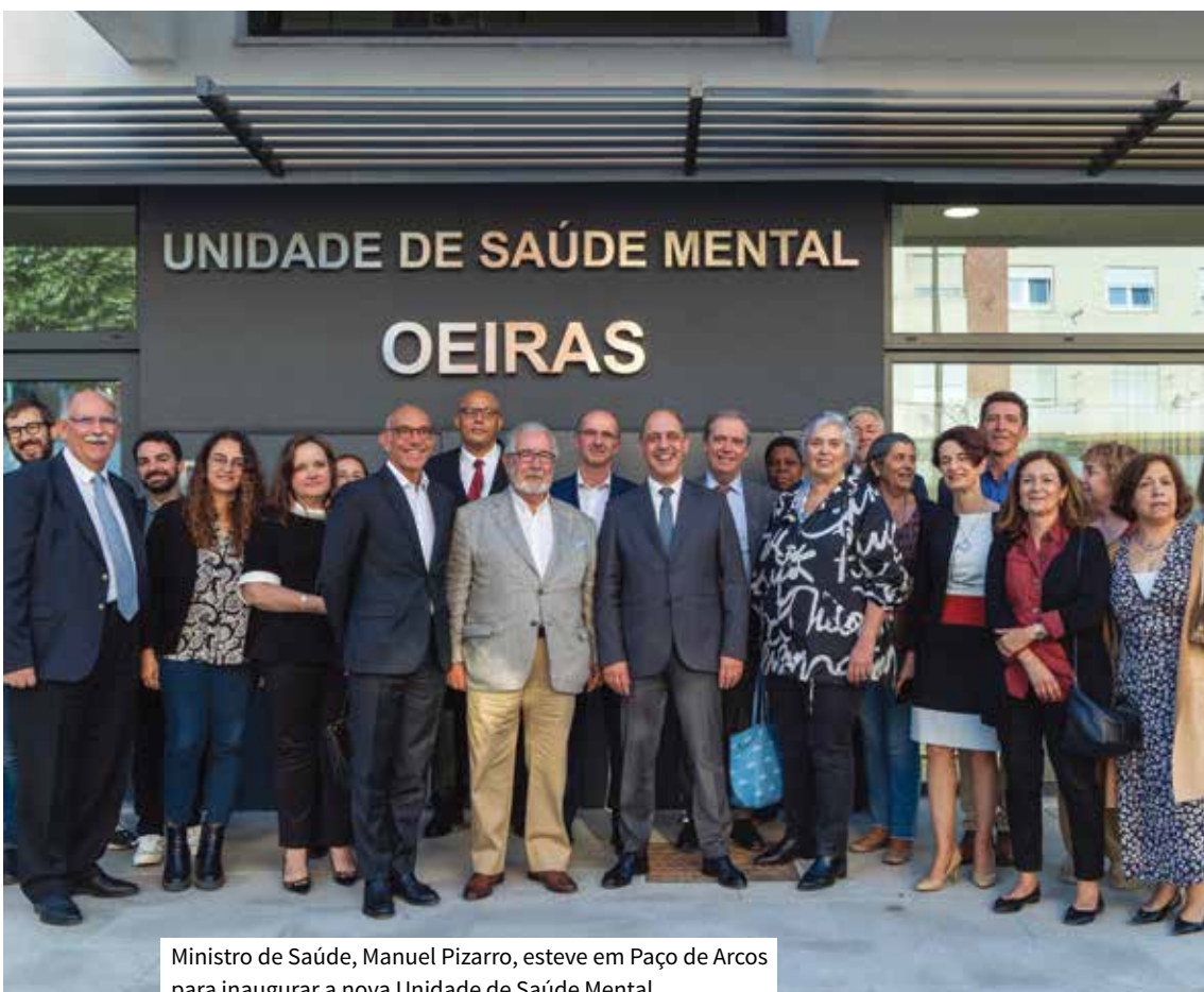
Ministro de Saúde, Manuel Pizarro, esteve em Paço de Arcos para inaugurar a nova Unidade de Saúde Mental

No âmbito do apoio que o Município de Oeiras tem vindo a prestar ao longo dos anos à atividade realizada pelas Equipas Comunitárias de Saúde Mental pertencentes ao Centro Hospitalar de Lisboa Ocidental, foram inauguradas no passado dia 30 de maio, pelo presidente da Câmara Municipal de Oeiras, Isaltino Morais, e pelo ministro da Saúde, Manuel Pizarro, as suas novas instalações cedidas pelo Município em Paço de Arcos. O novo equipamento está localizado no piso superior do antigo quartel dos Bombeiros Voluntários de Paço de Arcos. No piso inferior encontra-se o recém-inaugurado Centro Cultural José de Castro. Tratou-se de um investimento global de um milhão e 800 mil euros. O equipamento é composto por 12 gabinetes clínicos de psiquiatria, psicologia e enfermagem, sala de grupos terapêuticos e unidade de dia, para além de espaços de apoio administrativo. •