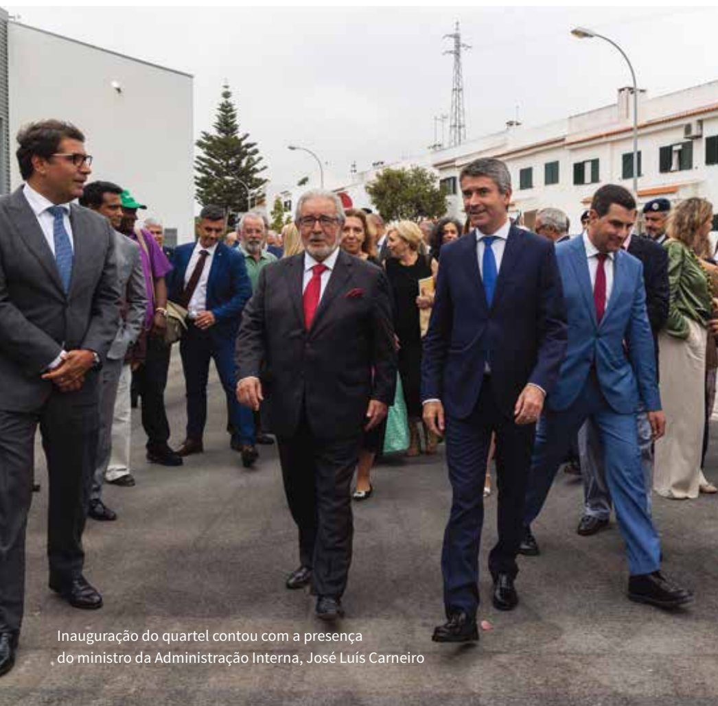
Inauguração do quartel contou com a presença do ministro da Administração Interna, José Luís Carneiro