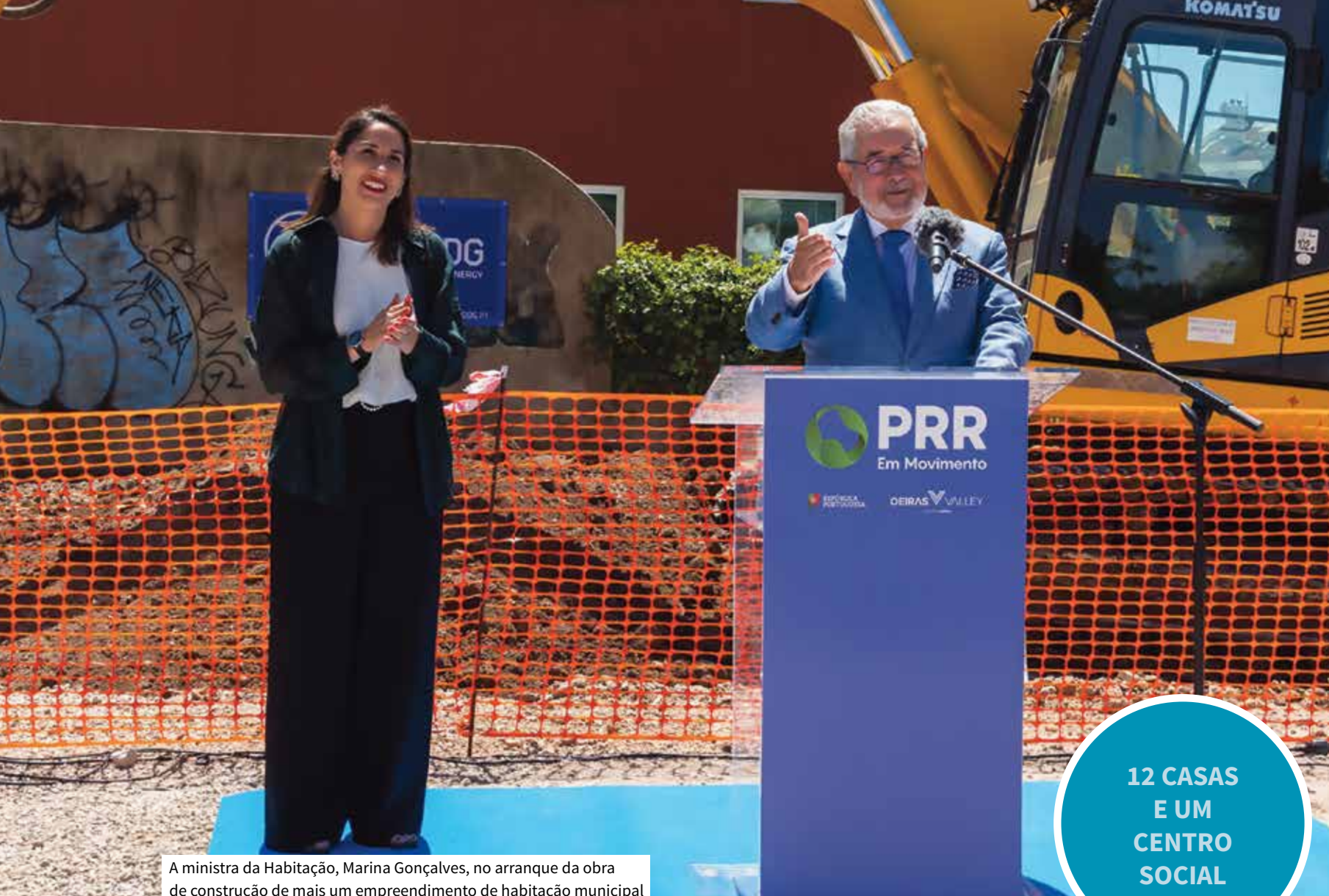
A ministra da Habitação, Marina Gonçalves, no arranque da obra de construção de mais um empreendimento de habitação municipal