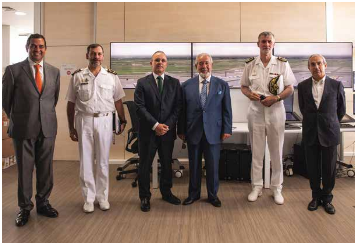
O presidente da Câmara Municipal de Oeiras, Isaltino Morais, com o Chefe de Estado-Maior da Armada, Almirante Henrique Gouveia e Melo, durante a visita a empresas

A iniciativa da Marinha Portuguesa esteve inserida no âmbito do Roadshow EA-IDEIA (Estrutura de Acompanhamento da Investigação, Desenvolvimento, Experimentação e Inovação da Armada) que se realiza desde 2020 e tem como objetivo promover a cooperação com a indústria e a academia. Este ano, após o sucesso do roadshow no passado mês de maio na Madeira, realizou-se uma nova edição em Oeiras. O roteiro da visita incluiu o Instituto da Soldadura e Qualidade, o Instituto Superior Técnico e a BladeInsight, no Taguspark, a Edisoft e a Almadesign, em Paço de Arcos, a Oracle e a CISCO, no Lagoas Park. Para Isaltino Morais, incluir empresas do concelho num programa ligado à inovação e excelência “faz todo o sentido” e, acrescentou, “é um orgulho constatar aquilo que produzem e os projetos que têm para o futuro”. Nas palavras do Almirante Gouveia e Melo, “estamos aqui, em conjunto com a Câmara Municipal de Oeiras, a promover a inovação, com empresas, instituições públicas e a academia, a dar um sinal claro que a Marinha está pronta a assegurar segurança no mar para a inovação, é parceira para o conhecimento e quer ser, no futuro, destinatária dos produtos tecnológicos produzidos”.