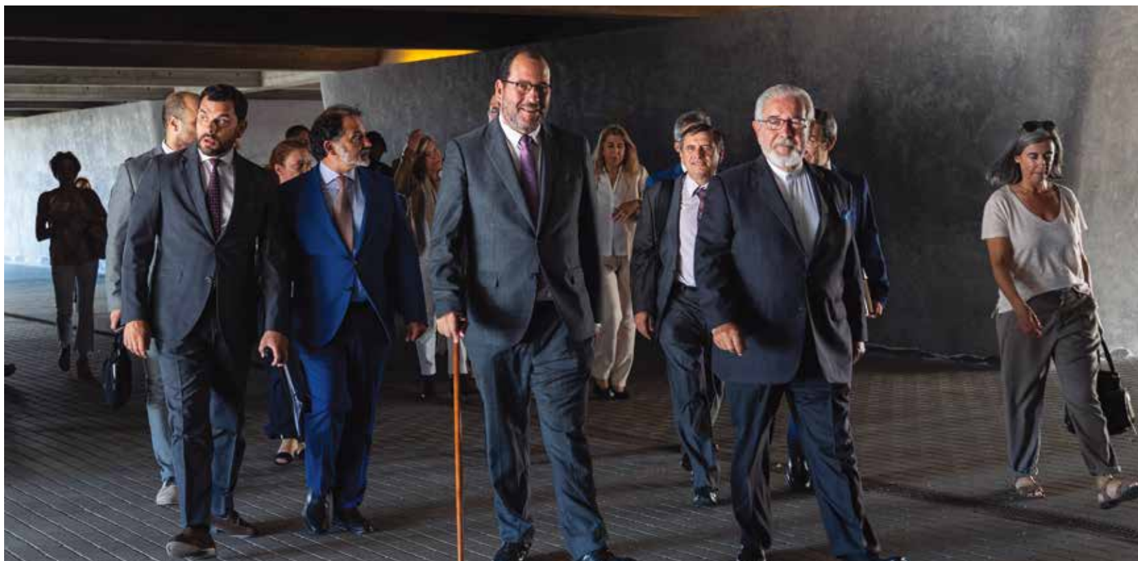
O ministro da Educação, João Marques Costa, esteve em Oeiras para participar no Encontro de Diretores de Escolas de Lisboa e Vale do Tejo

O Município de Oeiras foi o local escolhido para acolher o Encontro de Diretores de Escolas de Lisboa e Vale do Tejo que decorreu no passado dia 20 de julho, no Auditório da Escola Secundária Luís de Freitas Branco, em Paço de Arcos. Este encontro contou com a participação do