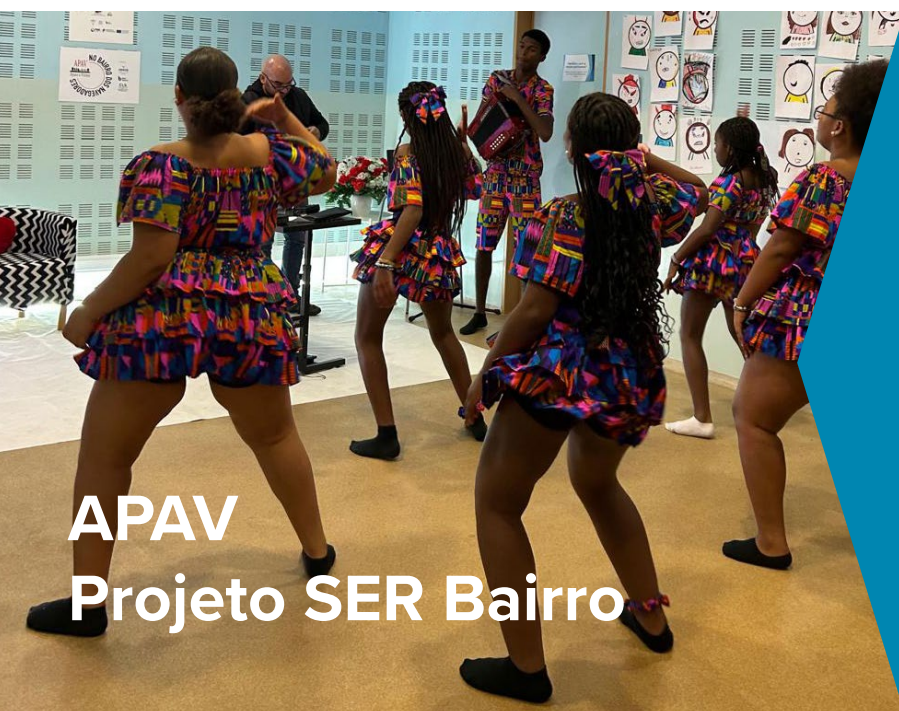
APAV Projeto SER Bairro

O projeto “SER Bairro: Sensibilizar e Educar na Comunidade” desenvolveu um evento no Bairro dos Navegadores, aberto à comunidade, com o objetivo de partilhar o trabalho realizado ao longo do projeto e fortalecer a parceria e o trabalho em rede no território. Foi uma tarde com muita alegria, convívio e repleta de atividades que reuniu vários parceiros, participantes do projeto, familiares e amigos.