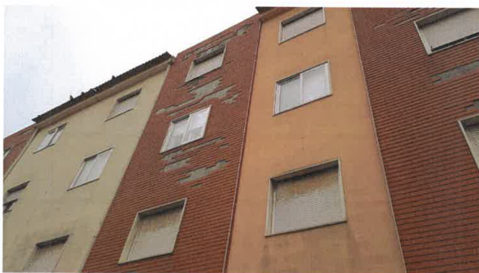
Foto 1 - Alçado Principal