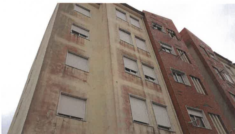
Foto 3 - Alçado Posterior