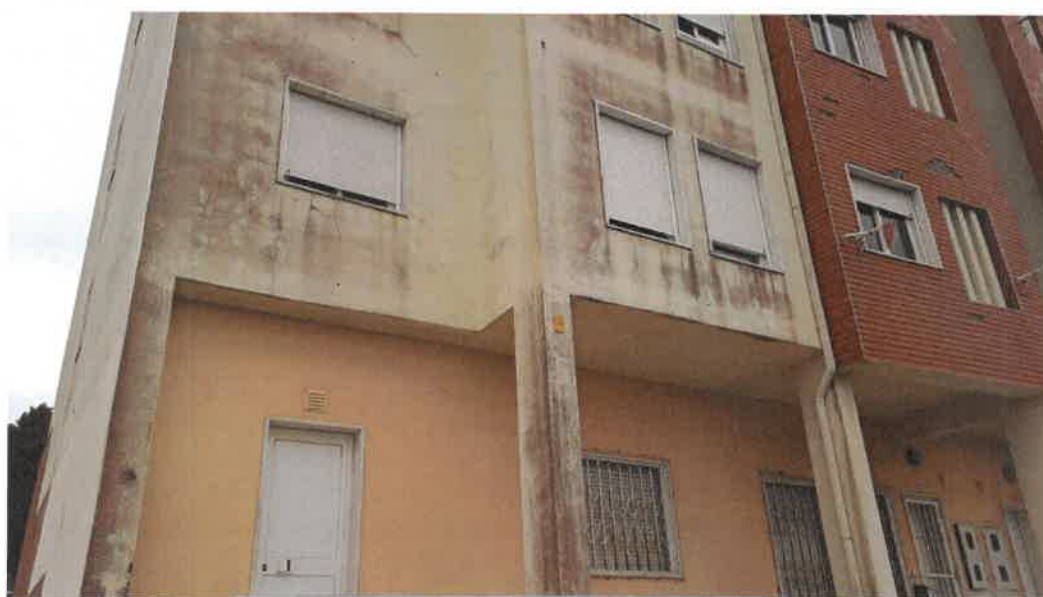
Foto 4 - Alçado Posterior

- No piso em cave do edifício, nomeadamente cave esquerda, com entrada pelo Largo Lucas Pires, funciona um armazém como arquivo do departamento de Habitação/DH, que embora não constitua uma fração autónoma e independente (conforme informação da divisão de património/DP) consiste no único espaço municipal do edifício. Todas as restantes frações, anteriormente propriedade da DP foram, entretanto, vendidas, pelo que todo o restante edifício é propriedade privada;