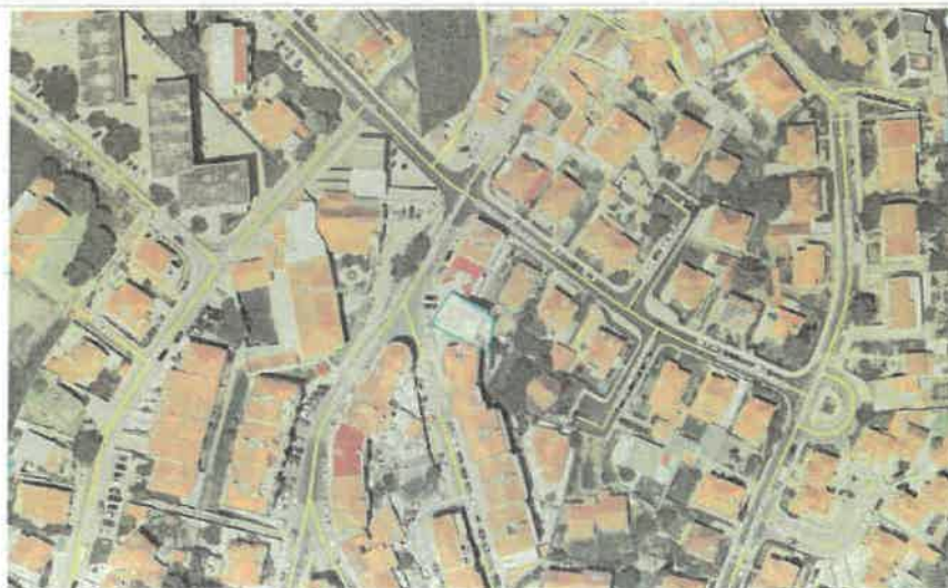
Identificação do Local