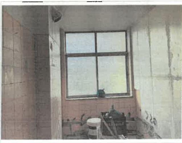
Imagem 6 - Ampliação cozinha - fracção 1º esq