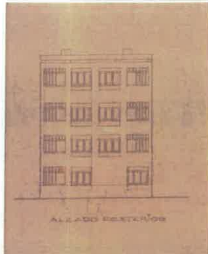
Alçado posterior - telas finais