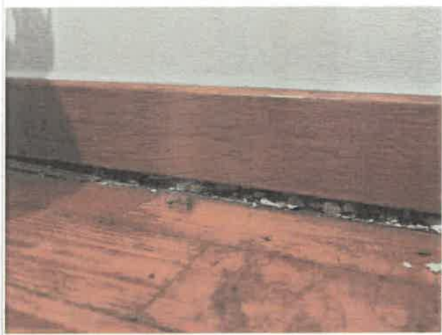
Imagem 1 - Abatimento do pavimento - fracção 2º esq