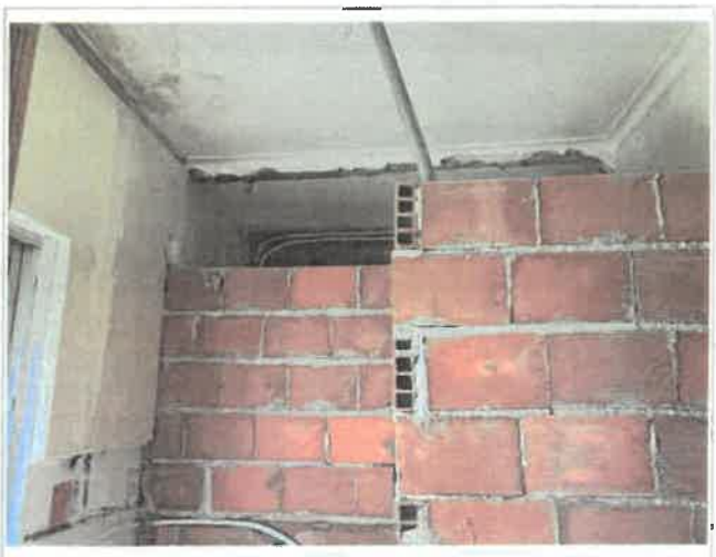
Imagem 5 - Alteração I.S - fracção 1º esq