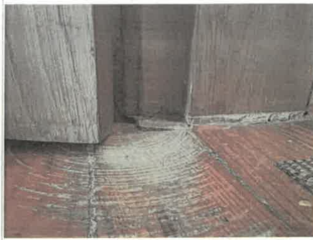
Imagem 1 - Abatimento do pavimento - fracção 2º esq