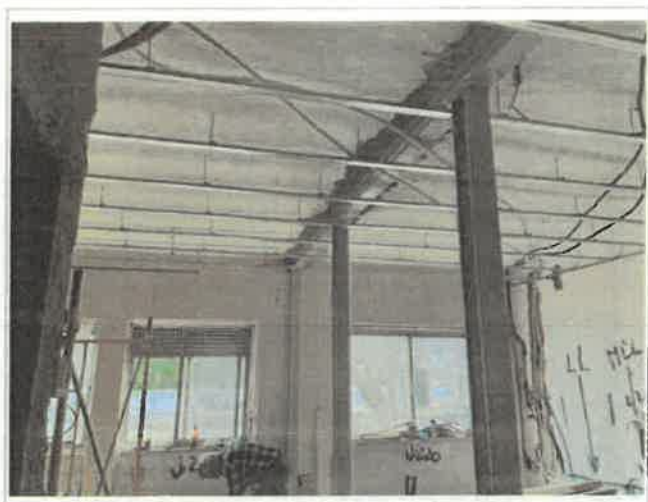
Imagem 3 - Demolição de parede - fracção 1º esq