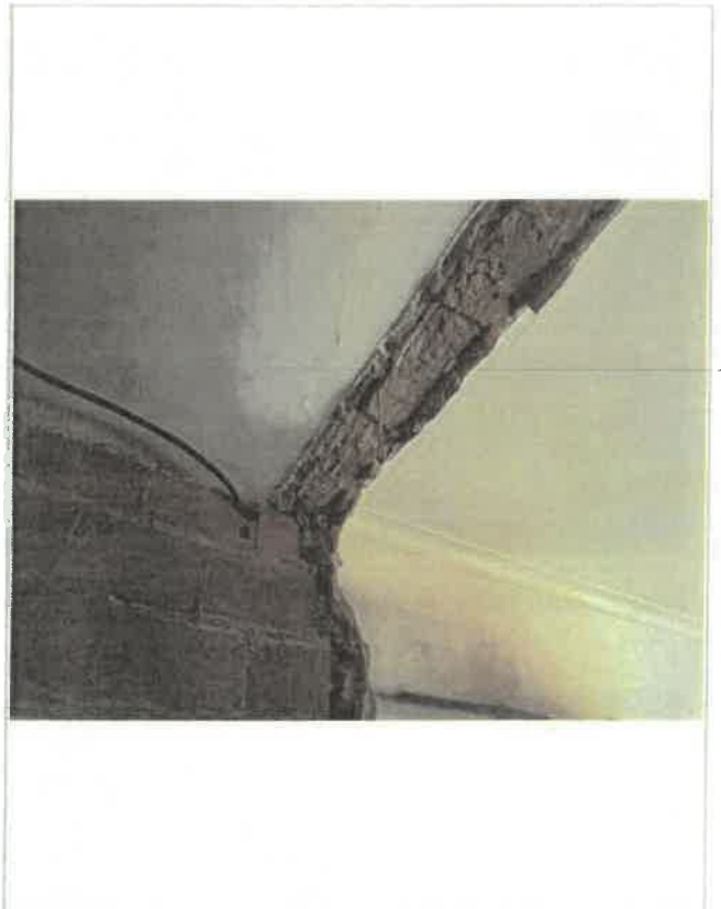
Tecto da instalação sanitária - fracção 2º esq.º