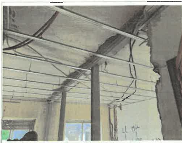
Imagem 4 - Demolição de parede - fracção 1º esq