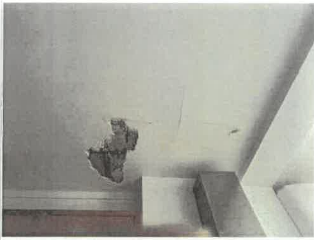
Imagem 7 - Tecto da cozinha - fracção r/c drt.º