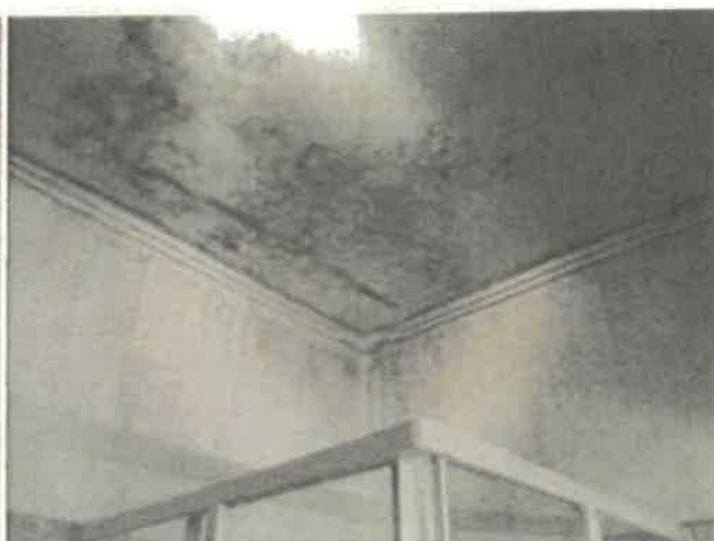
Foto 2 – Tecto e paredes da Instalação sanitária com infiltrações generalizadas