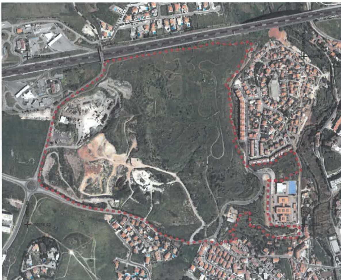
Localização da Plano de Pormenor Norte de Caxias, Caxias (Pedreira Italiana)

A superfície afeta ao Plano, com uma área de cerca de 42ha, localiza-se na União de Freguesias de Oeiras e São Julião da Barra, Paço de Arcos e Caxias, limitada a Norte pela Auto-Estrada A5 (Cascais Lisboa), a Poente pela Av. Prof. Ant.º Maria Baptista Fernandes, a Sul pela Rua Calvet de Magalhães e a Nascente pelo Bairro da Pedreira Italiana e a Escola EB 2, 3 de São Bruno.