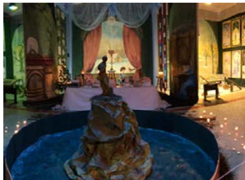
Glamour Arte Nova Ano letivo 2019/20

Viagens com Alma é um projeto desenvolvido no Agrupamento de Escolas de Linda-a-Velha e Queijas (AELAVQ) que permite viajar através do sonho e da criatividade, permite ver, ouvir e sentir diferentes destinos sem sair da escola!