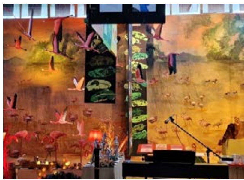
(Re)Contos d’África Ano letivo 2022/23