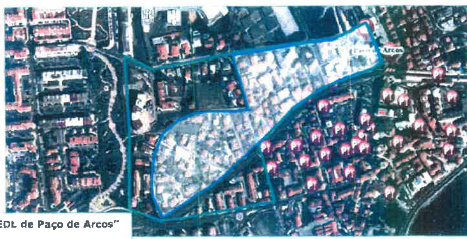
"Alargamento da ZEDL de Paço de Arcos" - PROPOSTA -