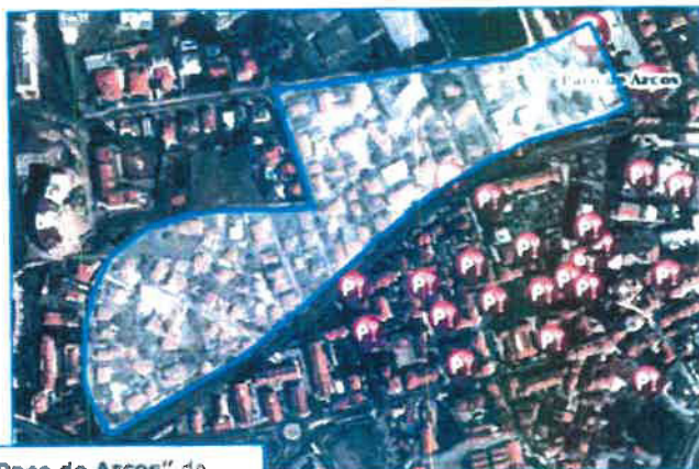
*Proposta da PT - "Alargamento da ZEDL de Paço de Arcos" de acordo com Ofício de 24 de Agosto que inclui proposta para tarifar a Rua Joaquim Moreira Rato ao limite com a ZEDL proposta para o Parque dos Poetas)