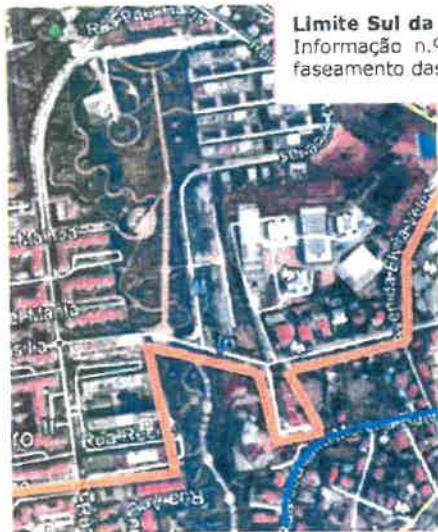
Limite Sul da Proposta da PT para a "ZEDL de Parque dos Poetas" (H2) - com Informação n.º Int-CMO/2018/20533 (DMT) - parecer favorável em função de um faseamento das intervenções previstas para o local.

zona de transição residual entre esta ZEDL proposta e a do Parque dos Poetas (já analisada), tal como: