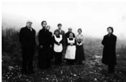
Uma cena do ensaio da peça "João Gabriel Borkman"