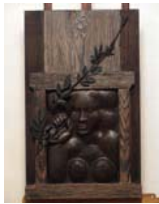
Escultura de António Trindade