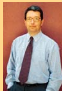
por Ricardo Leite Pinto

Lisboa, Notícias Editorial, 1977, 253 pp.