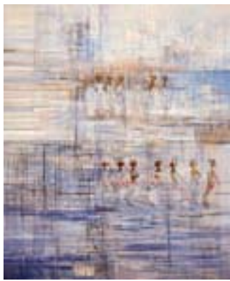
Pintura de Manuela Jardim