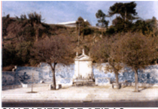
CHAFARIZES DE OEIRAS