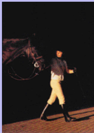
Centro Hípico de Leião

Capela de N.ª Senhora da Piedade em Leceia, Igreja S. Pedro de Barcarena e Igreja St.º António em Tercena.