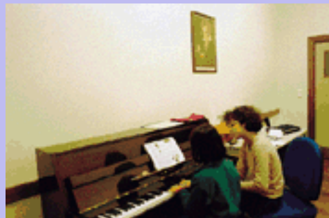
Escola de Música N.ª Senhora do Cabo