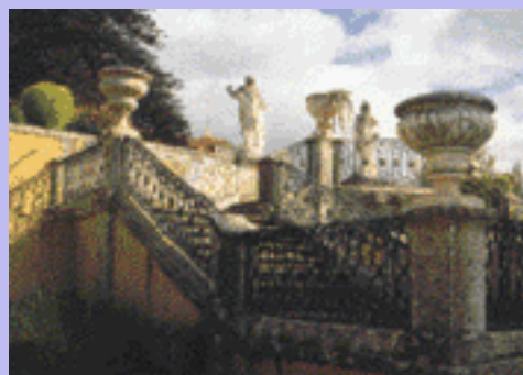
Quinta do Marquês

Para ambos os circuitos pode ir com um número máximo de trinta pessoas e deve inscrever-se nos Sector de Turismo, na Fundação de Oeiras (441 38 44) . As partidas são sempre às 10h00, no Largo Marquês de Pombal.