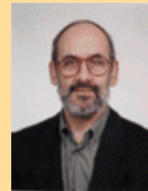
por Pedro Osório

Música de audição fácil, deveria fazer parte de todas as colecções particulares.