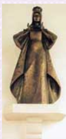
Imagem de Nossa Senhora, Igreja de Santo António