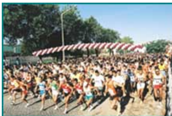
Corrida do Tejo - 20ª edição

Esta corrida consegue uma grande participação do público, pois é de salientar que, no total das vinte até agora realizadas, o número de participantes foi 28993, tendo o recorde de presenças sido alcançado este ano com 2162 participantes. Assim sendo, esta prova está nos primeiros lugares das mais participadas em Portugal. Nas várias edições desta corrida, os participantes podem ser de qualquer idade e sexo, necessitando apenas, para participarem, de se inscreverem e de possuir gosto pela corrida pedestre. O resto é apreciar a paisagem.