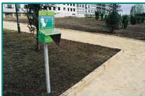
Equipamentos para recolha de dejectos caninos

Vem esta nota introdutória a propósito da forma como pensa e sente quem vive ou trabalha no concelho de Oeiras, e a análise que se pode fazer destes dois grupos de cidadãos que coabitam no mesmo meio.