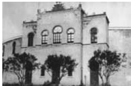
Praça de Touros de Algés

"Vae construir-se muito brevemente em Algés ao norte da estrada real uma nova praça de touros.