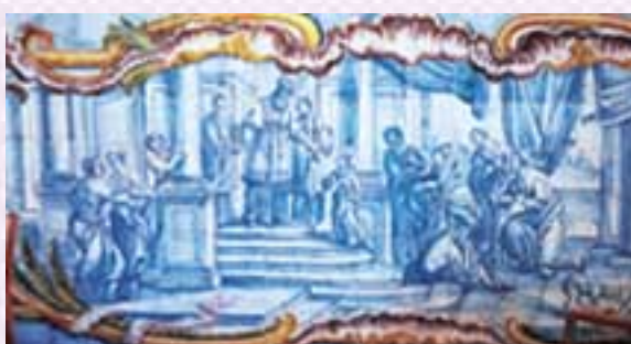
Painel de azuleijos historiados representado a Apresentação da Virgem, Capela de Nossa Senhora das Mrecês

Texto: Sara Silva