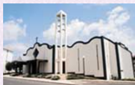
Igreja de S.Julião da Barra