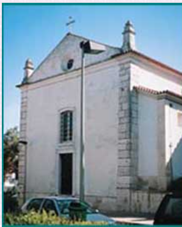
Capela de Santo Amaro