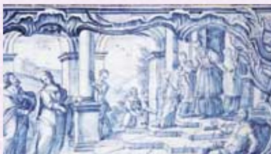
Painel de azuleizos históricos representando a Apresentação da Virgem, Capela de Santo Amaro

A Igreja da paróquia de S. Julião da Barra, desenhada pelo arquitecto Viana, foi inaugurada a 14 de Março de 1991. Destaca-se o remate da sua fachada que sugere uma ondulação de planos conferindo-lhe uma volumetria horizontal que contrasta com o campanário.