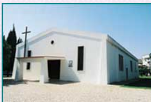
Igreja de Santo António de Nova Oeiras