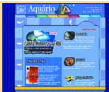
Aquário Vasco da Gama

Rua Direita, Dafundo, Cruz Quebrada, Dafundo, Tel: 21 419 63 37 http://www.aquariovgama.pt TODOS OS DIAS, DAS 10H00 ÀS 18H00