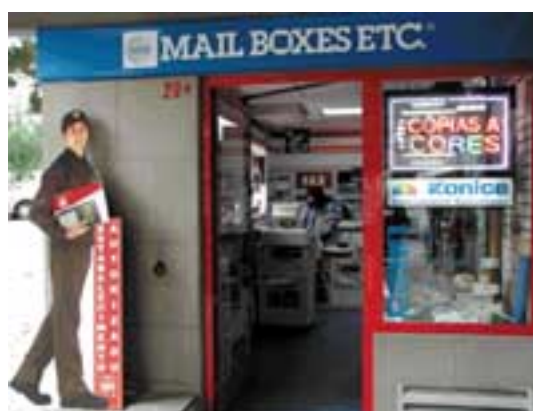
Mail Boxes Etc.