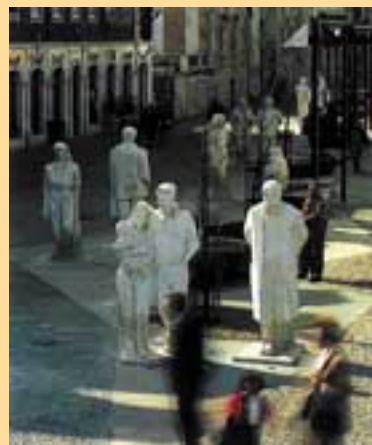
1º Encontro de Colectividades Desportivas

A história do Hip Hop e as experiências de bandas de Rap no país são alguns dos temas a serem debatidos durante a semana dedicada às várias manifestações do Hip Hop, organizada pelo Centro de Juventude. No último dia, haverá um concurso de graffiti, em sua sétima edição, em que cada um dos 12 finalistas pintará, ao vivo, um painel de 2 metros de altura por 5 de comprimento. Esses jovens, todos rapazes que vivem em vários pontos do país, foram seleccionados entre dezenas de concorrentes a partir de maquetas enviadas para a Câmara em duas modalidades: tema livre e "2000, Ano Internacional para uma Cultura de Paz". A animação será por conta dos DJ's, que, no mesmo local, participam de outro concurso, o Campeonato de DJ's. A não perder.