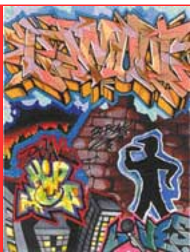
Hip Hop em Oeiras

DE 6 A 12 DE NOVEMBRO Centro de Juventude de Oeiras