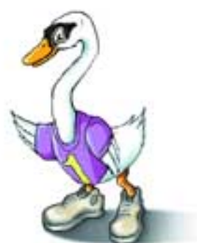
1º Encontro das Colectividades do Concelho de Oeiras

Controlo de Peso, Obesidade, Problemas de Costas, Suplementação Ergogénica, Actividades de Grupo, Nutrição, Treino de Força, Diabetes e Exercício, Traumatologia e Prevenção de Lesões, Psicologia do Exercício, Reabilitação Cardíaca, Doenças Cardiovasculares