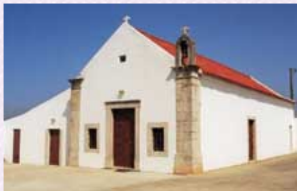
Fig. 5 -Igreja de Nossa Senhora do Socorro, Leão