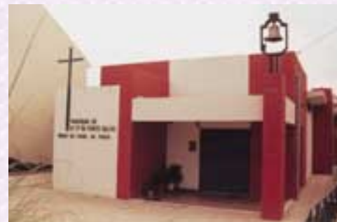
Fig.8-Igreja Casal da Choca