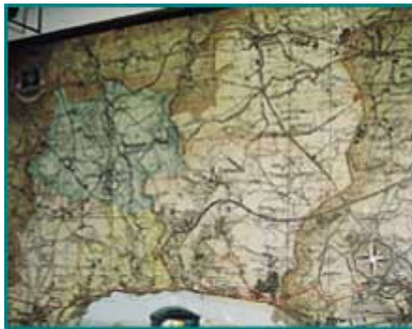
Painel sinóptico de controlo do sistema de telegestão