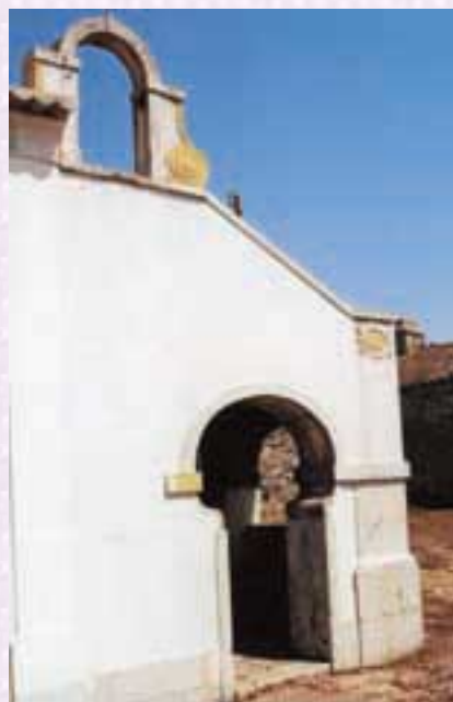
Fig. 4 -Pórtico com arco em ferradura que dá acesso à entrada lateral da capela. Em cima, campanário com voluta adossada