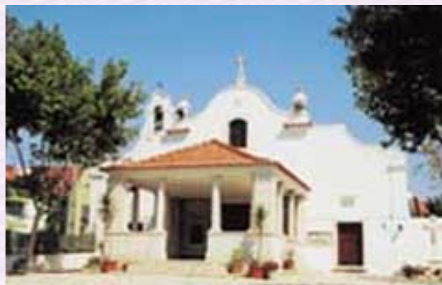
Fig. 1 - Fachada principal da Capela de Nossa Senhora de Porto Salvo.

No espaço geográfico da freguesia de Porto Salvo, estão localizados vários equipamentos religiosos, alguns de valor patrimonial e outros de construção mais recente. O mais significativo, é sem dúvida, a Capela de Porto Salvo. Localizada no núcleo antigo de Leião, apresenta uma fachada barroca, com dois fogaréis e um pequeno campanário, embelezada por um alpendre de cantaria (fig. 1). A actual capela poderá ser uma reconstrução do século XVIII que deu lugar à original ermida, do século XVI, construída por cumprimento de uma promessa pela salvação de vários tripulantes de uma nau que fazia a rota da Índia. De qualquer forma, este espaço constituiu-se, desde muito cedo, como local de devoção de navegantes e pescadores e, possivelmente, a designação de "Porto Salvo" passou a denominação do povoado. Segundo frei Agostinho de Santa Maria, a ermida foi restaurada e ampliada no segundo quartel do século XVII enquanto, Pinho Leal defende que foi totalmente reedificada. É certo que no final da primeira metade do século XVIII beneficiou de uma grande campanha de obras, na qual foi feito o actual retábulo-mor, púlpito, coro, pias de água benta, muro exterior e o revestimento azulejar interior e exterior. O interior da nave única apresenta painéis de azulejos historiados com cenas da vida de Cristo que, segundo José Meco, são da autoria de Oliveira Bernardes. Os painéis exteriores, muito danificados, representam cenas alusivas a Nossa Senhora do Cabo, são da mesma autoria e datam de 1740.