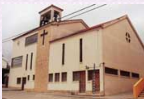
Fig.9-Igreja Senhora do Rosário

Para a construção da Igreja de Nossa Senhora do Rosário (fig. 9), na Lage, a comunidade organizou-se internamente, a partir de 1980, com as receitas dos Cânticos das Janeiras, a ajuda voluntária da população e o financiamento do empresário José Guilherme. A 20 de Junho de 1993 procedeu-se à dedicação da Igreja de Nossa Senhora do Rosário por D. António Ribeiro. Nas suas instalações funciona também, no rés--do-chão, um centro paroquial.