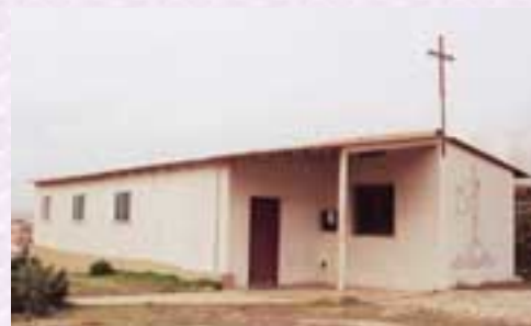
Fig.7-Igreja de Vila Fria

A Igreja do Casal da Choca (fig. 8) iniciou a sua construção em 1987 sendo concluída apenas em Junho de 1997. A traça do edifício é da autoria do Arqt. Carrilho e o projecto da responsabilidade do DPE (Departamento de Projectos Especiais) da Câmara Municipal de Oeiras.