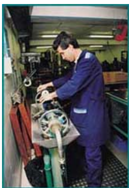
Aferição dos contadores de água

A água é considerada, actualmente, uma das maiores riquezas da natureza e um dos elementos essenciais à existência de todos os seres vivos e, sobretudo, do Homem, que nela tem uma das fontes da sua prosperidade. O progresso tecnológico tem vindo a encher as nossas casas de equipamentos que poupam tempo e esforço, mas que gastam grandes quantidades de água. O consumo tornou-se mais fácil, ignorando que a água é um recurso finito e escasso. Por isso, a sua conservação impõe-se, hoje e no futuro, em todos os usos que lhe damos. Não podemos deixar que o "petróleo do século XXI" se desperdice. Há que saber gastar e saber poupar!