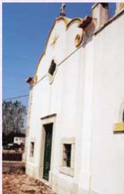
Fig. 3 -Fachada principal da Capela de Nossa Senhora da Piedade