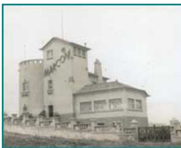
Primeira estação costeira em Linda-Velha, com o moinho á esquerda, finais da década de 40

Sob a designação que ainda hoje mantém, a Companhia Portuguesa Rádio Marconi foi fundada em 18 de Julho de 1925, tendo-se dedicado, durante os seus primeiros 15 anos de existência, exclusivamente à exploração do tráfego telegráfico internacional e com as ex-colónias, a única tecnologia avançada então existente.