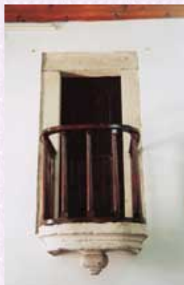
Fig. 6 -Púlpito. Igreja de Nossa Senhora do Socorro, Leão