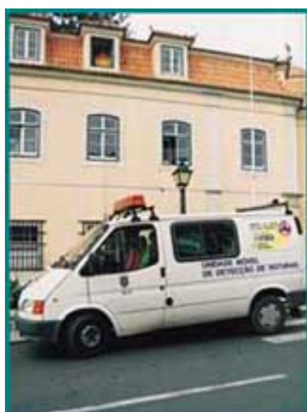
Carro para deteção de roturas na via pública

De facto, a política desenvolvida nos últimos anos, no sentido de aumentar significativamente as nossas capacidades de armazenamento de água, já permitiu minimizar o déficit de fornecimento de água pela EPAL, no último período de estiagem.