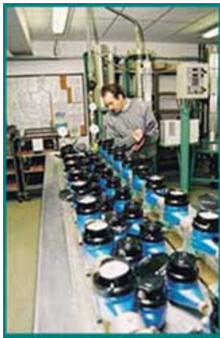
Oficina municipal de contadores, em Porto Salvo

Destaca-se o sistema de televigilância, já instalado em alguns reservatórios, que permite à distância - num posto central -, o controlo da intrusão, com emissão de alarme para os agentes de prevenção no perímetro dos reservatórios, através de detectores de infra-vermelhos, a monitorização da área interior do perímetro, através de câmaras de vídeo, gravação e transmissão de imagem.