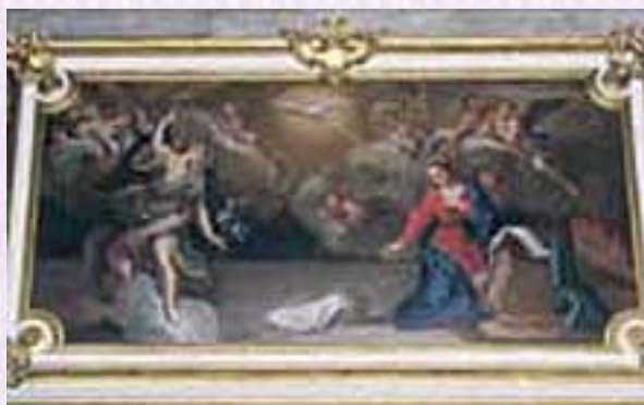
Fig. 2 -António Silva, Anúncio, 1743, Capela de Nossa Senhora de Porto Salvo

No espaço geográfico da freguesia de Porto Salvo, estão localizados vários equipamentos religiosos, alguns de valor patrimonial e outros de construção mais recente. O mais significativo, é sem dúvida, a Capela de Porto Salvo. Localizada no núcleo antigo de Leião, apresenta uma fachada barroca, com dois fogaréis e um pequeno campanário, embelezada por um alpendre de cantaria (fig. 1). A actual capela poderá ser uma reconstrução do século XVIII que deu lugar à original ermida, do século XVI, construída por cumprimento de uma promessa pela salvação de vários tripulantes de uma nau que fazia a rota da Índia. De qualquer forma, este espaço constituiu-se, desde muito cedo, como local de devoção de navegantes e pescadores e, possivelmente, a designação de "Porto Salvo" passou a denominação do povoado. Segundo frei Agostinho de Santa Maria, a ermida foi restaurada e ampliada no segundo quartel do século XVII enquanto, Pinho Leal defende que foi totalmente reedificada. É certo que no final da primeira metade do século XVIII beneficiou de uma grande campanha de obras, na qual foi feito o actual retábulo-mor, púlpito, coro, pias de água benta, muro exterior e o revestimento azulejar interior e exterior. O interior da nave única apresenta painéis de azulejos historiados com cenas da vida de Cristo que, segundo José Meco, são da autoria de Oliveira Bernardes. Os painéis exteriores, muito danificados, representam cenas alusivas a Nossa Senhora do Cabo, são da mesma autoria e datam de 1740.