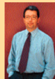
por Ricardo Leite Pinto