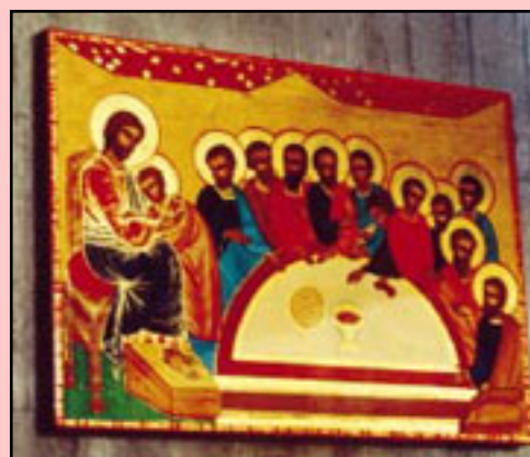
Fig. 8 - João Filipe, Última Ceia, 1993.