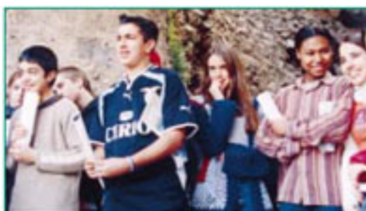
Visita de alunos da EB 2,3 aos Fornos da Cal, no Centro Histórico de Paço de Arcos

A exposição a que já fizemos referência contou, também, com uma venda de livros, postais e marcadores, relacionados com a temática, enquanto que nos dias 8, 13 e 22 de Março, a Câmara Municipal de Oeiras organizou diversas visitas aos centros históricos do concelho, dedicadas às turmas de todas as escolas dos ensino básico 2+3 e secundárias do concelho de Oeiras.