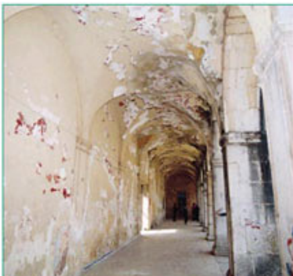
As arcadas do convento, local de passagem

Existem salas com graves deficiências eléctricas, com riscos eminentes de curto-circuito e, por sua vez, de incêndio, o que obriga a que as aulas sejam dadas, muitas vezes, às escuras. Imaginemos, agora, professores e alunos a mudar de sala, de hora em hora, e calculemos, desta forma, os riscos para a saúde a que a população escolar está sujeita. O refeitório - ou aquilo que mais se assemelha com isso -, a secretaria, a sala de computadores (!?) e outras dependências, são simples cubículos adaptados, com capacidade reduzida, mas que, apesar de tudo, ainda funcionam.