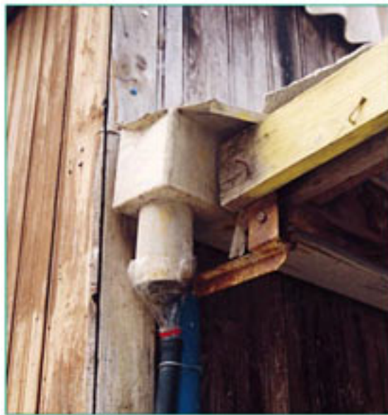
Sem palavras para a degradação a que se chegou