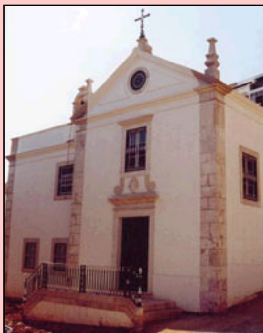
Fig. 1 - Fachada principal da Capela do Senhor Jesus dos Navegantes