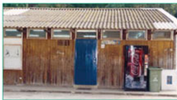
O pavilhão que serve de refeitório

No exterior, a situação mais complicada prende-se com as bonitas mas delapidadas arcadas que fazem parte do conjunto arquitectónico do convento, um lugar de passagem muito frequentado por toda a comunidade escolar, quer por ser um dos caminhos directos ao ginásio, quer por ser um local de protecção no Inverno e no Verão. Esse, é considerado um lugar proibido, dado que não oferece a mínima segurança, sendo uma constante a queda de pedaços de pedra e caliza que, por milagre, ainda não atingiram ninguém.