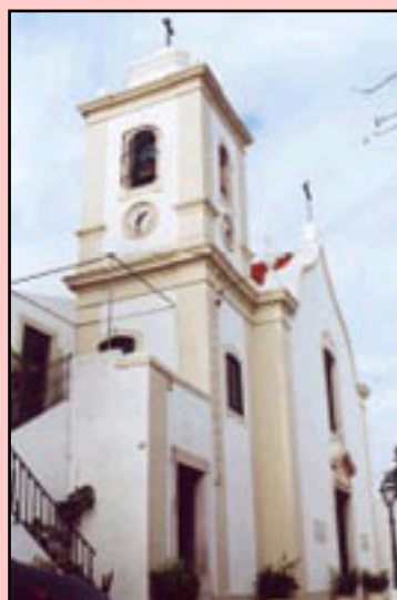
Fig. 3 - Igreja de Laveiras