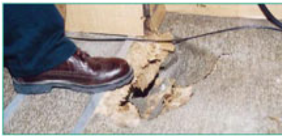
O estado do piso de um dos pavilhões