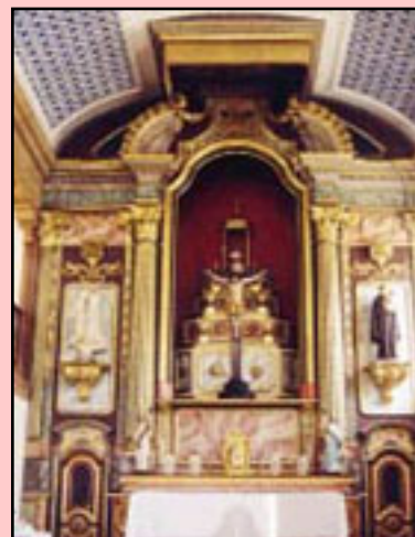
Fig. 2 - Retábulo-mor da Capela do Senhor Jesus dos Navegantes

A Capela do Senhor Jesus dos Navegantes, situada no núcleo antigo de Paço de Arcos, é um templo que remonta a 1698, tendo sido reedificado em finais do século XIX. Este templo beneficiou de obras de recuperação no seu exterior e interior, ao abrigo do Plano de Salvaguarda do Património Construído e Ambiental do Concelho de Oeiras. O exterior é pautado pela simplicidade da fachada, com um pórtico de linhas direitas, janelão e frontão triangular. No interior destaca-se o altarmor em talha dourada com trono, frontão interrompido rematado por uma sanefa que, no seu interior, contém uma pintura alusiva à Eucaristia.