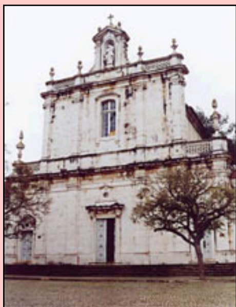
Fig. 5 - Igreja do antigo Convento da Cartuxa