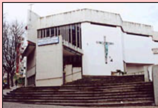
Fig. 6 - Igreja Paroquial de Paço de Arcos