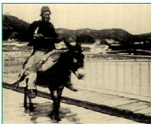
Memorial Histórico ou colecção de Memórias sobre Oeiras, II vol., Oeiras, 1982, p.15 Foto : Saloio montado num burro na ponte de Algés/ início séc. XX

Hoje, o campo das grandes vinhas, que em tempo não muito remoto, davam por ano 1500 pipas de vinho, está todo reduzido a terras de lavoura por seus próprios donos que impacientes as arrancaram. Azeite : Em mediana quantidade, o que muito melhor seria, se os olivais fossem mais bem povoados e mais bem tratados. Gado miúdo : Em geral próprio de Lavradores e Fazendeiros: carneiros, ovelhas, cordeiros, cabras, cabritos, leitões e coelhos. Aves domésticas : Tanto em geral, como em particular: galinhas, patos, gansos, perús, adens, pombos e rolas. Frutas de espinho : Laranja doce, laranja azeda e limão." (1) Durante séculos os traços fundamentais do concelho de Oeiras acentaram com efeito na ruralidade . Os vestígios que restam hoje são poucos ou nenhuns. Como nota final e para ilustrar , aqui fica a memória de um saloio em Algés , às portas de Lisboa, no início do séc. XX.