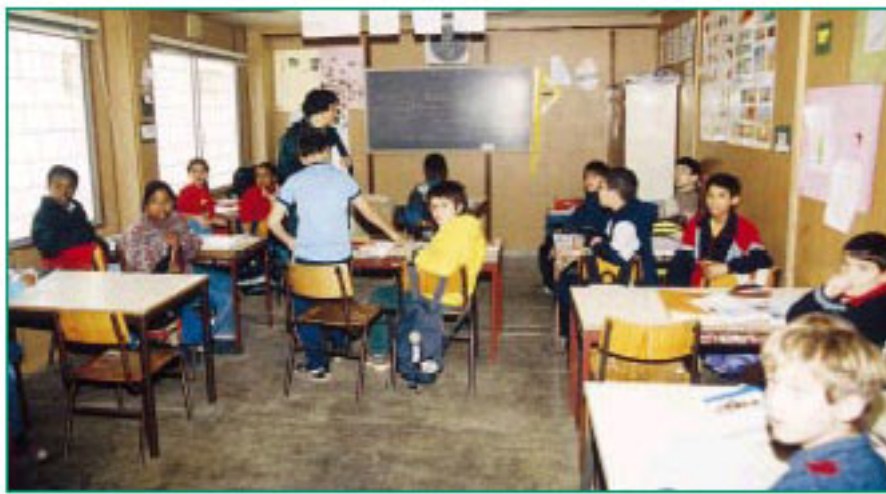
Um espaço exíguo e sem condições para tanta gente