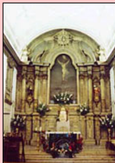
Fig. 4 - Capela-mor da Igreja de Laveiras

Outro templo desta freguesia é a Igreja de Laveiras, dedicada a Nossa Senhora das Dores. Provavelmente fundada no século XVII, sofreu um incêndio em 1870, após o qual foi totalmente reconstruída e ampliada, abrindo ao culto 19 anos mais tarde. A sua fachada tem adossada uma torre sineira. No seu interior, o altarmor em talha dourada, enquadra um Calvário de características ainda barrocas.