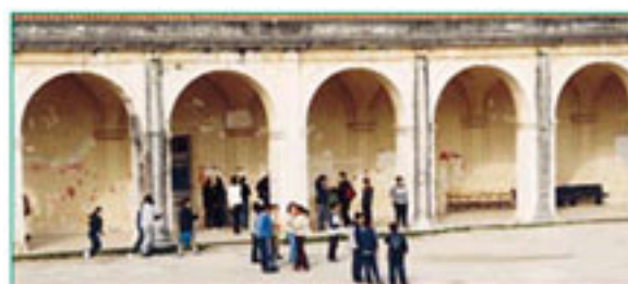
O espaço de recreio a fazer lembrar outros ambientes

"Foram negociações morosas, com certeza difíceis, mas o certo é que nesse mesmo ano já tínhamos em nosso poder a planta referente ao novo estabelecimento de ensino: aí, voltámos a sonhar, um sonho que, mesmo assim, durou três anos. Só no ano passado é que tudo ficou resolvido entre todas as entidades, dado que havia problemas relacionados com as negociações dos terrenos indispensáveis para a construção da escola. Mesmo assim, e por volta de 1998, a Câmara Municipal de Oeiras lançou-se de imediato nas obras de terraplenagem e movimentação de terras. Finalmente, em Maio de 2000, saiu o anúncio da obra em Diário da República, com o processo a ser remetido ao Tribunal de Contas em Dezembro último. Em Janeiro deste ano apanhámos um susto enorme quando tivemos conhecimento que o Tribunal de Contas tinha rejeitado o processo, remetendo-o à sua origem, devido, segundo julgamos saber, a alguns pormenores menos explícitos.