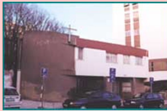
Fig. 6 - Igreja Paroquial de Cristo Rei (Algés)

Situada no núcleo antigo de Algés de Cima, propriedade da Junta de Freguesia de Algés, a capela de Nossa Senhora do Cabo (fig. 8), é um pequeno templo construído como local de culto, de romaria a Nossa Senhora do Cabo, e foi um dos locais de peregrinação originada pela lenda de Nossa Senhora do Cabo Espichel. Esta rota, que incluía 30 freguesias, entre as quais Carnaxide, era organizada no século XVII sob as directrizes de uma Irmandade com o mesmo nome. No seu interior destaca-se uma exígua capela-mor (fig. 9) dedicada à padroeira. A capela está integrada num conjunto rural, que inclui alguns vestígios de casas de lavoura nas traseiras. A esta paróquia pertence, também, a capela de Nossa Senhora do Pilar (fig. 10), também localizada no rés-do-chão de um prédio habitacional que serve a população de Miraflores.