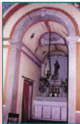
Fig. 9 - Interior da Capela de Nossa Senhora do Cabo (pormenor da capela-mor)