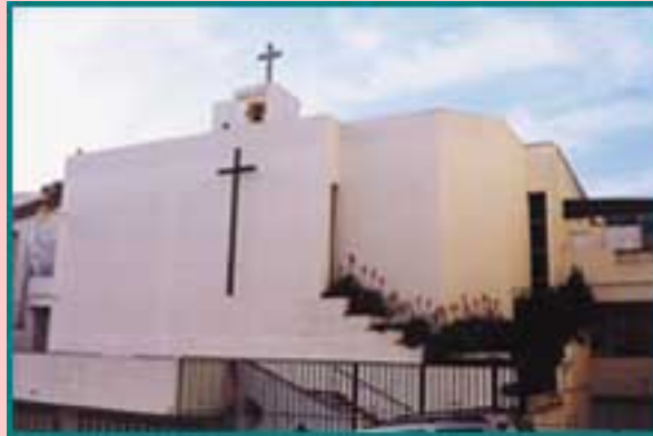
Fig. 5 - Igreja Paroquial do Senhor Jesus dos Aflitos (Cruz Quebrada/Dafundo)

A capela de Nossa Senhora da Boa Viagem (fig. 3), construída em 1734 conforme a inscrição, actualmente fechada ao culto, é um pequeno templo de nave única com uma pequena loggia anexa. A sua fachada principal é revestida a azulejos de figura avulsa datados dos sécs. XVII-XVIII (fig. 4) e rematada por frontão triangular. Apresenta alguns sinais de degradação. Dedicada a Nossa Senhora da Boa Viagem, padroeira venerada por senhores da corte e pescadores, esta capela, que mudou de sítio devido à planificação do Estádio Nacional, fez parte possivelmente do antigo convento de Nossa Senhora da Boa Viagem.