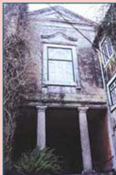
Fig. 2 - Capela do antigo convento S. José de Ribamar (Algés)

As freguesias da Cruz Quebrada/Dafundo, e Algés, pela sua situação geográfica privilegiada na margem direita do rio Tejo são desde há muito, pólos fixadores de população, que remontam aos primórdios da nacionalidade. Estes locais foram escolhidos para a fundação dos conventos e ermidas que exerciam uma profunda influência sócio-religiosa na vida quotidiana das populações. Um exemplo disso foi a antiga ermida de Santa Catarina de Ribamar que exerceu funções como sede de freguesia até ao século XIV. O antigo convento de Santa Catarina de Ribamar, foi erigido para albergar os frades arrábidos, sub-ordem dos franciscanos, criada na Serra da Arrábida em 1542.