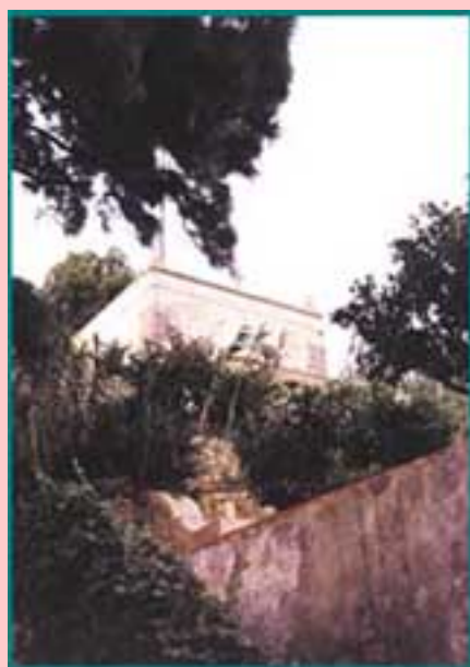
Fig. 1 - Ermida de Santa Catarina de Ribamar (Dafundo)