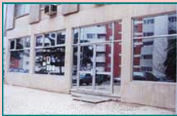
Fig. 9 - Interior da Capela de Nossa Senhora do Cabo (pormenor da capela-mor)