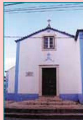
Fig. 8 - Capela de Nossa Senhora do Cabo (Algés)

A Igreja do Senhor Jesus dos Aflitos (fig. 5) pertence à paróquia do mesmo nome e é igreja paroquial da Cruz Quebrada/Dafundo. Este templo foi inaugurado a 23 de Julho de 1972, resultando de doações particulares, quer do terreno como do templo. O projecto foi da autoria dos arquitectos Martins Cabido, Carlos Roque e Pedro Mestre. A Igreja Paroquial de Algés (fig. 6) pertence à paróquia de Cristo Rei, e está localizada na cave de um prédio habitacional. De destacar, no interior deste templo (fig. 7), uma pintura a tempera sob fundo de madeira, que representa Cristo em Majestade. Esta interessante obra de José D. Filipe lembra os esquemas compositivos da arte gótica de perspectiva invertida, cores primárias (com o seu simbolismo inerente) e de fundo dourado. O Cristo, rodeado pelos atributos dos quatro evangelistas, apresenta características da arte bizantina, especialmente no tratamento da sua face. Este quadro constitui um excelente exemplo de arte sacra moderna, com a devida reinterpretação formal medieval que não ocultou a perícia e erudição do artista.