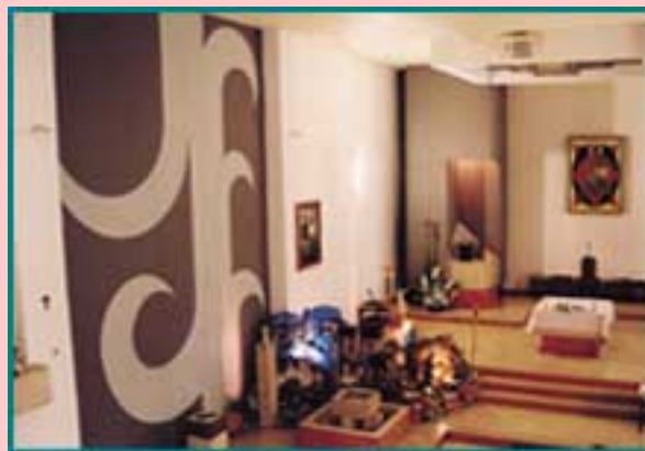
Fig. 7 - Interior da Igreja Paroquial de Cristo Rei. Na capela-mor, a pintura Cristo em Majestade da autoria de José D. Filipe

Situada no núcleo antigo de Algés de Cima, propriedade da Junta de Freguesia de Algés, a capela de Nossa Senhora do Cabo (fig. 8), é um pequeno templo construído como local de culto, de romaria a Nossa Senhora do Cabo, e foi um dos locais de peregrinação originada pela lenda de Nossa Senhora do Cabo Espichel. Esta rota, que incluía 30 freguesias, entre as quais Carnaxide, era organizada no século XVII sob as directrizes de uma Irmandade com o mesmo nome. No seu interior destaca-se uma exígua capela-mor (fig. 9) dedicada à padroeira. A capela está integrada num conjunto rural, que inclui alguns vestígios de casas de lavoura nas traseiras. A esta paróquia pertence, também, a capela de Nossa Senhora do Pilar (fig. 10), também localizada no rés-do-chão de um prédio habitacional que serve a população de Miraflores.