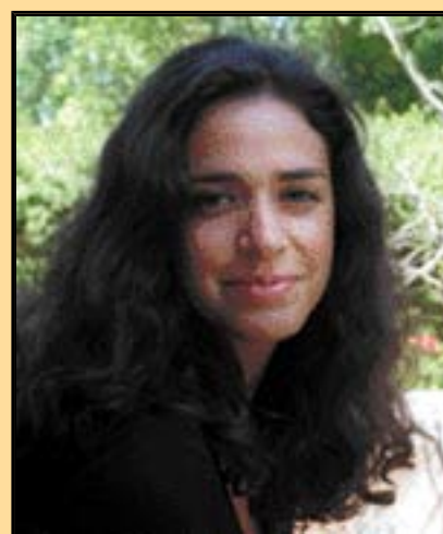
POR CARLA ROCHA

Depois de reflectir cheguei à conclusão que talvez seja assim mesmo. Afinal, o filme nada possui que realmente interesse à classe masculina.