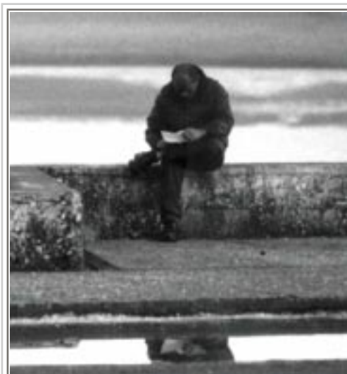
Encontros de Poesia [dia 21, Aud. Municipal Eunice Muñoz]

Durante os próximos três meses Oeiras vai homenagear alguns dos grandes poetas nacionais, através da sua obra e pela voz de alguns dos nossos melhores actores e declamadores. O objectivo destes Encontros de Poesia é aprofundar o conhecimento desses vultos que marcaram a poesia portuguesa, relacioná-los entre si e com o seu Tempo, divulgando-os e aprofundando-os, dando ainda relevo à poesia no feminino. Tendo por moderador o escritor Urbano Tavares Rodrigues, o primeiro momento dos cinco que constituirão estes Encontros de Poesia irá percorrer a obra de Fernando Pessoa, lançar um olhar sobre a poetisa Florbela Espanca e recordar Camilo Pessanha, Mário de Sá Carneiro e Almada Negreiros.