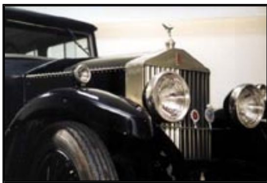
Museu do Automóvel Antigo

Alameda Calouste Gulbenkian Paço de Arcos, Tel. 21 441 06 33 De segunda a sexta-feira das 10h00 às 13h00 e das 15h00 às 18h00 Sábados e Domingos das 10h00 às 18h00