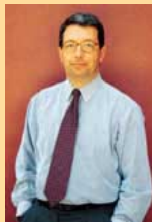
por Ricardo Leite Pinto

Lisboa e o seu Rio deram á poesia portuguesa algumas das suas obras-primas. O sol, a luz, o branco, as gentes, o rio, as velas, a monotonia, a chuva, os sons, as janelas, a memória, surgem-nos reunidas numa excelente compilação de poesias sobre Lisboa. Como todas as selecções faltam autores e textos e sobram outros. É próprio das colectâneas . De resto o livro não pretende ser uma antologia, escrevem as organizadoras . E não é de todo um simples "ajuntamento" de poemas. É antes uma aconchego de alma , iluminando várias Lisboas : a dos "fios de sangue" de Al Berto ,a da "luz do sol mais clara, mais cintilante , maior" de António Botto, a da "névoa onde começa a luz" de Eugénio de Andrade, a das " várias cores das casas" de Fernando Pessoa, a do " voo de gaivotas esquecido" de Graça Moura, a das " cores profundas do Tejo" de Adolfo Casais Monteiro, a das ruas do Bairro Alto "estradas caravaneiras" de João Miguel Fernandes Jorge, a do "Vício que sai á noite aos becos e ás ruelas" de Gomes Leal, a da "Calçada de Carriche de António Gedeão, a das "Palavras com guitarras " de Manuel Alegre. E tantas tantas outras. A escolher uma Lisboa , privilégio do leitor, iria seguramente para esse momento mágico da literatura portuguesa " O sentimento dum Ocidental" de Cesário Lisboa. O poema que qualquer poeta (ou candidato a poeta) gostaria de ter escrito . Começa assim: