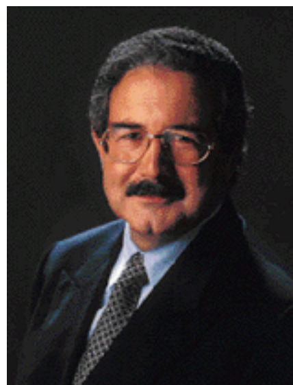
Isaltino Moraes Presidente da Câmara Municipal de Oeiras

Em Fevereiro não deixe de visitar os nossos espaços e usufruir de todo o que temos para lhe oferecer