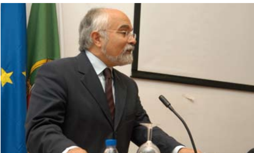
Secretário de Estado da Administração Interna esteve em Oeiras

Visando conter a combater a criminalidade exercida sobre condutores de veículos de táxi, a Câmara Municipal de Oeiras aderiu ao Projecto Táxi Seguro, recentemente implementado pelo Ministério da Administração Interna.