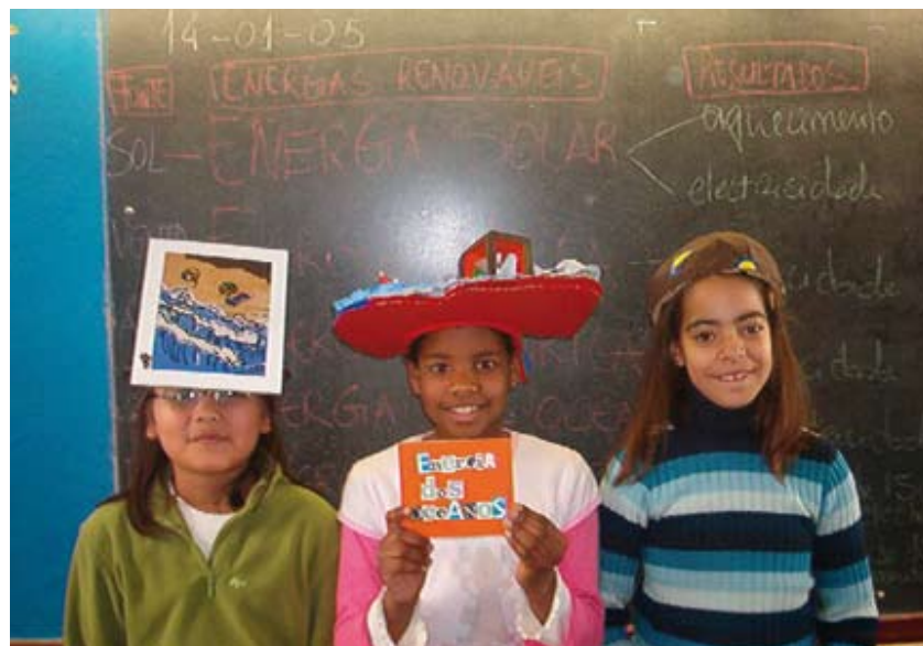
Acção de sensibilização sobre energias renováveis

Na temática do Ar, são promovidas visitas de estudo à Estação de Moni-