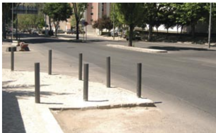
Colocação de pinos na Avenida dos Bombeiros Voluntários, em Algés