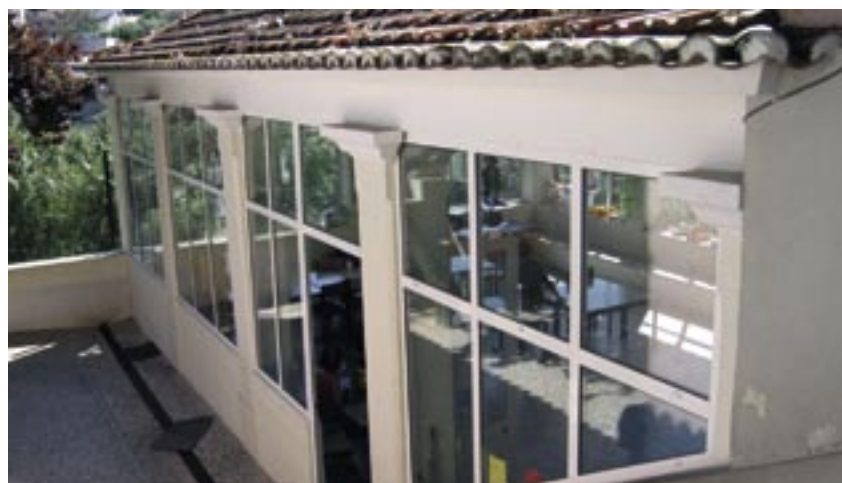
Intervenção na EB 1 Manuel Vaz, em Barcarena: colocação de estrutura de alumínio