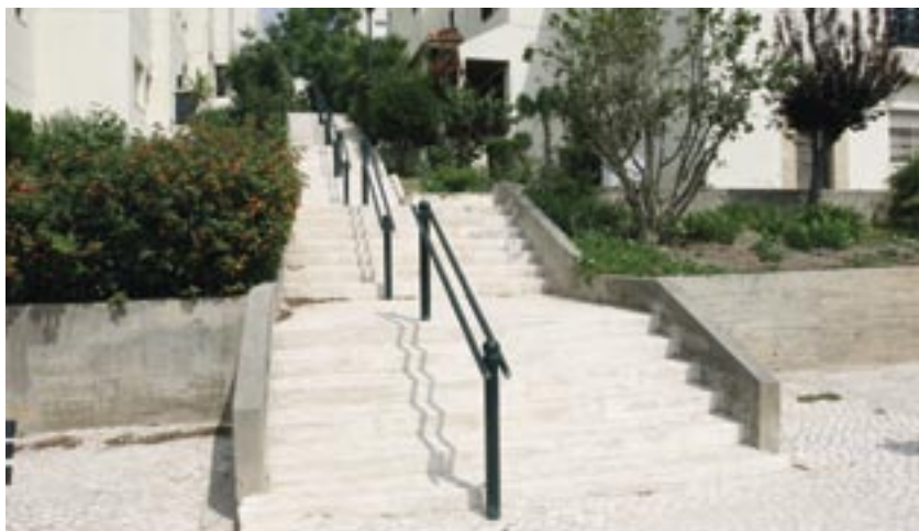
Recuperação de escadas e colocação de corrimão na R. Pêro de Alenquer, no Alto do Lagoal, em Caxias