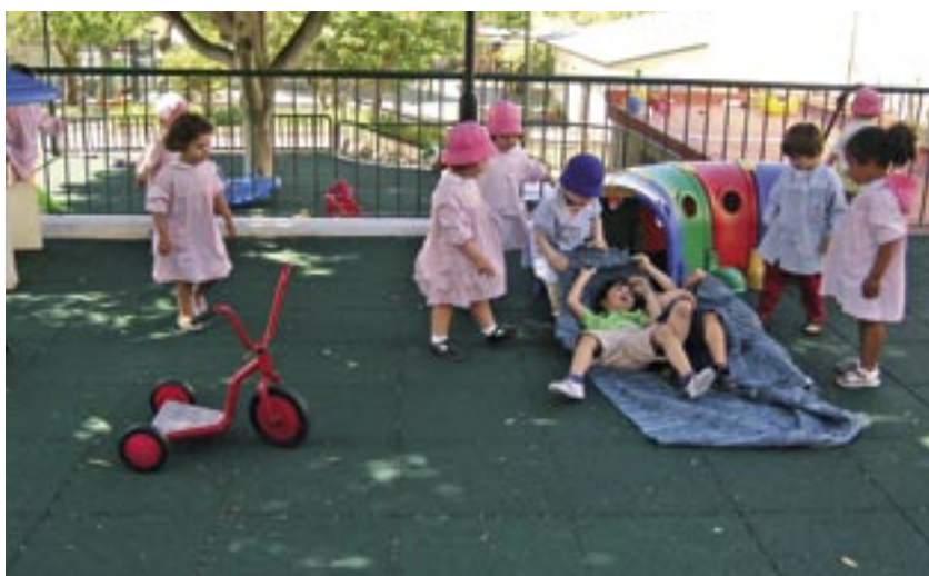
Creche e Jardim-de-infância 1.º de Maio, em Carnaxide