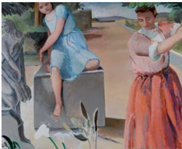
Menez, Sem Titulo, 1988, Acrílico sobre tela, 155 x 190 cm