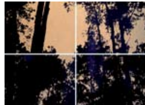
Pintura de Domingos Loureiro

GALERIA DE ARTE DA FUNDAÇÃO MARQUÊS DE POMBAL, LINDA-A-VELHA