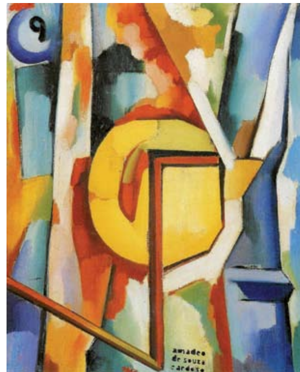
Amadeu Souza-Cardoso, “Moinhos”, c. 1914-15, Óleo sobre tela, 40,5 x 33 cm

Informações e reservas: Intervalo - Grupo de Teatro, tel./fax. 214 141 739