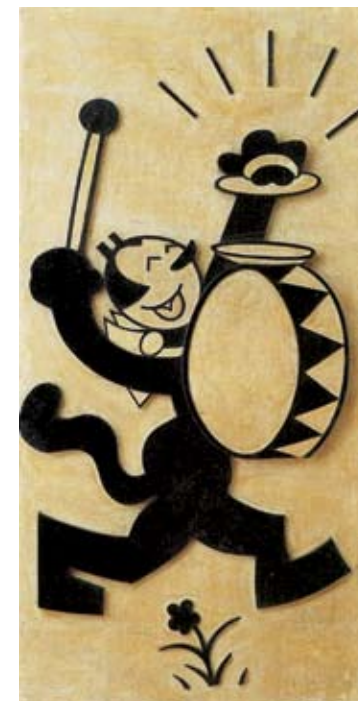
José de Almada Negreiros, Gato Félix, 1929, baixo-relevo em gesso 120,2 x 60,2 cm

O projecto Marginal é o resultado de um trabalho de observação e estudo fotográfico desenvolvido durante três meses pela artista, e que visou documentar um momento específico de um espaço em continua mutação, a Marginal.