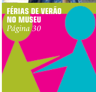
FÉRIAS DE VERÃO NO MUSEU Página 30