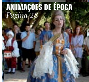
ANIMAÇÕES DE ÉPOCA Página 28