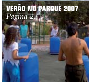
VERÃO NO PARQUE 2007 Página 23