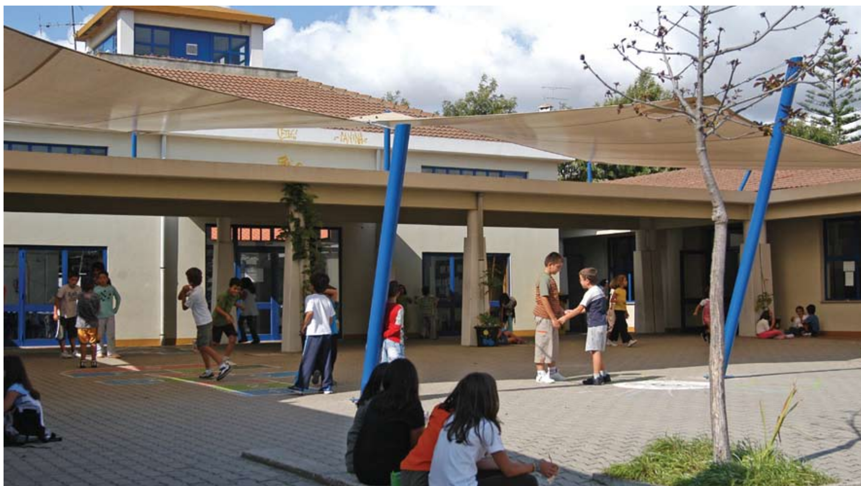
Nova cobertura da EB1 António Rebelo de Andrade, em Oeiras