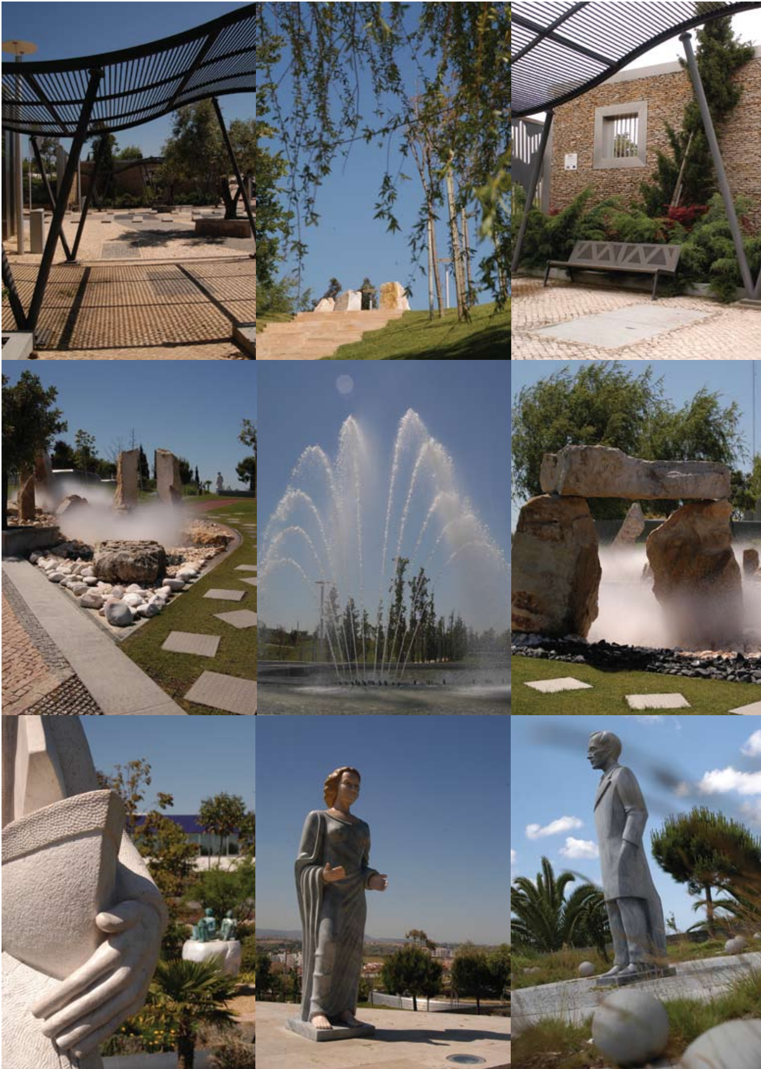
Parque dos Poetas para Ver de Perto. Por Carmo Montanha