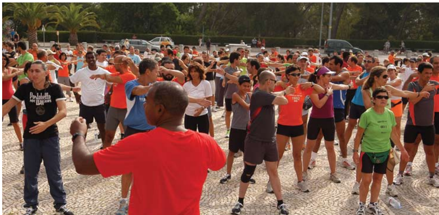
O muito participado treino para a Corrida do Tejo

Mais Informações: Divisão de Desporto da Câmara Municipal de Oeiras, telefone 214 408 540, e-mail: dd.eventos@cm-oeiras.pt , www.corridadotejo.com