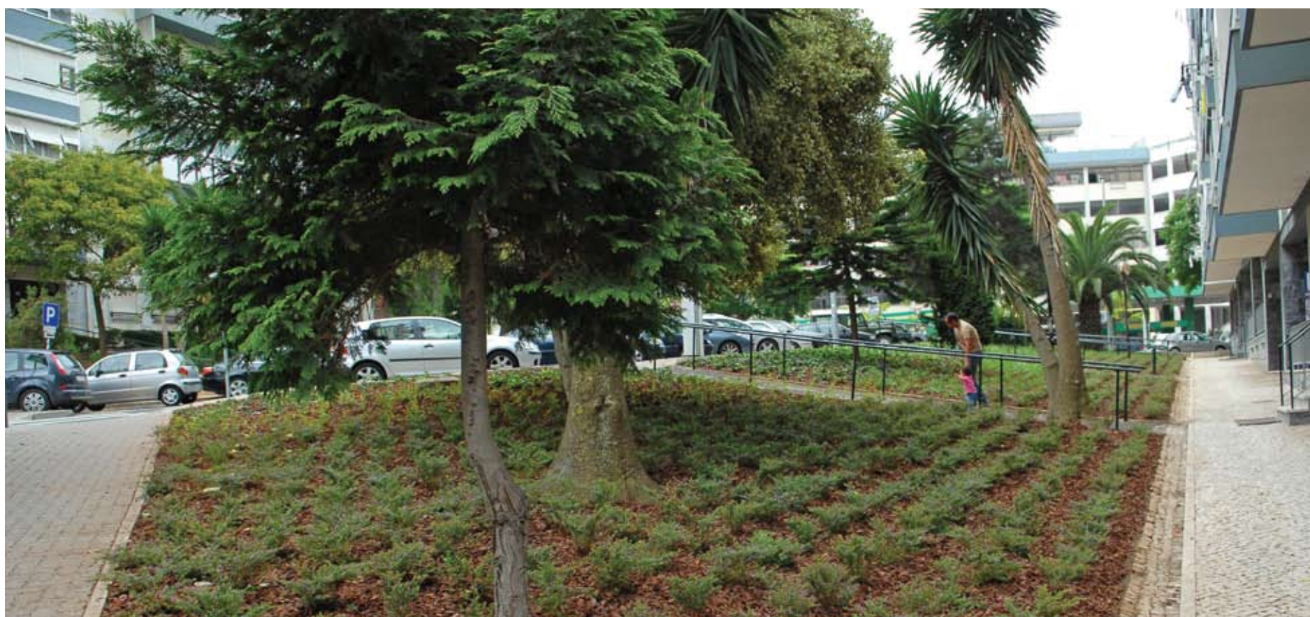
Pracetas de Carnaxide requalificadas

Registe-se que a criação desta infra-estrutura estava contemplada no Plano Estratégico para a Gestão dos Animais de Companhia que a Câmara Municipal está a desenvolver, na perspectiva de contribuir para a construção e promoção de uma cultura de responsabilidade na gestão dos animais de companhia, procurando criar condições necessárias à tomada de consciência e mudança de atitudes em relação à forma de tratamento dos animais.