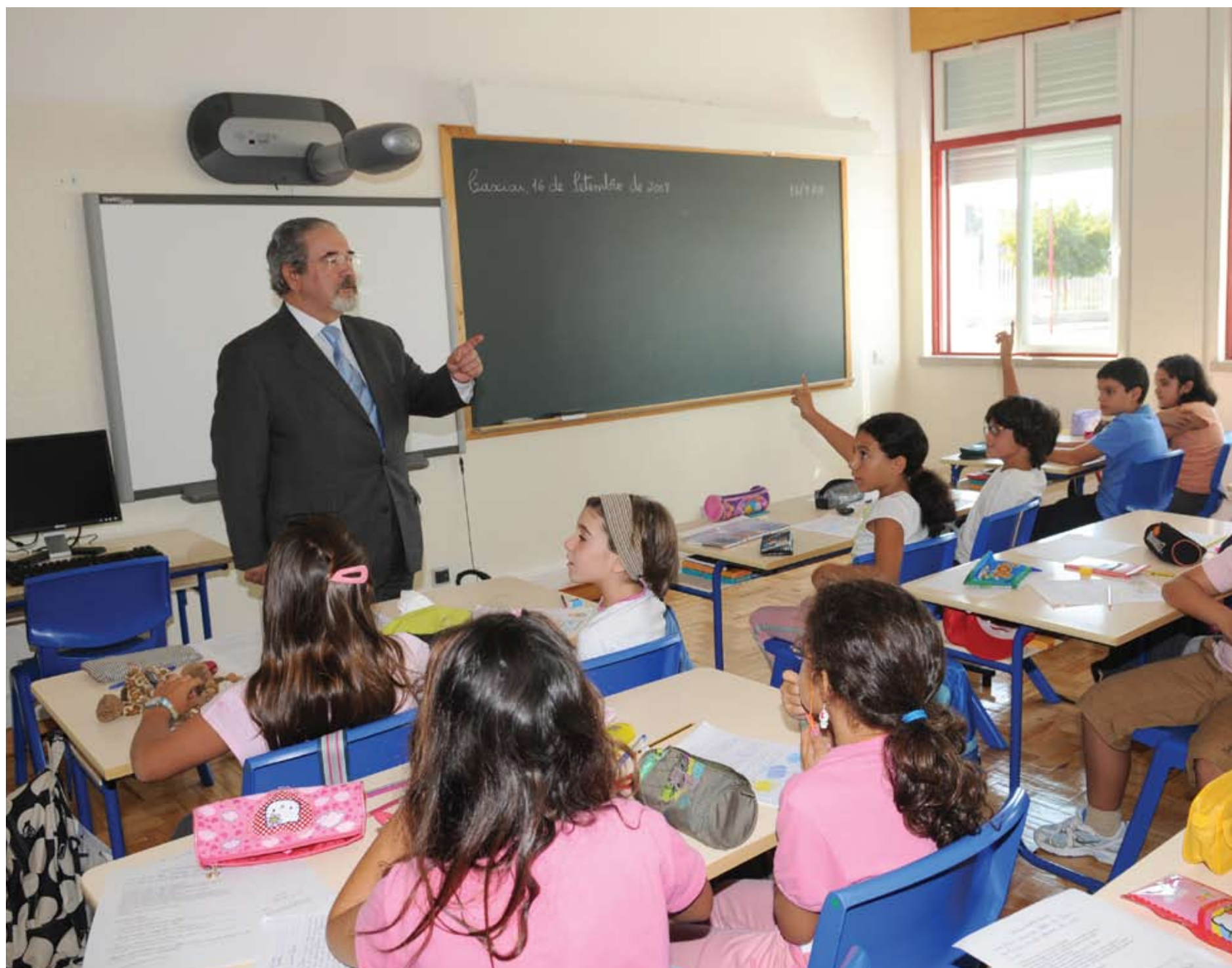
O presidente da Câmara em visita às escolas

Mais de quatro milhões de euros foram investidos, pela Câmara Municipal, durante o Verão, na beneficiação do parque escolar do concelho e na instalação de quadros interactivos. No dia em que a grande maioria das crianças começava as aulas, o presidente da Câmara visitou quatro das quinze escolas que, durante as férias, receberam melhoramentos.