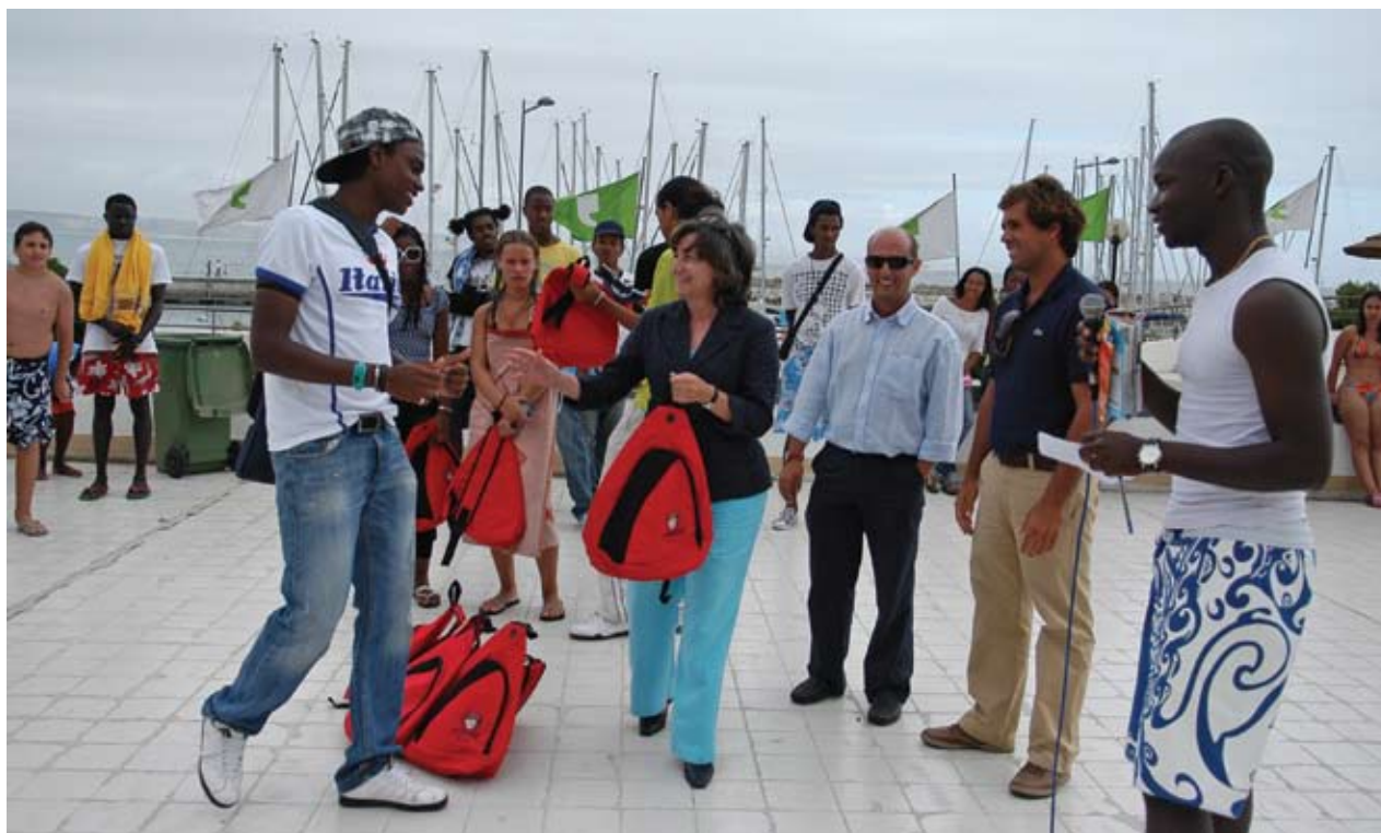
No final da festa, a distribuição de lembranças

Como forma de celebração do trabalho efectuado, os participantes nos projectos “Tempo Jovem”, “Mexe-te nas Férias” e “Jovens em Movimento” reúnem-se para um dia de convívio, marcado por diversas actividades na piscina – animação musical assegurada por um disc jockey, dança, insuflável aquático – coroadas pela eleição, entre os presentes, da Miss e do Mister Piscina Oceânica.