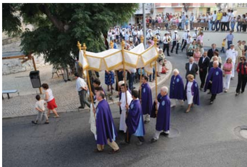
Procissão em honra de Nossa Senhora das Dores, em Caxias