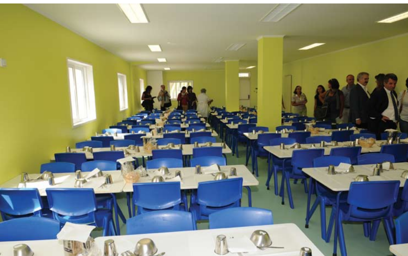
O novo refeitório da EB/JI Amélia Vieira Luís, na Outurela