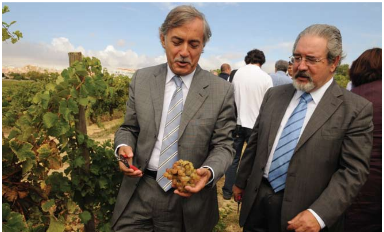
O presidente da Câmara, Isaltino Morais, e o ministro da Agricultura, Jaime Silva

Nesta 'Festa da Vindima' participaram, ainda, o presidente da Câmara, Isaltino Morais, vários elementos do Executivo municipal, presidentes de juntas de freguesia e outros autarcas.