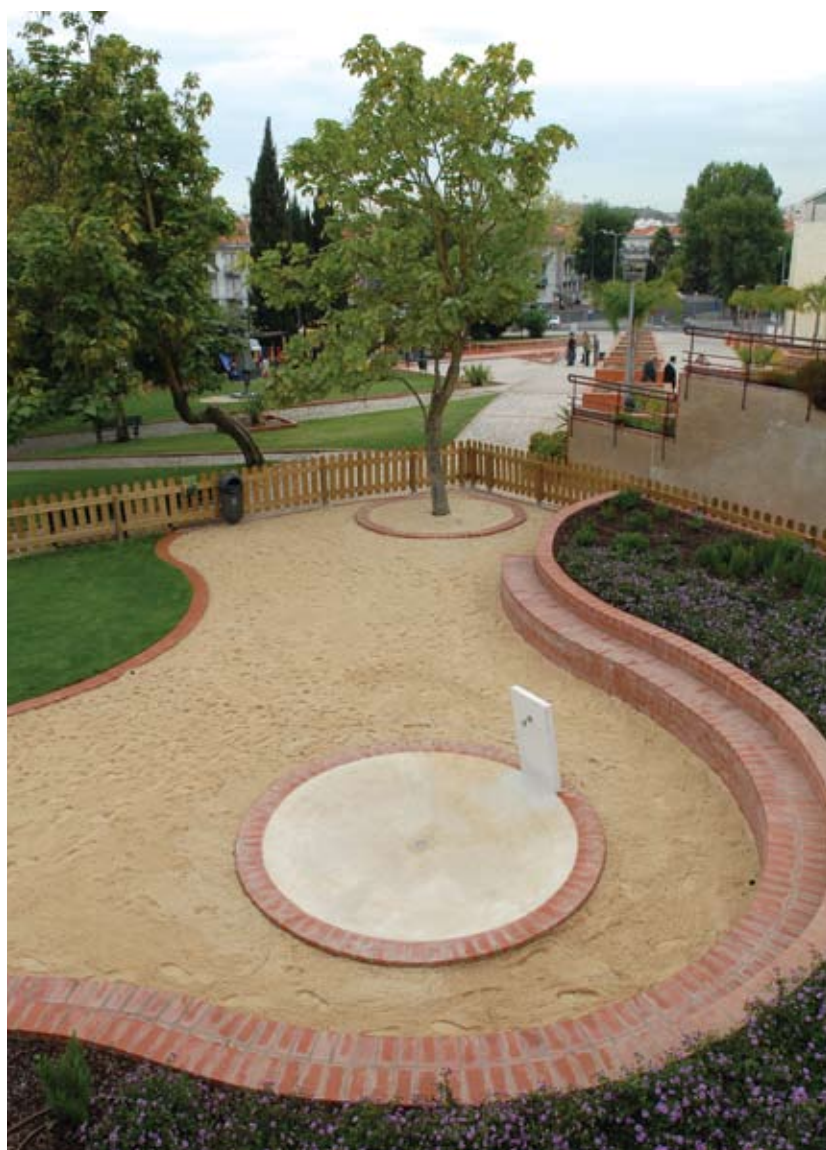
Nova área canina no Centro Cívico de Carnaxide