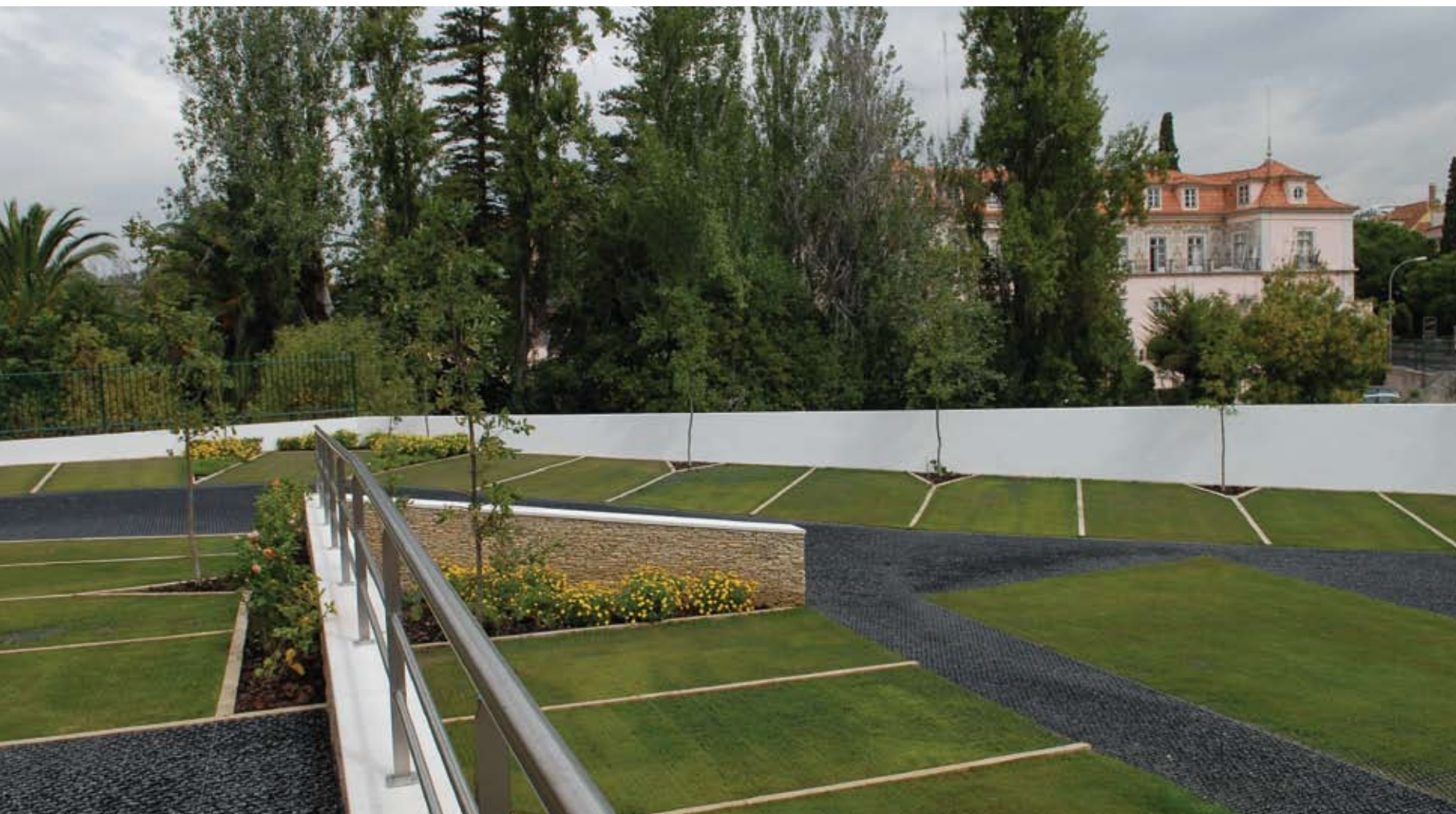
Vista do novo parque de estacionamento do Instituto Gulbenkian de Ciência

Recorde-se que o IGC, importante centro de investigação e de ensino em biomedicina, se encontra localizado na continuação dos jardins do Palácio Marquês de Pombal, em Oeiras.