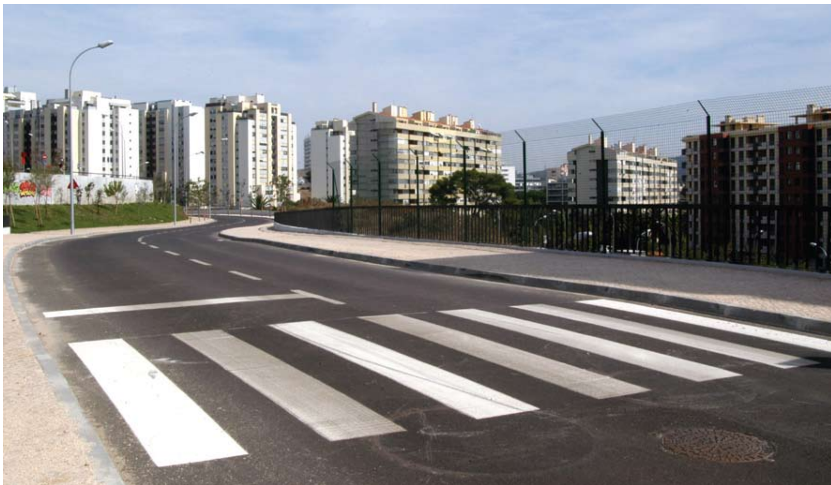
Uma cerimónia de inauguração realizada no passado dia 20 de Setembro assinalou a abertura ao trânsito de uma nova de ligação entre as freguesias de Linda-a-Velha e de Algés. Pág. 4