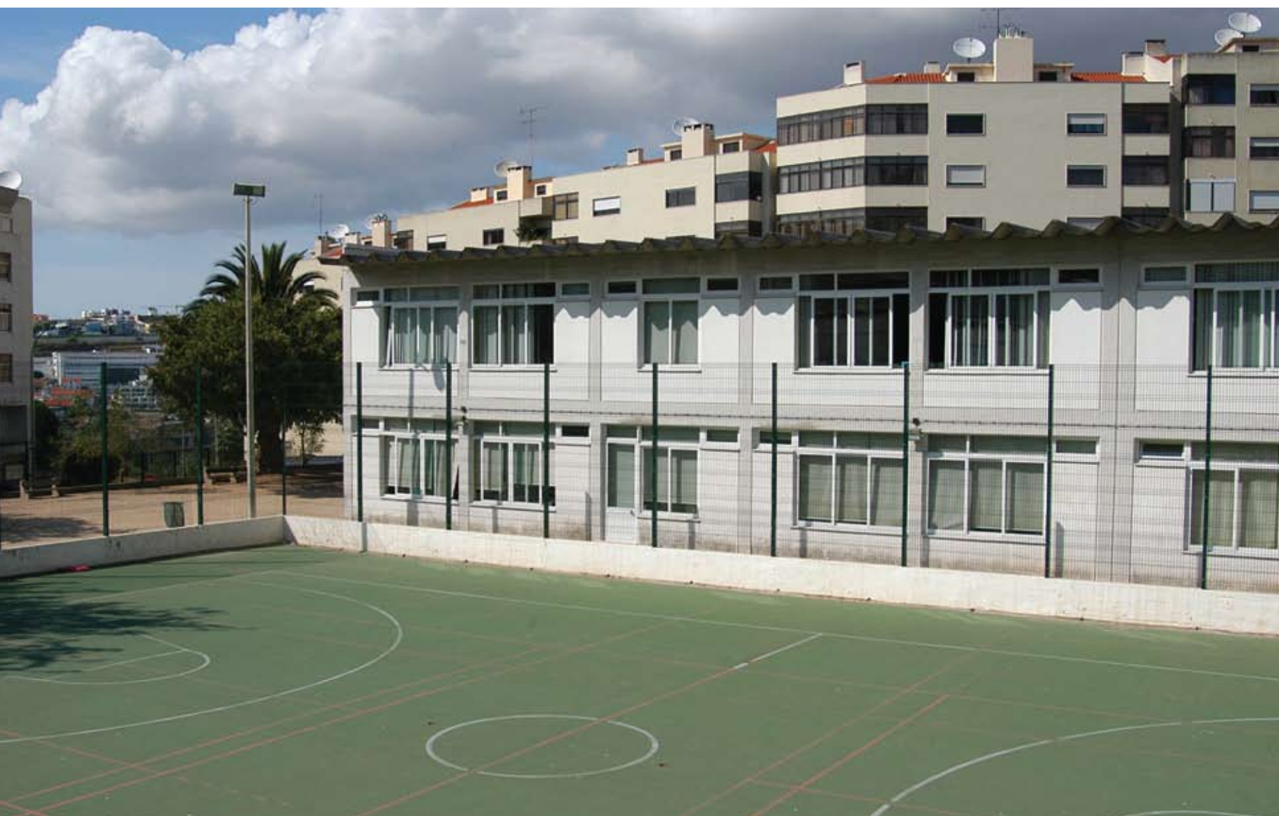
Substituição geral de caixilharias na EB1 D. Pedro V, em Linda-a-Velha