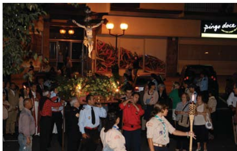
Festas em honra do Senhor Jesus dos Navegantes, em Paço de Arcos