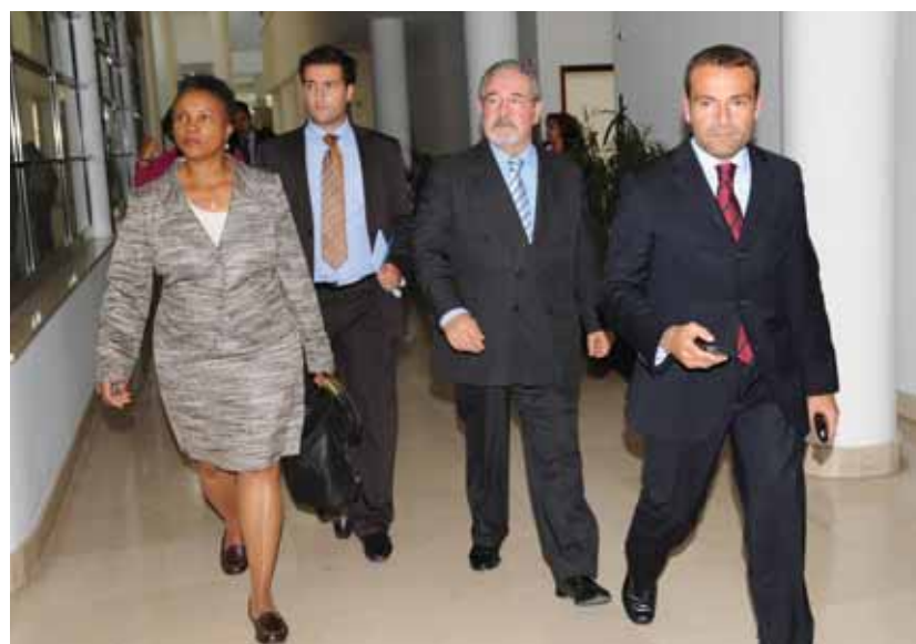
De visita aos SMAS de Oeiras e Amadora

A presidente de câmara norte-americana deixou em aberto a possibilidade de futuras conversações com algumas destas entidades, tendo em vista a hipotética instalação de pólos universitários em Oeiras.