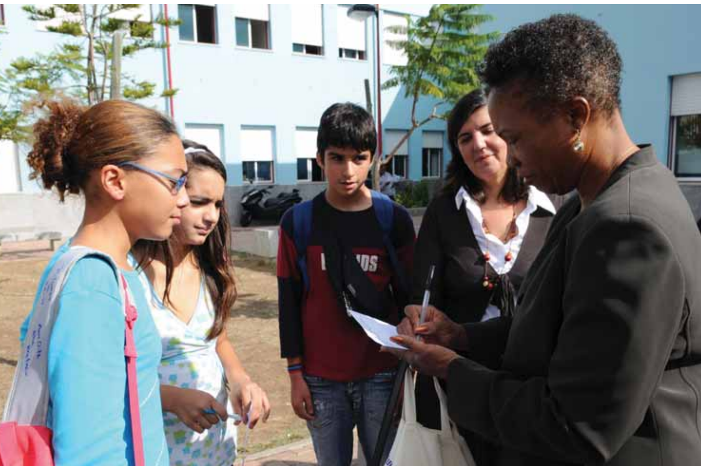
A mayor de Cambridge em contacto com os alunos da Escola de São Bruno