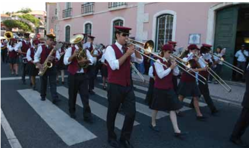
XIX Encontro de Bandas do Concelho – Desfile junto aos Paços do Concelho, em Oeiras