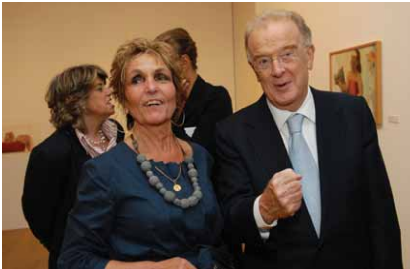
Paula Rego e Jorge Sampaio