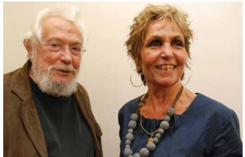
Júlio Pomar e Paula Rego