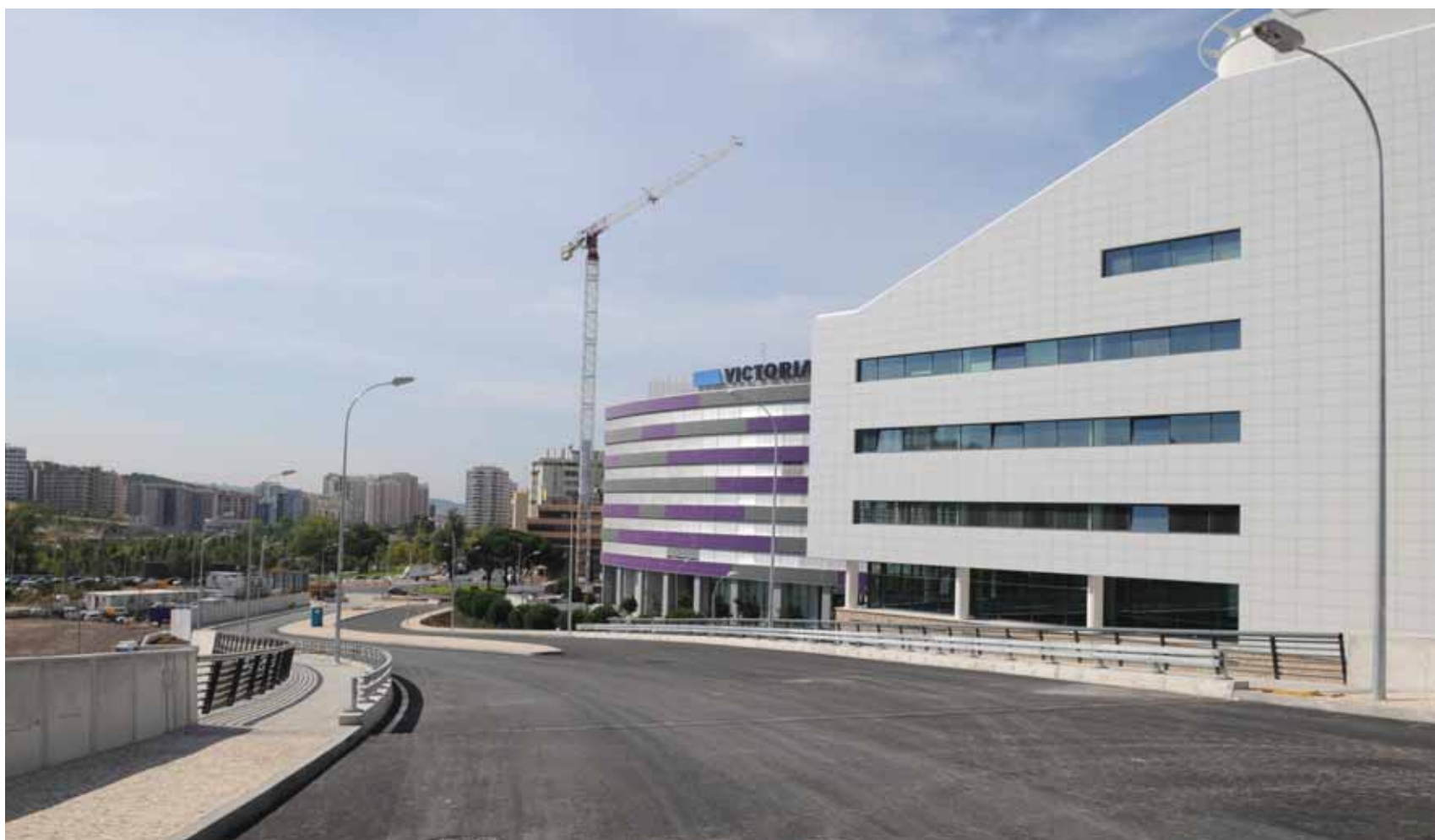
A Via Longitudinal a Norte da A5 vai permitir reequilibrar os fluxos de tráfego cuja origem ou destino sejam Carnaxide/Outurela e Portela, Algés/Miraflores ou Linda-a-Velha, aliviar a procura no nó da A5 de Carnaxide/Linda-a-Velha e também nos acessos da CRIL a Miraflores.