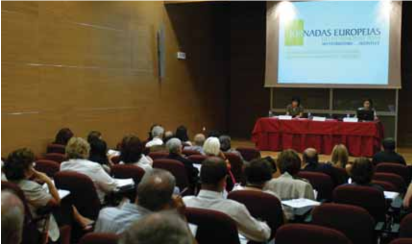
Jornadas Europeias do Património 2008: Conferência 'Plano de Urbanização da Costa do Sol – Uma Visão Inovadora para o Território', Auditório Municipal Maestro César Batalha, em Oeiras

Manifestações religiosas e culturais de índoles diversas mobilizaram ao longo das últimas semanas centenas de munícipes, atraindo, também, visitantes ao concelho.