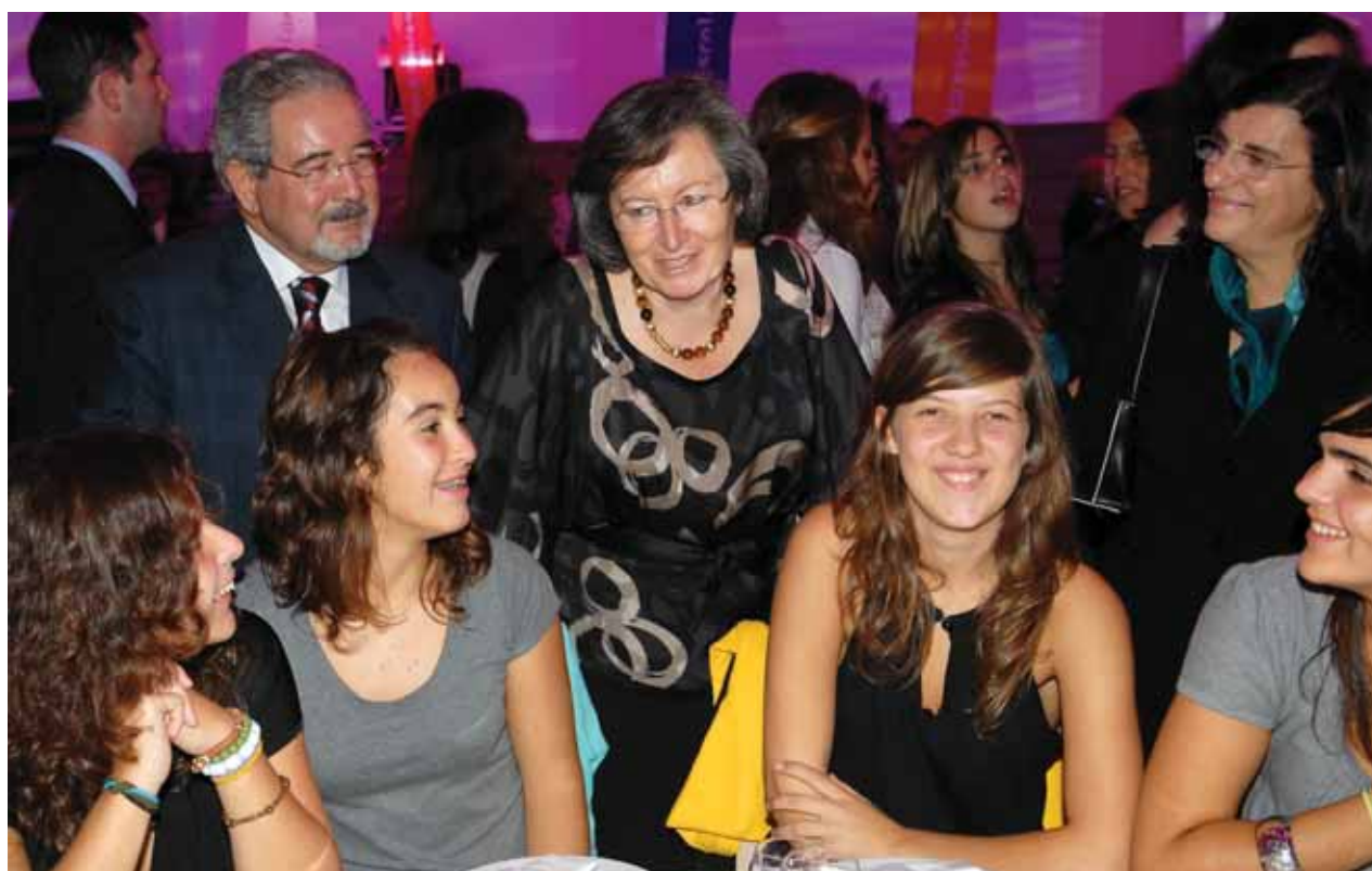
Na foto, o presidente da Câmara, Isaltino Morais, e a ministra da Educação, Maria de Lurdes Rodrigues