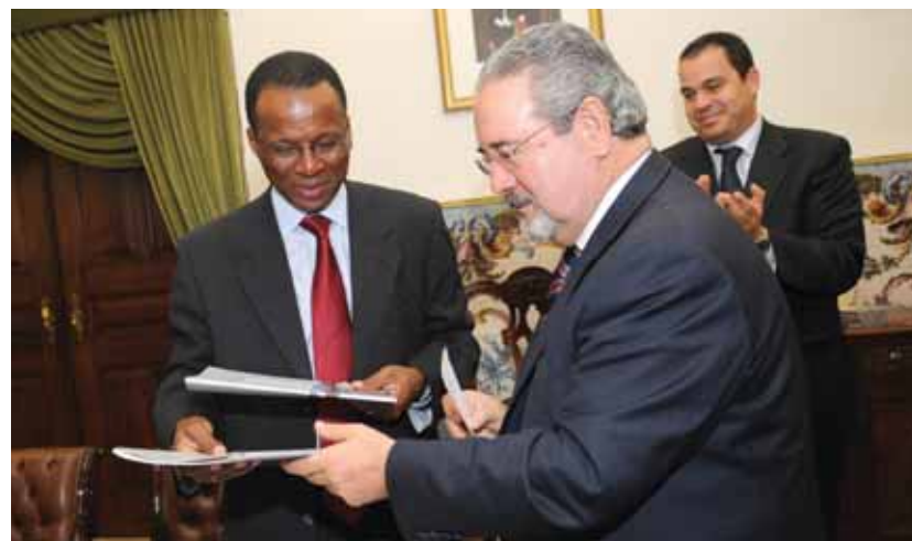
José Ulisses Correia e Silva com Isaltino Morais

Desenvolver acções conjuntas que contribuam para a melhoria e desenvolvimento do município da Praia, em Cabo Verde, é o principal objectivo de um protocolo de cooperação firmado entre as câmaras municipais de Oeiras e da Praia, em finais de Outubro.