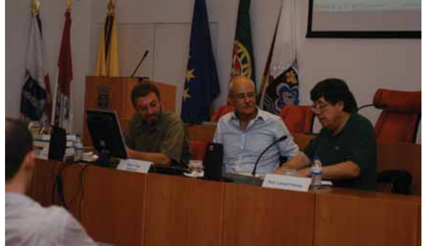
'Conversas na Aldeia Global' (3.º ciclo), com Nuno Crato e Carlos Fiolhais, no Auditório da Biblioteca Municipal de Oeiras