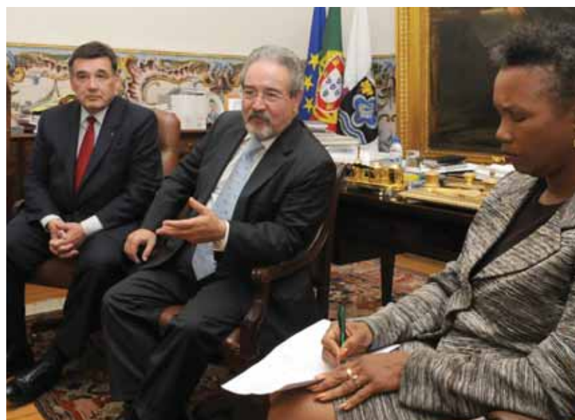
Nos Paços do Concelho, em Oeiras