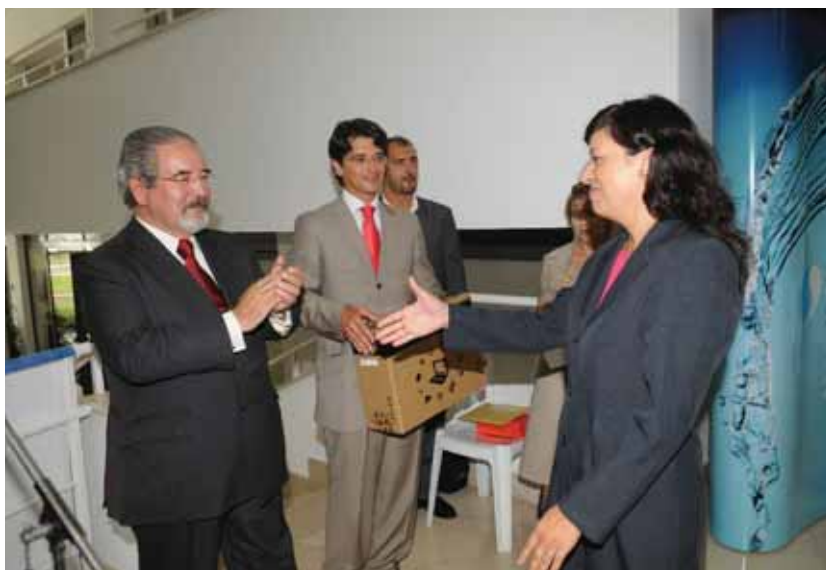
O Dia Nacional da Água foi assinalado pelos SMAS de Oeiras e Amadora com a cerimónia de entrega de prémios do concurso 'Melhores Ideias'