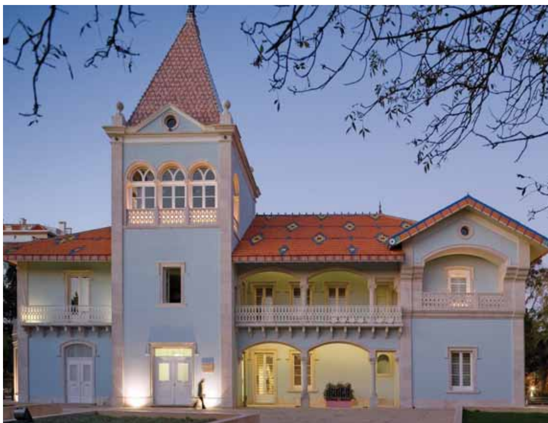
Palácio Anjos, em Algés