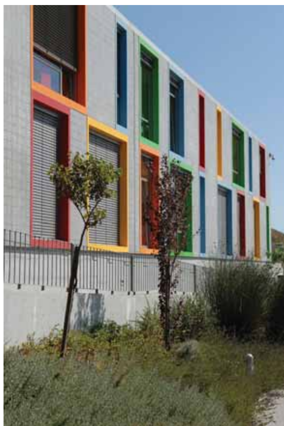
Colégio Tagus Park, em Porto Salvo

Atribuindo prémios no valor global de 20 mil euros, o Prémio Municipal de Arquitectura tem como referência a personalidade do Marquês de Pombal e a marca que imprimiu no crescimento urbano do concelho de Oeiras. Instituído em 1991, tem como principal objectivo promover e incentivar a qualidade de edificações que, pelo seu valor arquitectónico, contribuam significativamente para a qualificação e/ou salvaguarda do património concelhio.