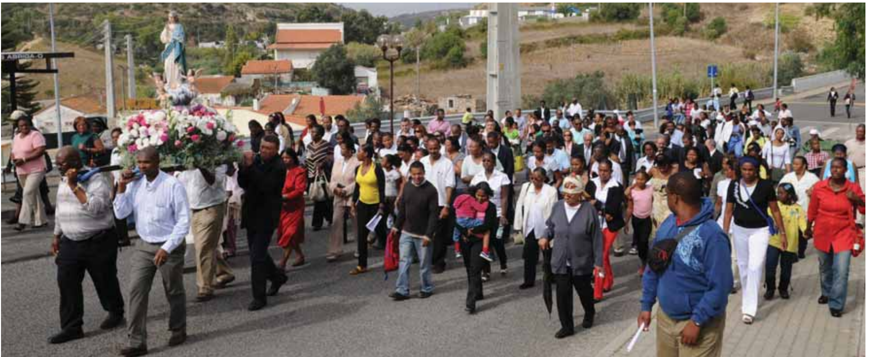
Procissão de Nossa Senhora da Paz, no Bairro dos Navegadores, freguesia de Porto Salvo