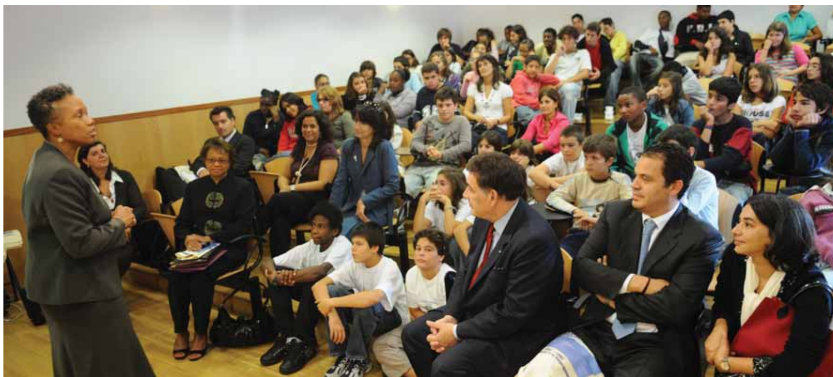
Na Escola de São Bruno, em Caxias

e sublinhou que, neste contexto, os presidentes de Câmara podem assumir o papel de “mediadores”, actuando enquanto “facilitadores de relações entre instituições, nomeadamente entre instituições de ensino e empresas”.