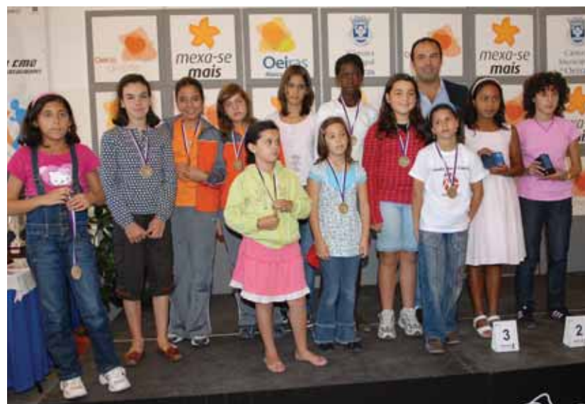
26.º Troféu CMO – Corrida das Localidades: Cerimónia de entrega de prémios aos atletas no quartel dos Bombeiros Voluntários de Paço de Arcos, com a presença do vice-presidente da Câmara, Paulo Vistas