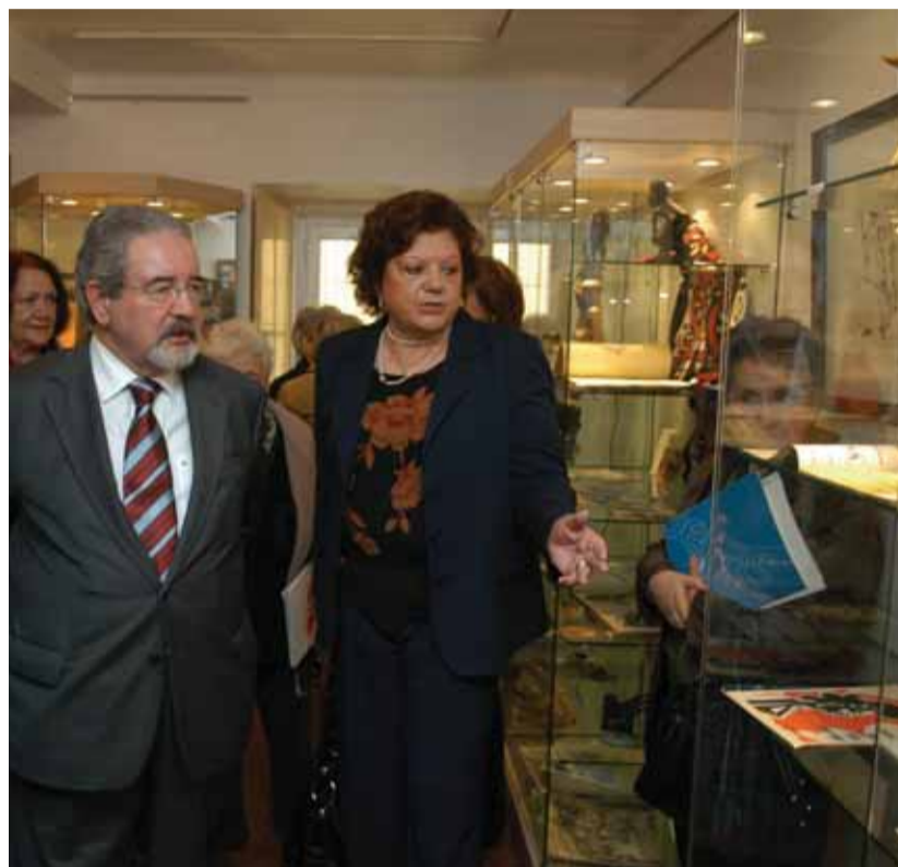
O presidente da Câmara, Isaltino Morais, visitando a exposição

Para ver de terça a sexta-feira, entre as 10.00h. e as 13.00h. e das 14.00h. às 18.00h., sábados e domingos das 14.00h. às 18.00h. (excepto feriados). A Livraria-Galeria Municipal Verney está localizada na Rua Cândido dos Reis, 90/90A, em Oeiras.