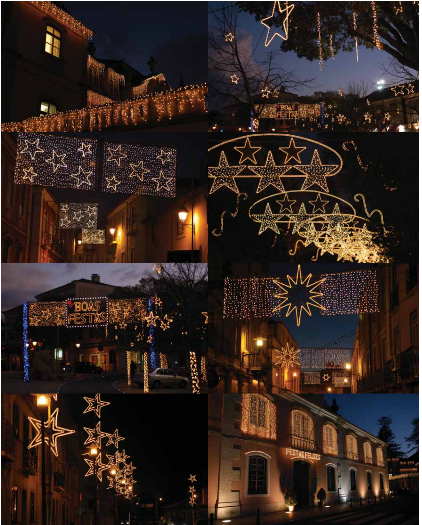
Iluminações de Natal para Ver de Perto. Por Carmo Montanha