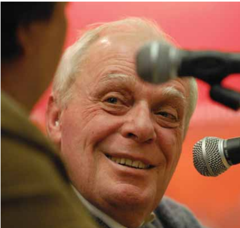
António Lobo Antunes