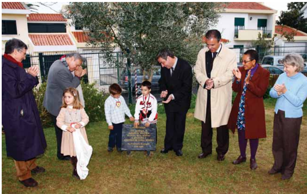
O momento do descerramento da placa evocativa

Paralelamente, decorreu nas instalações daquele estabelecimento de ensino uma acção de recolha de sangue, inserida no programa de iniciativas desenvolvido no âmbito da Comissão Social da Freguesia de Oeiras e São Julião da Barra.