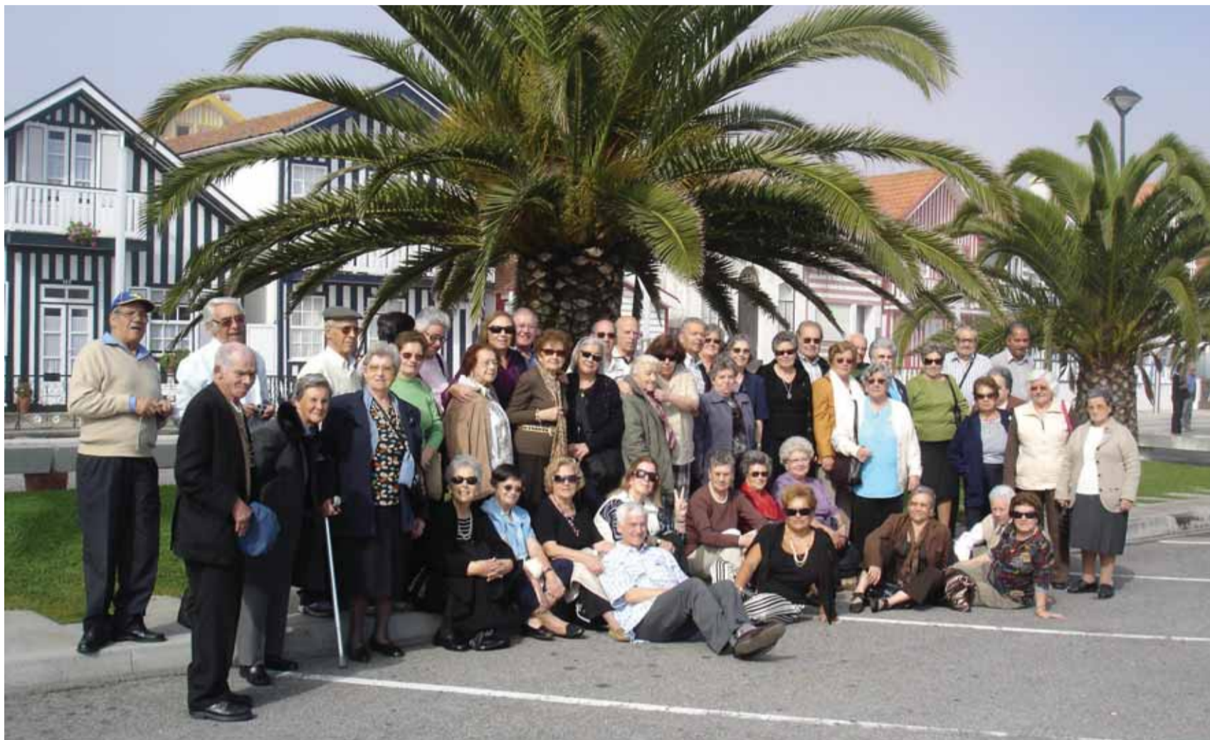
Um grupo de idosos da freguesia de Algés participou, em Outubro, no passeio à cidade de Aveiro, promovido pela junta de freguesia local. O Museu do Vinho, em Anadia, e as Caves Aliança, em Sangalhos, foram dois dos locais visitados.