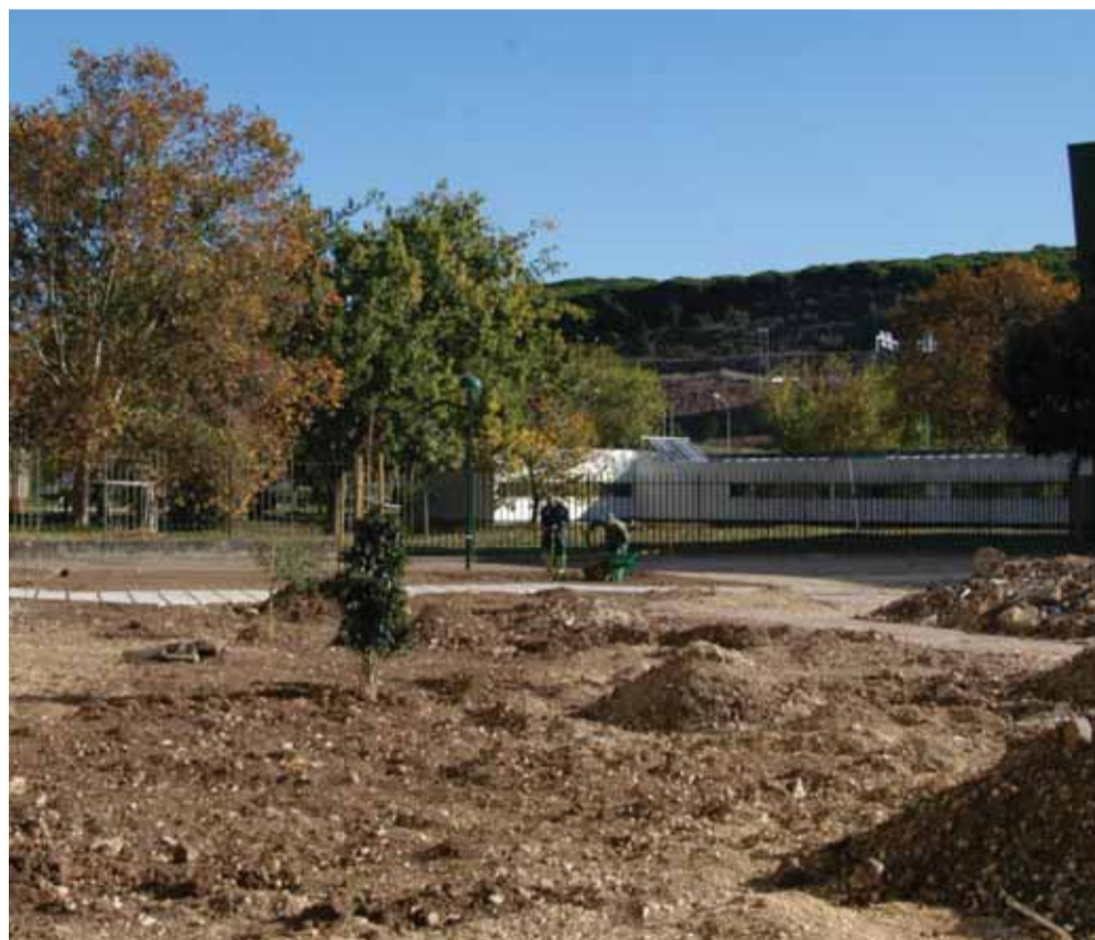
Largo Maria Leonor, em Algés