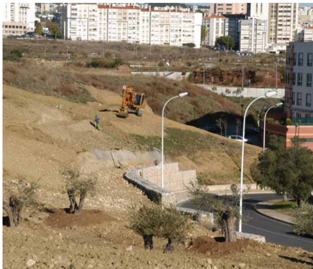
Arborização da área de enquadramento das traseiras da Rua da Eira, no Alto de Algés

Com a integração da área canina, pretende-se que os moradores, donos de cães, possam trazer os seus animais e soltá-los livremente, possibilitando-lhes a prática de exercício físico.