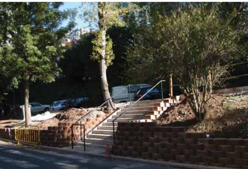
Rua Tenente General Zeferino Sequeira, Carnaxide

No âmbito das 'Áreas Plano' estão em curso as seguintes obras: