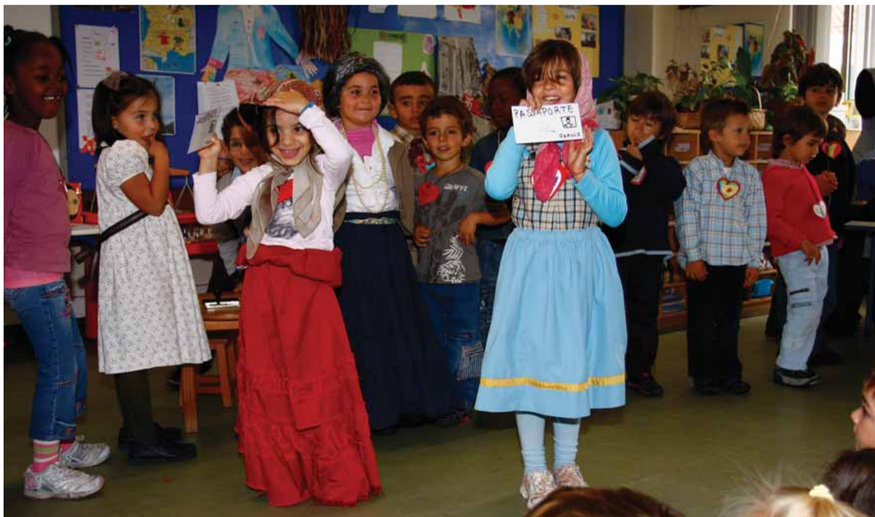
Peça de teatro retratando a vida de Aristides de Sousa Mendes, interpretada pelos alunos da escola