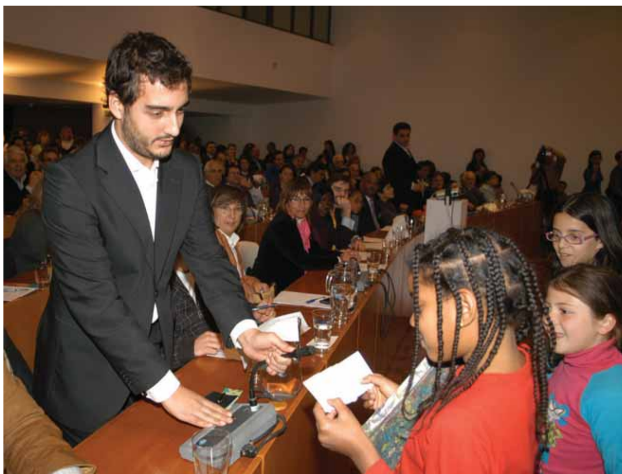
Os deputados municipais responderam às perguntas das crianças