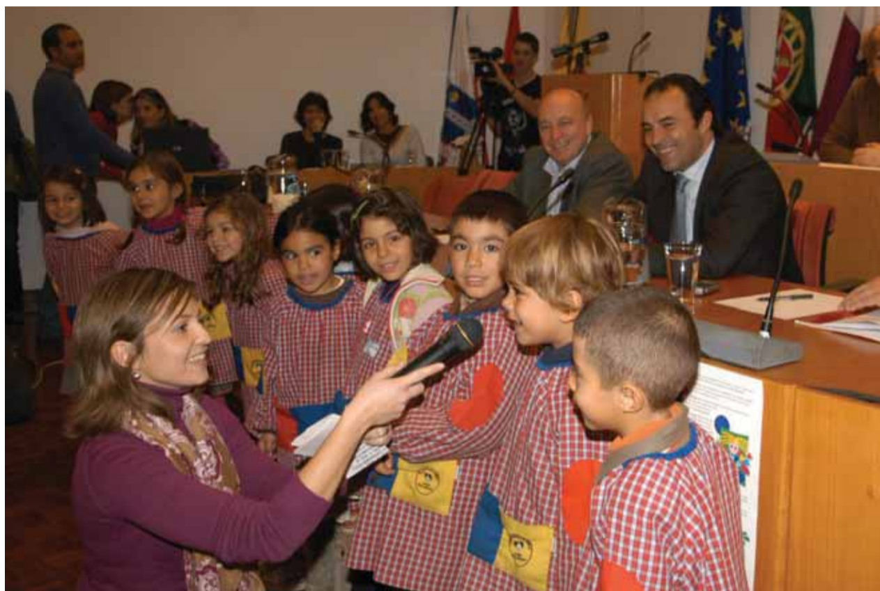
Os mais pequenos enunciaram os Direitos da Criança

Com estas iniciativas, a Câmara Municipal associou-se à comemoração do 19.º aniversário da adopção, pela Assembleia Geral das Nações Unidas, da Convenção sobre os Direitos da Criança, em 20 de Novembro de 1989.