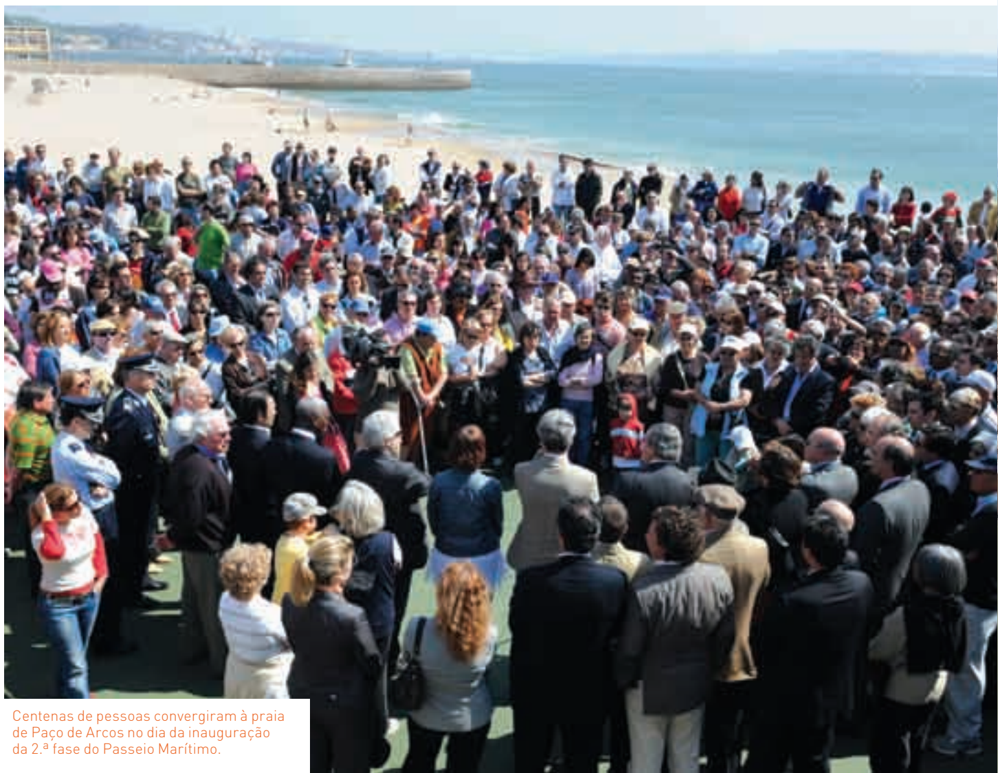
Centenas de pessoas convergiram à praia de Paço de Arcos no dia da inauguração da 2.ª fase do Passeio Marítimo.

A cerimónia de inauguração realizada no dia 21 de Março terminou com um almoço, servido junto ao edifício de apoio à actividade piscatória recentemente inaugurado na Praia Velha de Paço de Arcos e no qual a população foi convidada a participar. ■