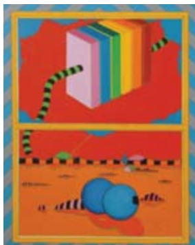
António Palolo, Sem Título, 1971, acrílico sobre tela, 120 x 116 cm [pormenor]