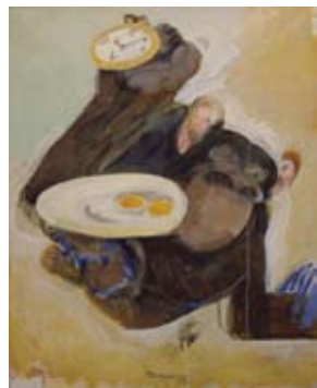
Julio Pomar, Temps de cuisson, 1992, acrílico sobre tela, 81,5 x 65 cm