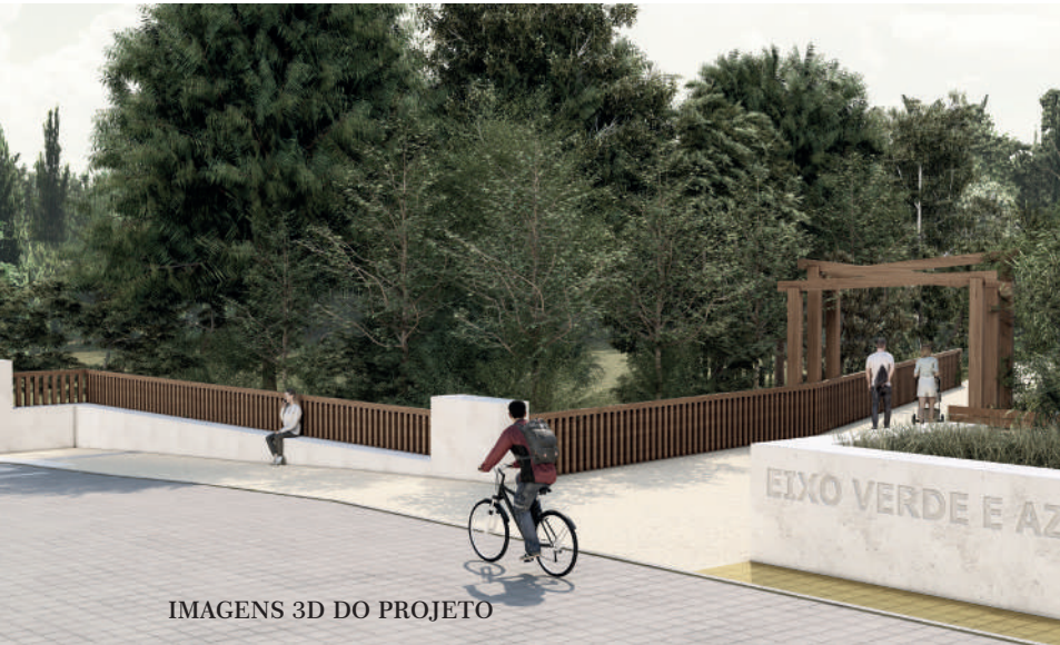
IMAGENS 3D DO PROJETO

Sinalização e Segurança A inclusão de sinalização vertical e horizontal, pilaretes dissuasores e medidas de acessibilidade para pessoas com deficiência visual são parte integrante da intervenção, garantindo segurança e integração.