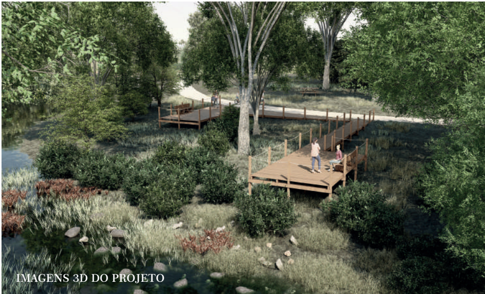
IMAGENS 3D DO PROJETO