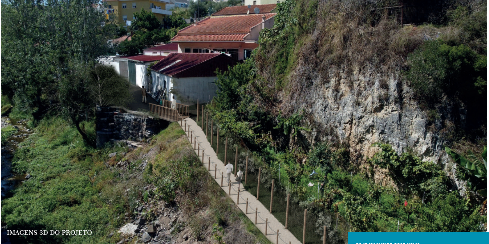
IMAGENS 3D DO PROJETO