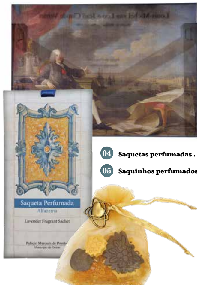
04 Saquetas perfumadas . 4 €