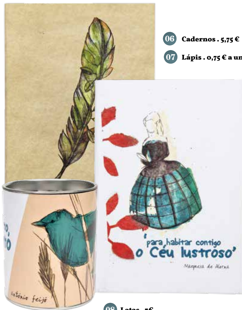
08 Latas . 3€