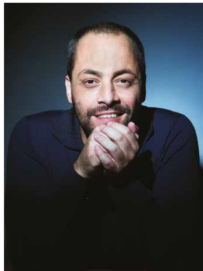
António Zambujo

A guitarra como instrumento nuclear e as suas múltiplas formas de expressão e diálogo constituíram o ponto de partida para a conceção desta iniciativa que em 2017 teve a sua primeira edição, com uma aposta multigeracional e atenta a diferentes linguagens musicais. O seu sucesso, num equilíbrio e harmonia dos objetivos definidos para cada um dos espaços, da diversidade de oferta e na sintonia de todos os aspetos que concernem a programação e produção determinou aquilo que agora propomos – uma segunda edição com um crescimento de duas datas em relação à anterior. Oito espetáculos que não querará perder. Oportunidade singular de assistir em Oeiras a concertos únicos.