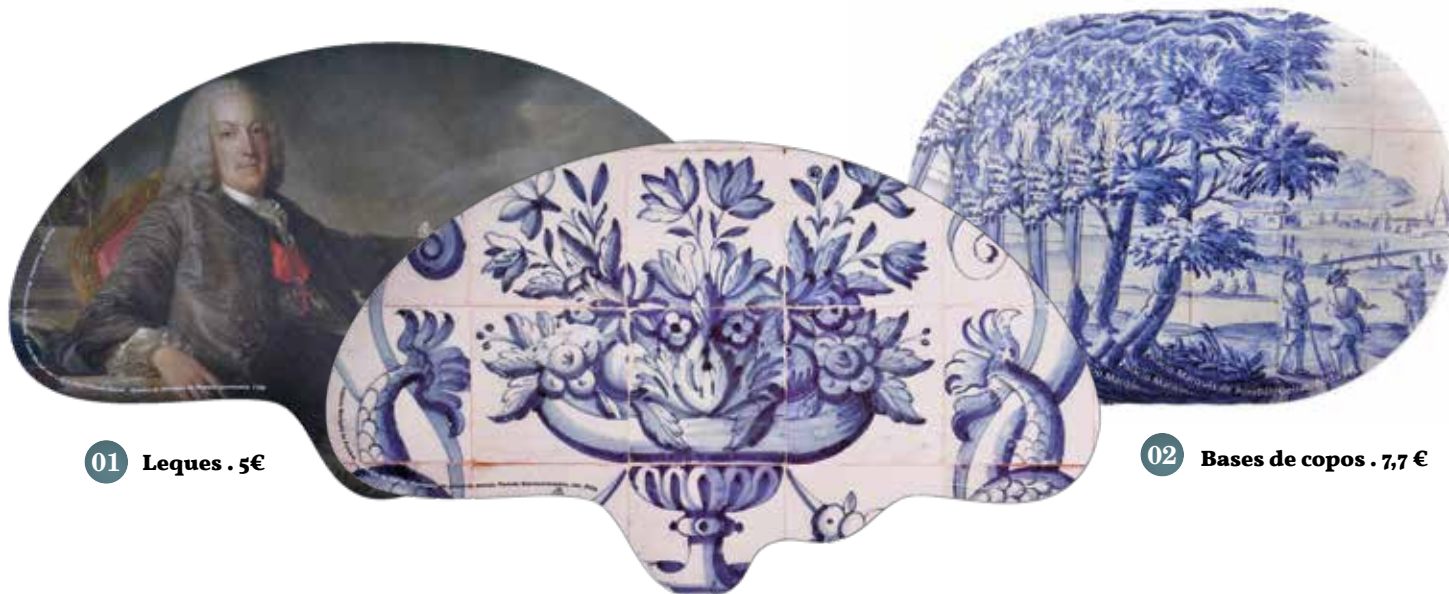
01 Leques . 5€