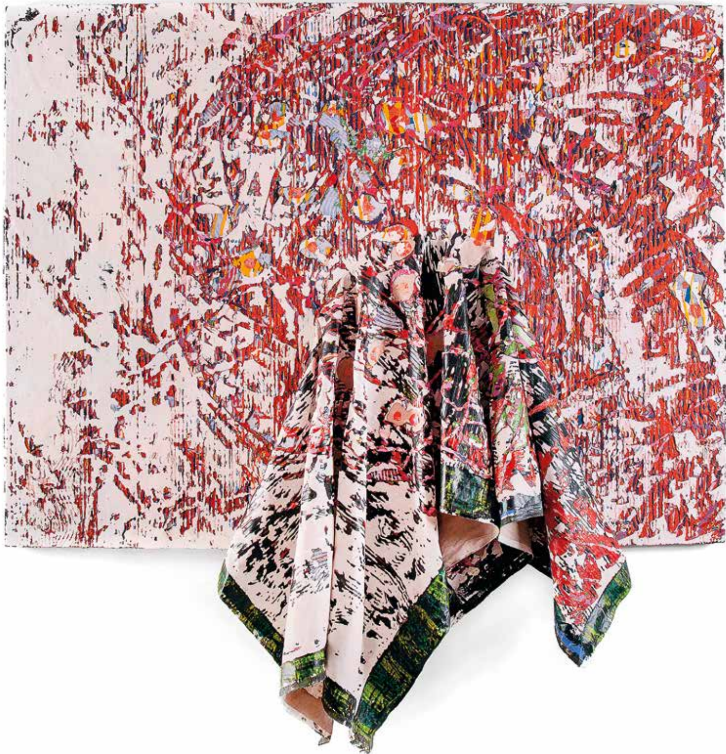
Rui Miguel Leitão Ferreira. Elevas-me com o teu toque embora eu não consigo ver as tuas mãos , 2017. acrílico e preparado industrial sobre tela e balão de borracha. 190 x 200 x 29 cm