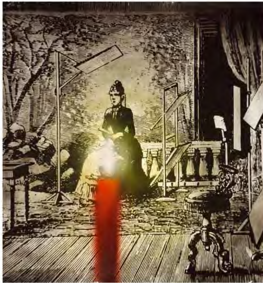
Siem Tijslo, 1972. óleo sobre tela. 120 x 99 cm [parmenor]

30. Sábado . 21h30 . António Zambujo . Auditório Municipal Ruy de Carvalho . Carnaxide Do Alentejo para o mundo, António Zambujo foi elogiado nos quatro cantos do globo, louvado no Brasil, por Caetano Veloso ou Jô Soares, e nos Estados Unidos, onde contou com rasgados aplausos do The New York Times .