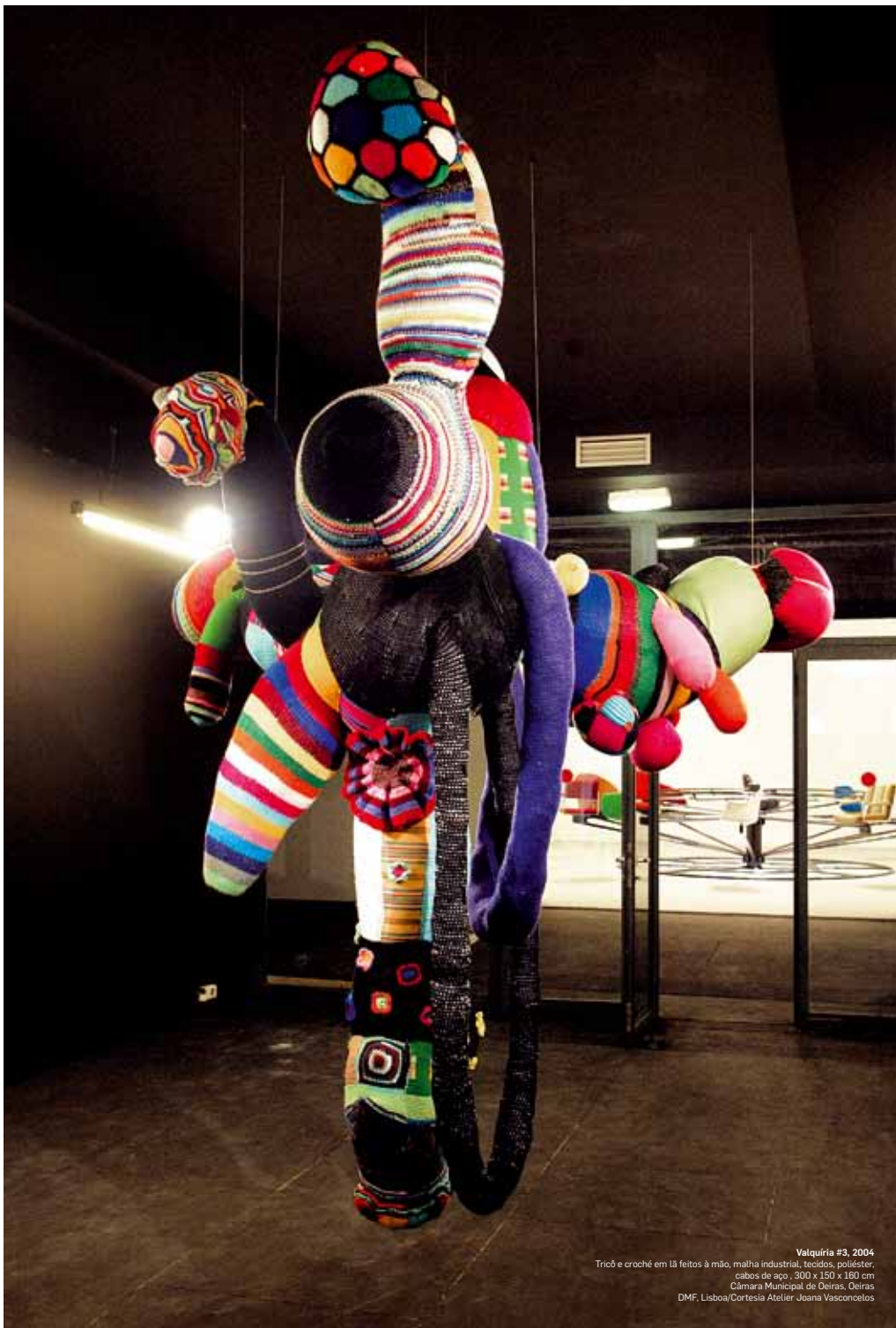
Valquiria #3, 2004 Tricô e croché em lã feitos à mão, malha industrial, tecidos, poliéster, cabos de esp. 300 x 150 x 180 cm Câmara Municipal de Oeiras, Oeiras DMF, Lisboa/Cortesía Atelier Joana Vasconcelos

A Joana Vasconcelos doou ao Município de Oeiras uma peça, a Valquiria#3, fruto da boa relação entre ambos ao longo dos tempos. Uma relação longínqua se pensarmos que a Joana, embora nascida em França, residiu em Algés. Aliás, foi na baixa de Algés que a Joana adquiriu peças para algumas das suas obras. Depois, o seu atelier esteve num espaço da Fundação de Oeiras durante vários anos e se, entretanto, rumou à capital, ficaram relações que o tempo não carcome. E esta peça, que agora é de todos nós, será suspensa na entrada do edifício municipal Atrium, entre o Oeiras Parque e o Parque dos Poetas, no final do mês de Janeiro e ali ficará a dar as boas vindas a todos os que nesse edifício entrarem. Imperdível vê-la suspensa, em têxtil e cheia de cor. Uma obra que, tal como todas as restantes obras da Joana, não passa despercebida a ninguém. Uma entrevista via e-mail pelo motivo mais nobre possível: a Joana embala nos braços o seu primeiro filho.