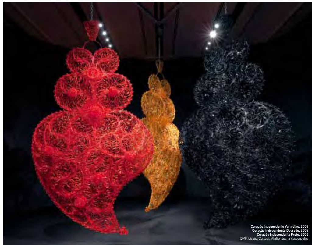
Coração Independente Vermelho, 2005 Coração Independente Dourado, 2004 Coração Independente Preto, 2006 DMF, Lisboa/Cortesia Atelier Joana Vasconcelos

A escala das minhas obras é uma consequência de decisões anteriores, e não um objetivo. Isto é, no caso da "Dorothy", escolhi fazer uma sandália de salto alto tamanho 36, à escala, usando o tacho de arroz como material. Portanto, foi a escolha do material e do processo de produção (a multiplicação dos tachos) que culminou num objeto daquela escala. "A Noiva" é um caso diferente, porque aí há uma relação muito particular com o objeto que é o lustre, um objeto majestoso por definição, com uma relação próxima com a arquitetura, pelo que fazê-lo numa escala