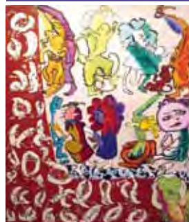
Paula Rego, Jenufa , 1983, acrílico sobre papel colado sobre tela, 240 x 203 cm