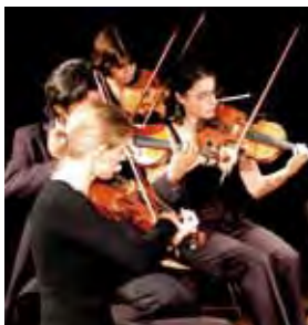
Recital "Tarde Musical". Solistas da Orquestra de Câmara de Cascais e Oeiras