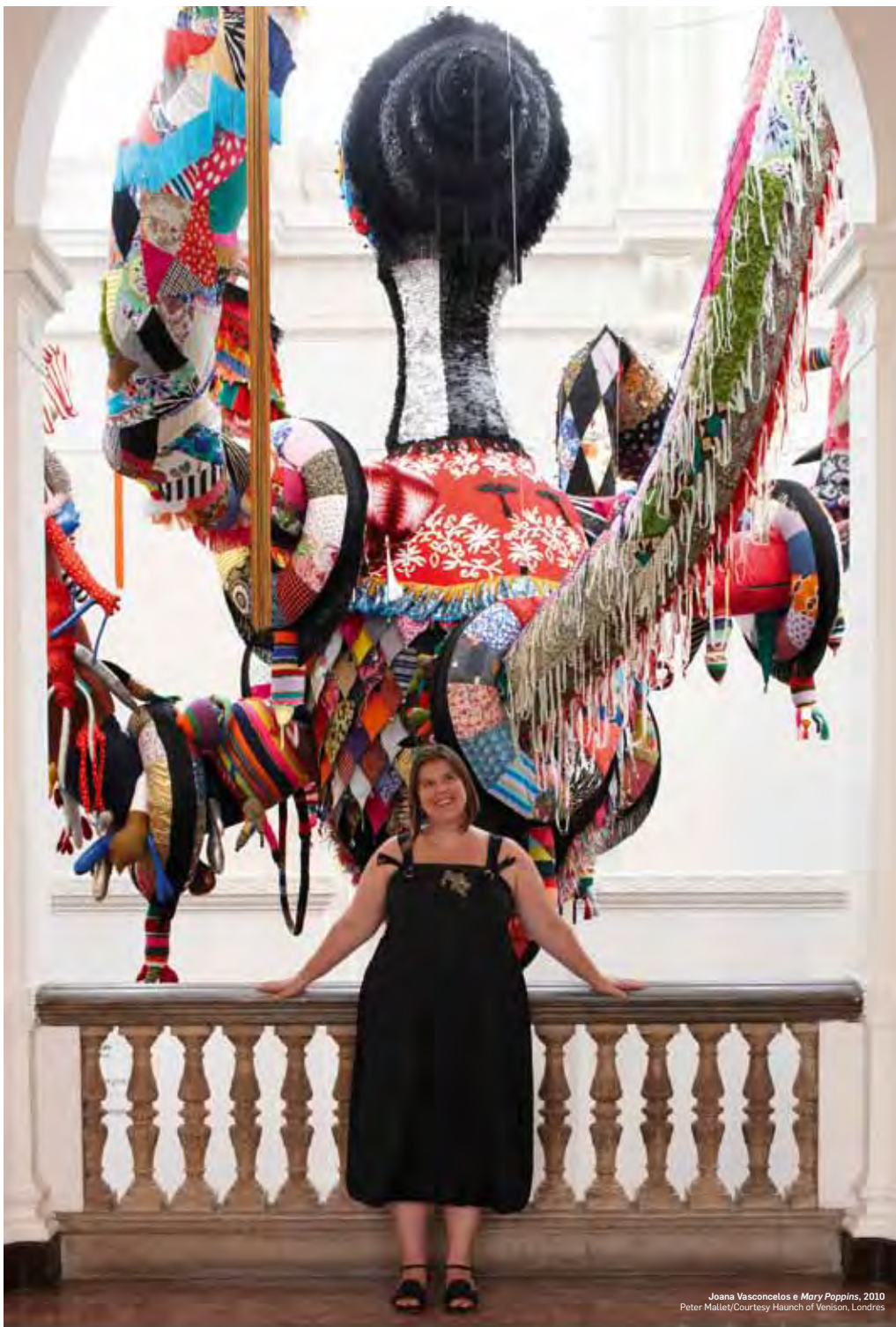
Joana Vasconcelos e Mary Poppins, 2010

AS MINHAS OBRAS NÃO SE FECHAM NUM DISCURSO OU NUMA SÓ INTERPRETAÇÃO. SÃO AMBÍGUAS E PARADOXAIS E A RIQUEZA ESTÁ EXATAMENTE NESSA MULTIPLICIDADE DE DISCURSOS E INTERPRETAÇÕES POSSÍVEIS.