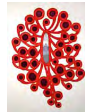
Leda Catunda, Amorosa, 2008, acrílico sobre voile, tela e veludo, 242 x 186 cm

Terça a domingo 10h00 às 18h00 . Última sexta de cada mês . 10h00 às 24h00 Centro de Arte Manuel de Brito Palácio Anjos . Algés