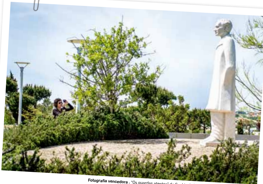
Fotografia vencedora - "Os guardas atentos" da Sophia de Mello Breyner "espiando no jardim" Miguel Torga - adaptado de "Tapas os caminhos".

Veja em http://tinyurl.com/6kbfvm as fotografias selecionadas de todas as edições do Clique.