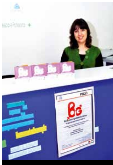
BALCÃO DE IGUALDADE DE GÉNERO (BIG) Rua Mário Moreira, Loja 8A, Carnaxide

Posto isto, um dos projetos que a APSD sentiu necessidade de desenvolver, em colaboração com diversos parceiros (Câmara Municipal de Oeiras incluída) foi um Plano para a Igualdade de Género para o concelho de Oeiras, designado por PIGO e que trata as temáticas da Igualdade de Género (IG) e da Violência Doméstica (VD). O PIGO também conta com o BIG - BALCÃO PARA A IGUALDADE DE GÉNERO, que presta atendimento, apoio, aconselhamento e encaminhamento de vítimas e agressores envolvidos no fenómeno da VD. E presta serviços nas áreas psicológica, social e jurídica, de forma personalizada, confidencial e gratuita. }