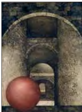
Bartolomeu Cid dos Santos, The Secret Place , 1973, água-forte e água-tinta, mancha 51,6 x 38,5 cm papel 78,2 x 59 cm

Até 15 Segunda a sexta . 14h30 às 17h30 Sábados . 15h00 às 18h00 Galeria de Arte Fundação Marquês de Pombal, Palácio dos Aciprestes . Linda-a-Velha