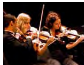
Solistas da OCCO