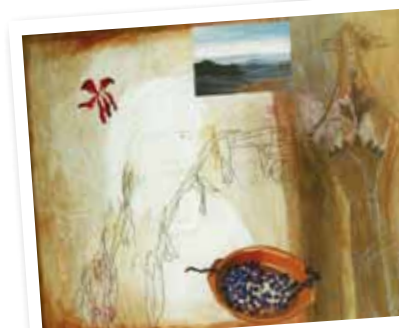
Graça Morais . Sem título, 1990 acrílico, carvão e pastel sobre tela . 97x130 cm