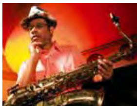
• Som da Surpresa . Don Byron