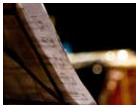
Música em Diálogo