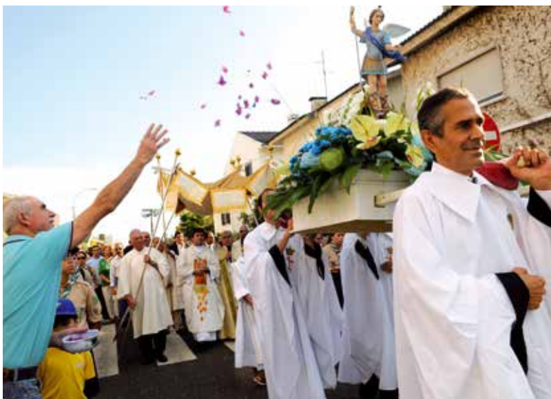
Festas em Honra de São Miguel Arcanjo, Queijas