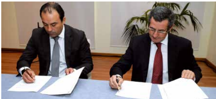
Assinatura de memorandos de cooperação com a Associação CAIS e com a Oeiras Invest e de protocolos com o Instituto Superior de Ciências Sociais e Políticas, a Associação Empresarial da Região de Lisboa e o Grupo de Reflexão e Apoio à Cidadania Empresarial

promoção de hábitos de vida saudáveis junto dos jovens, a prevenção do consumo excessivo de álcool e alerta para outras dependências. Neste caso foi dado apoio financeiro, que se destinou à aplicação de uma metodologia de avaliação de impacto social, essencial para perceber os resultados efetivos do projeto que se iniciou em 2011 e abrangeu, em 2013, oito escolas e um total de 481 alunos. No domínio do voluntariado empresarial, destaque para o projeto Apetece-me, da responsabilidade da área de voluntariado da Nestlé. Consiste na realização de diversas sessões de sensibilização sobre nutrição para crianças, assim como a capacitação de pais e educadores. }