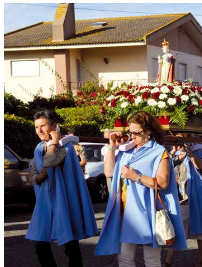
Festas em honra de Nossa Senhora da Piedade, Leceia