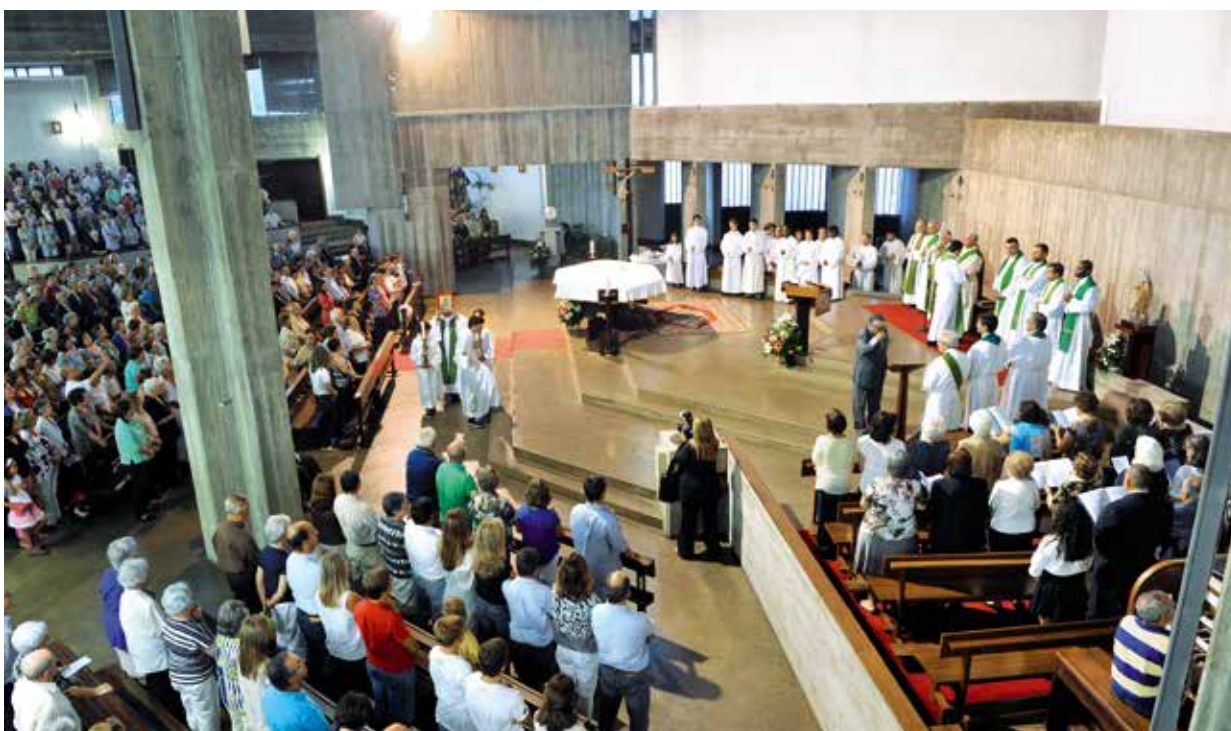
Tomada de posse do novo pároco de Paço de Arcos