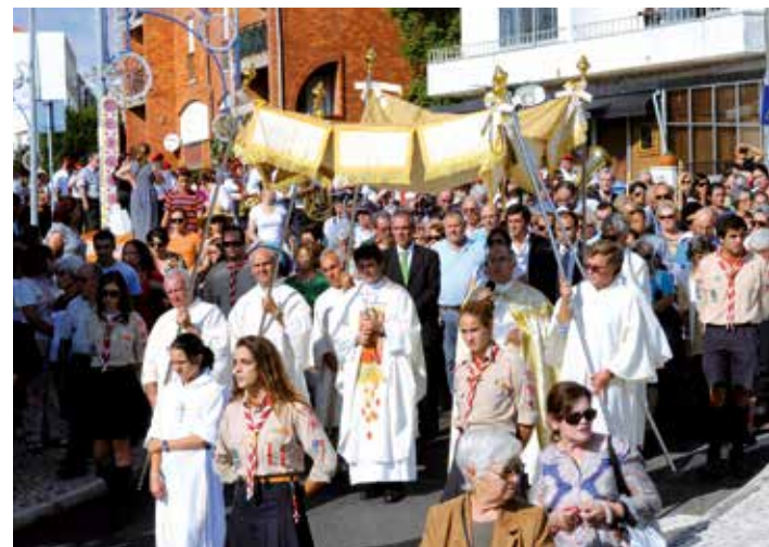
Festas em Honra de São Miguel Arcanjo, Queijas