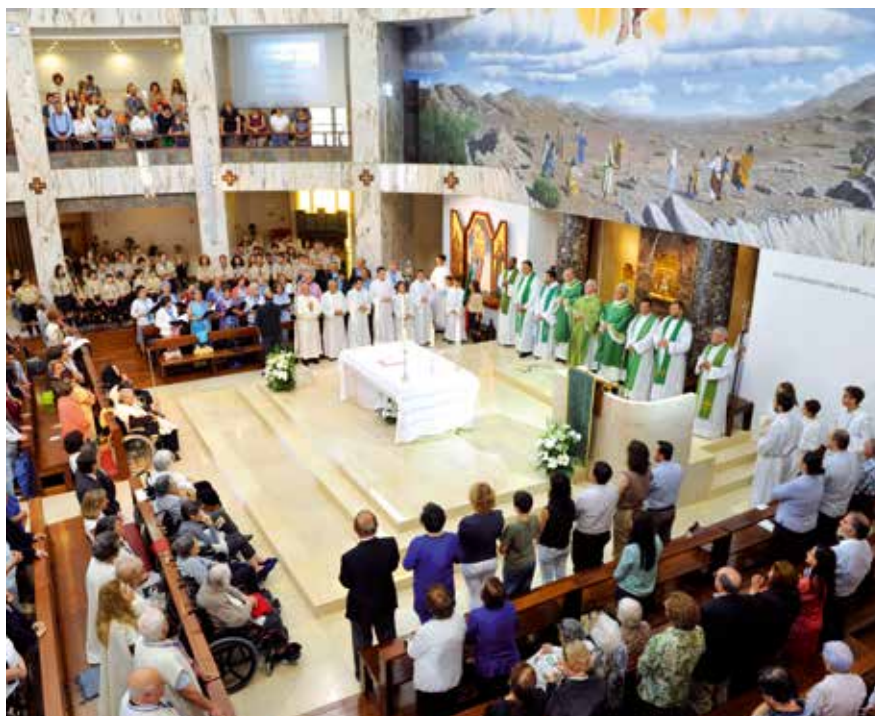
Tomada de posse do novo pároco de Linda-a-Velha