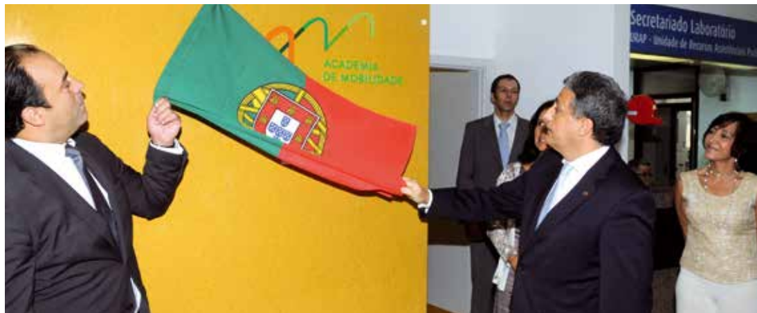
O presidente da Câmara Municipal de Oeiras, Paulo Vistas, com o ministro da Saúde, Paulo Macedo

O ministro da Saúde, Paulo Macedo, associou-se às comemorações do Dia Internacional do Idoso com uma deslocação a Oeiras, onde esteve para a inauguração da primeira Academia de Mobilidade da Região de Lisboa e Vale do Tejo, no ACES Lisboa Ocidental e Oeiras.