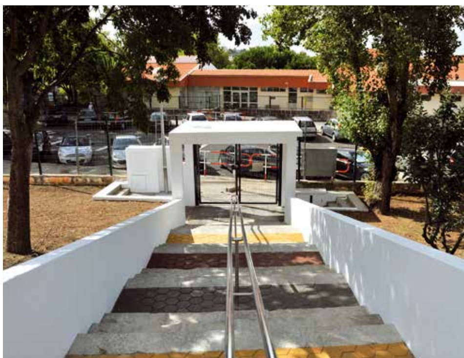
EB1 Sylvia Philips