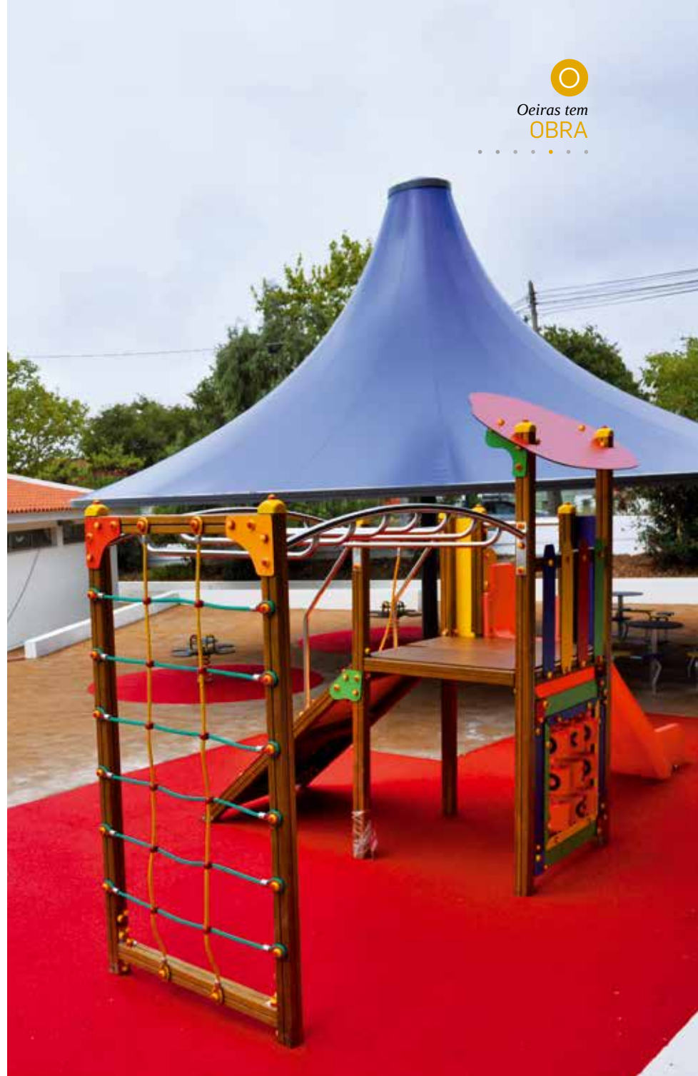
EB1 Santo António de Tercena

de cerca. Foram ainda criadas condições de acessibilidade ao edifício escolar principal e ao campo desportivo, já que as rampas pré-existentes excediam em muito a inclinação regulamentar, pelo que foram substituídas por percursos acessíveis.