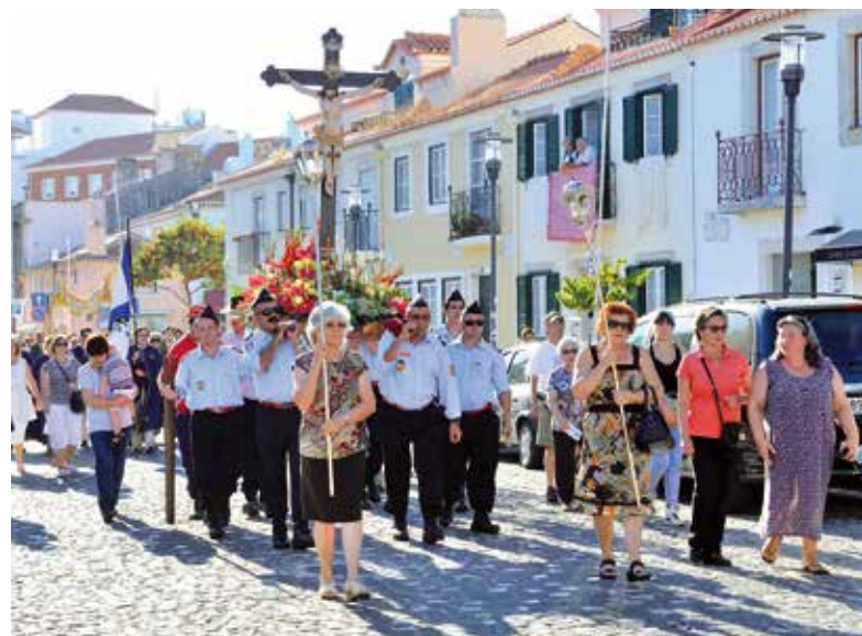
Festas em honra do Senhor Jesus dos Navegantes, Paço de Arcos