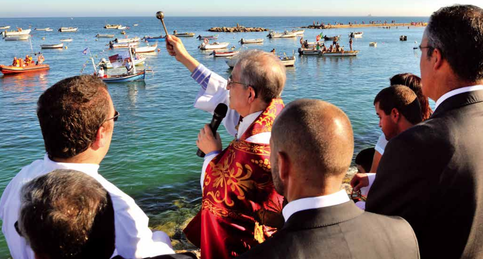
Festas em honra do Senhor Jesus dos Navegantes, Paço de Arcos