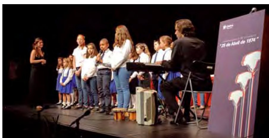
Os pequenos cantores do Coro Infantil de Santo Amaro de Oeiras