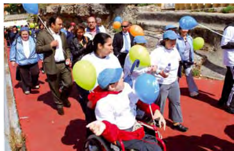
O presidente da Câmara Municipal de Oeiras, Paulo Vistas, na Caminhada Mágica

Inserida no âmbito da campanha do Pirilampo Mágico 2013, a CERCIOEIRAS promoveu, no passado dia 17 de maio, a quinta edição da Caminhada Mágica no Passeio Marítimo de Oeiras. Participaram famílias, amigos, voluntários, parceiros e utentes de outras Instituições da área da grande Lisboa, num número aproximado de 300 pessoas. A iniciativa teve como objetivo sensibilizar e dar visibilidade às necessidades e potencialidades das pessoas com deficiência intelectual e, naturalmente, divulgar a campanha do pirilampo. }