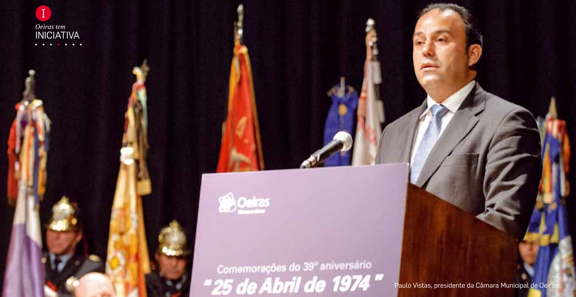
Paulo Vistas, presidente da Câmara Municipal de Oeiras