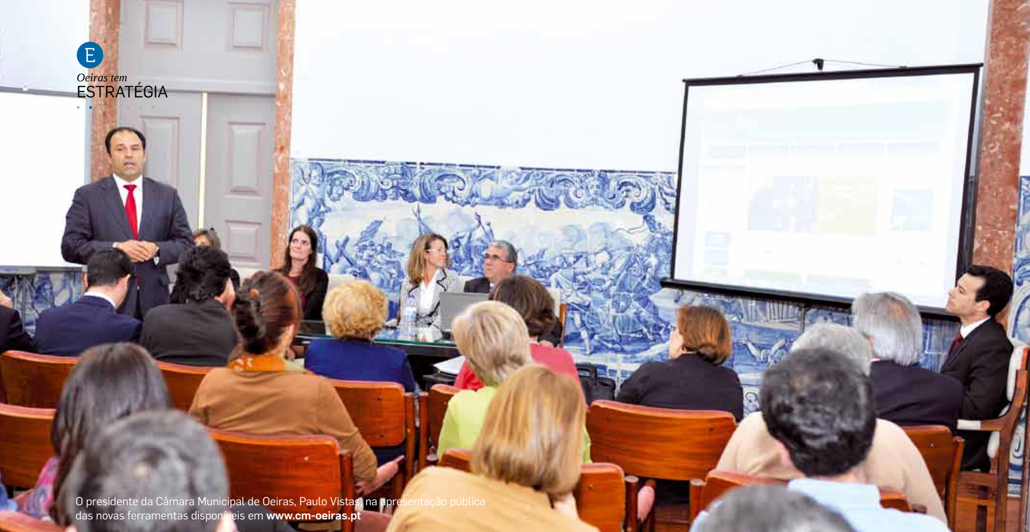
O presidente da Câmara Municipal de Oeiras, Paulo Vistas, na apresentação pública das novas ferramentas disponíveis em www.cm-oeiras.pt