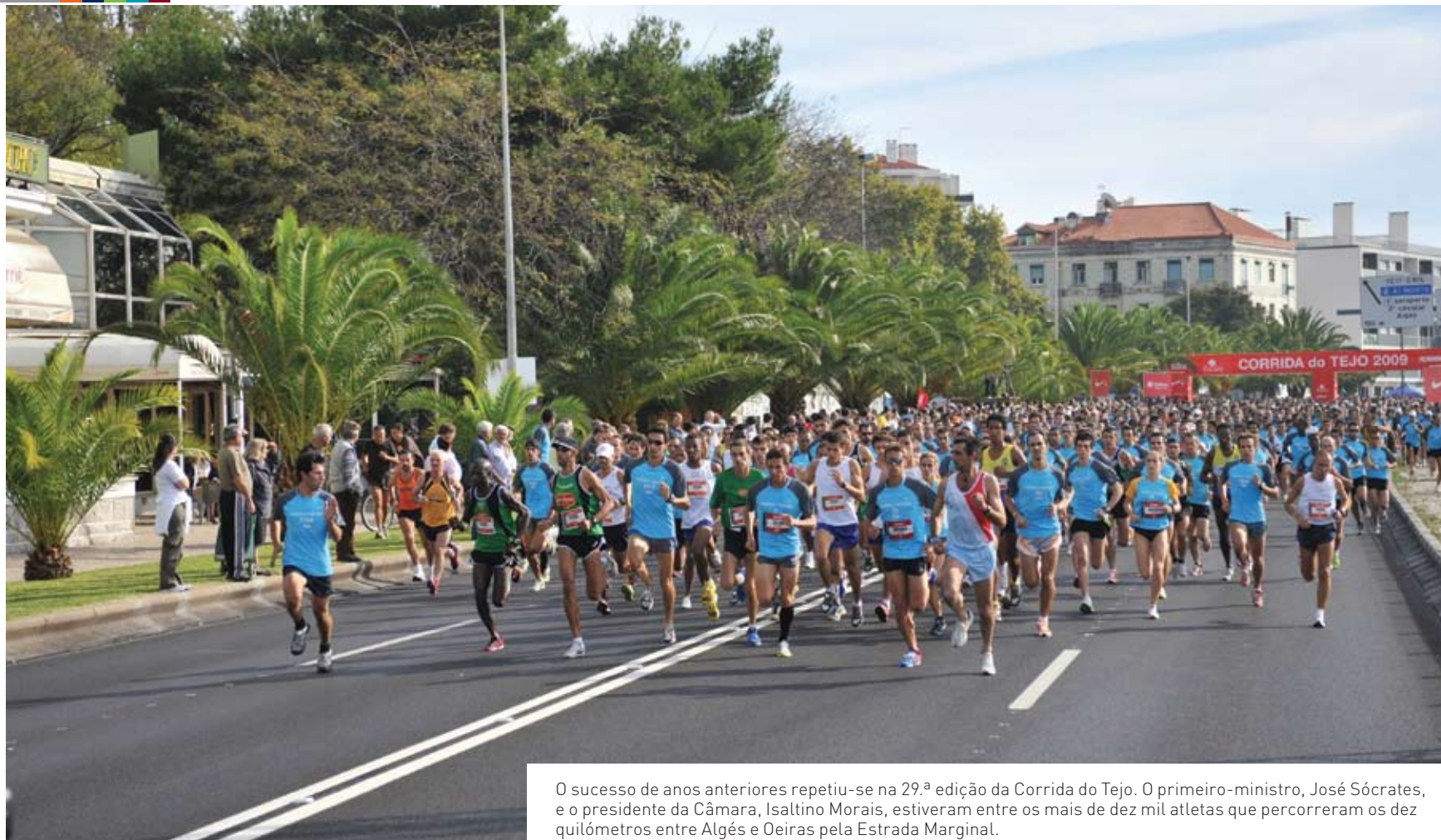
O sucesso de anos anteriores repetiu-se na 29.ª edição da Corrida do Tejo. O primeiro-ministro, José Sócrates, e o presidente da Câmara, Isaltino Morais, estiveram entre os mais de dez mil atletas que percorreram os dez quilómetros entre Algés e Oeiras pela Estrada Marginal.