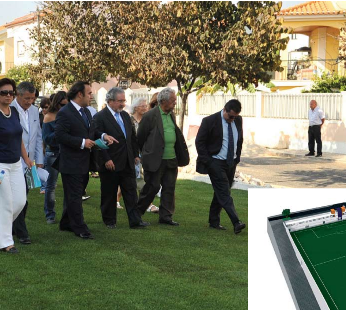
A Câmara Municipal investiu 120 mil euros nos arranjos exteriores do Pavilhão do Clube Desportivo e Recreativo dos Leões de Porto Salvo