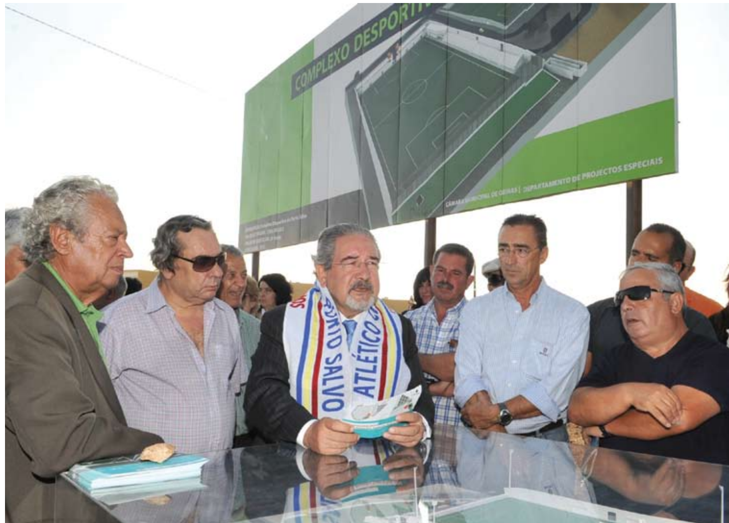
O presidente da Câmara esteve em Porto Salvo para apresentar o projecto do futuro Complexo Desportivo