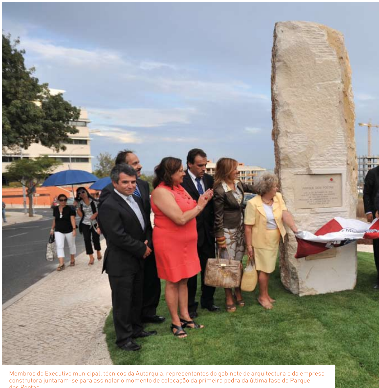
Membros do Executivo municipal, técnicos da Autarquia, representantes do gabinete de arquitectura e da empresa construtora juntaram-se para assinalar o momento de colocação da primeira pedra da última fase do Parque dos Poetas

D. Dinis (1279-1325), João Roiz de Castel-Branco (XV-XVI), Gil Vicente (1460-1536), Garcia de Resende (1470-1536), Bernardim Ribeiro (1482-1552), Sá de Miranda (1487-1558), Cristóvão Falcão (1518-1557), Diogo Bernardes (1520-1605), Luís de Camões (1524-1580), António Ferreira (1528-1569), Francisco Rodrigues Lobo (1573-1621), Soror Violante do Céu (1601-1693), Frei Jerónimo Baía (1620/30-1688), Correia Garção (1724-1772), Filinto Elísio (1734-1819), Nicolau Tolentino (1740-1811), José Anastácio da Cunha (1744-1787), Marquesa de Alorna (1750-1839), Manuel