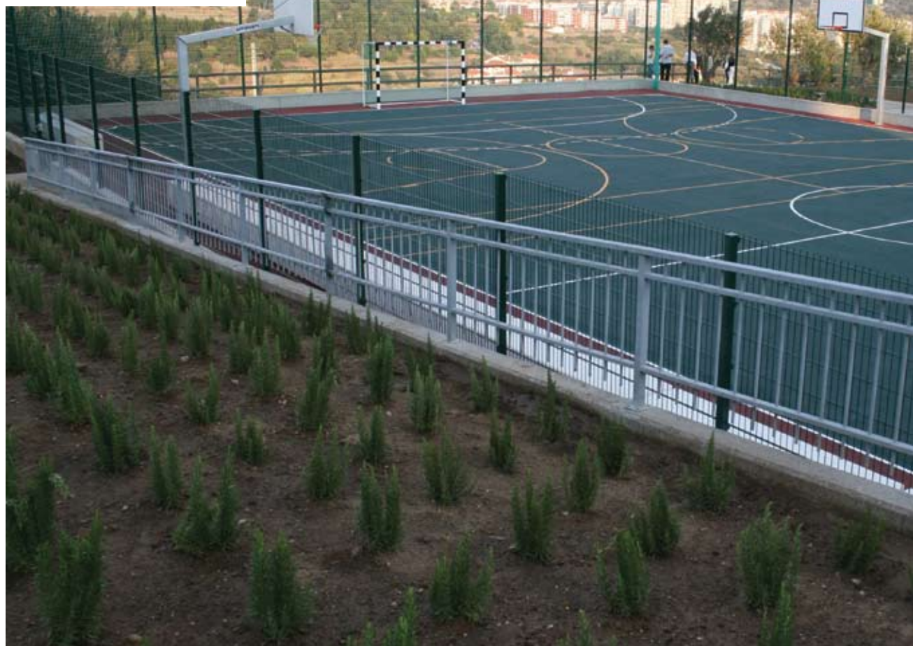
O Parque Urbano de Queijas dispõe de um polidesportivo descoberto

Foram utilizadas essencialmente as oliveiras já existentes no local, mantendo-se o seu local de plantação e transplantando-se para novos locais as que estavam localizadas em áreas ocupadas pelo Campo Polidesportivo ou por percursos e estadias.