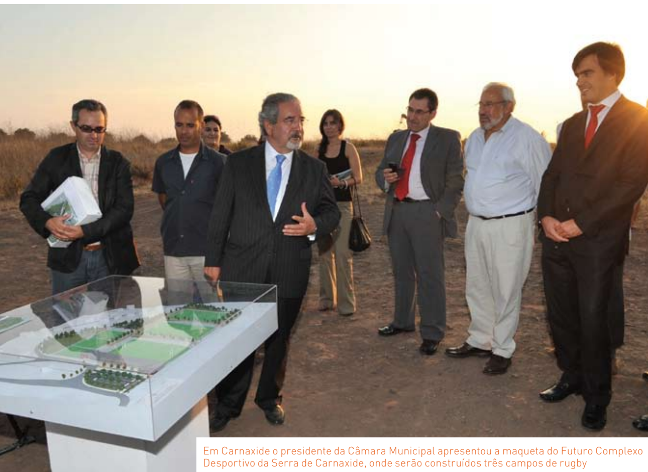
Em Carnaxide o presidente da Câmara Municipal apresentou a maquete do Futuro Complexo Desportivo da Serra de Carnaxide, onde serão construídos três campos de rugby