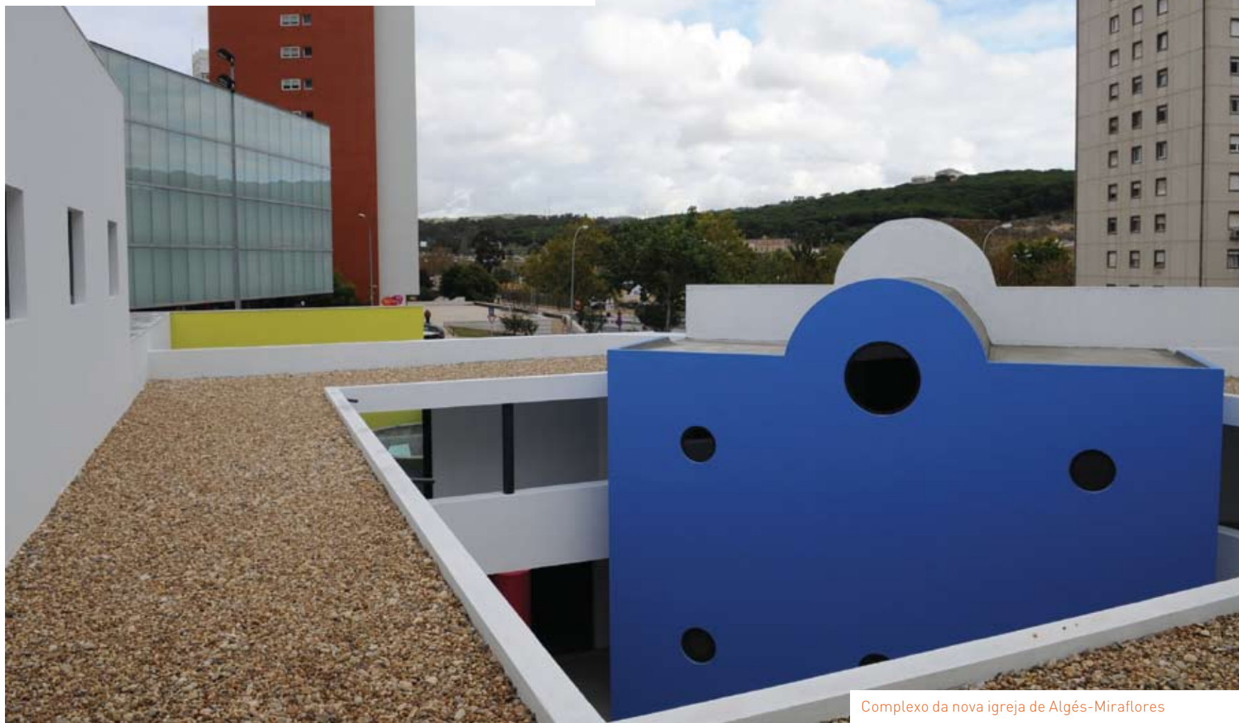
Complexo da nova igreja de Algés-Miraflôres

A Câmara Municipal de Oeiras aprovou, em reunião de Executivo realizada no passado dia 9 de Setembro, a atribuição, em 2009, de um subsídio no valor de 200.000 € à Fábrica da Igreja Paroquial de Cristo Rei de Algés.