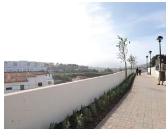
As obras promovidas pela Câmara Municipal de Oeiras no Bairro da Pedreira Italiana tiveram como principal objectivo a melhoria da qualidade do espaço público