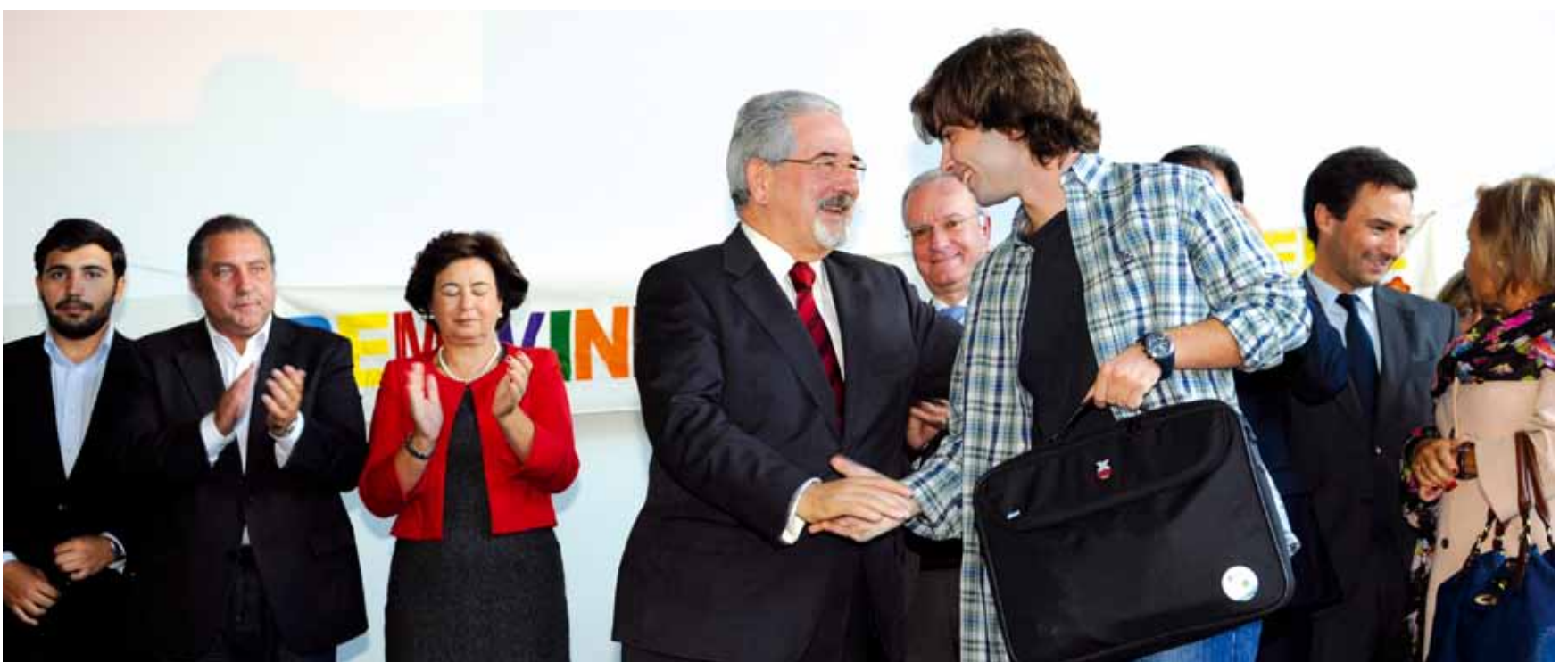
Durante a cerimónia de inauguração da nova EB1/JI Gomes Freire de Andrade foram distinguidos os melhores alunos finalistas do ensino secundário do concelho, numa iniciativa que visa incentivar a excelência e promover o sucesso educativo. Cada um deles levou para casa um computador portátil, justificado pelas médias obtidas – todas superiores a 18 valores – no ano letivo de 2008/09.