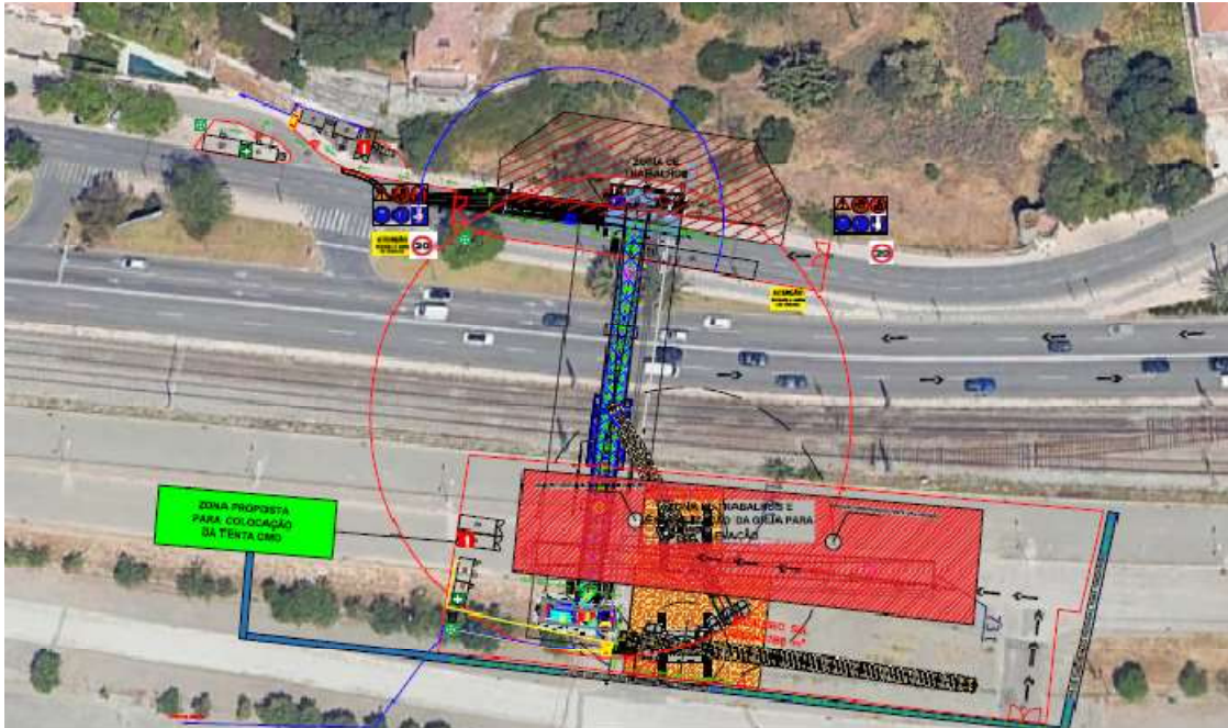
Proposta de localização da tenda da CMO (zona assinalada a verde na planta)