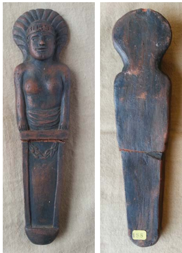
Fig. 4 – Figura femenina de tipo D con tiara e inscripción: 3.1, Biblioteca Nacional de Portugal (BNP-188).

Bibliografía: Inédita, pero dibujada por José de Cornide en su Viaje a Portugal (véase n.º 9-A).