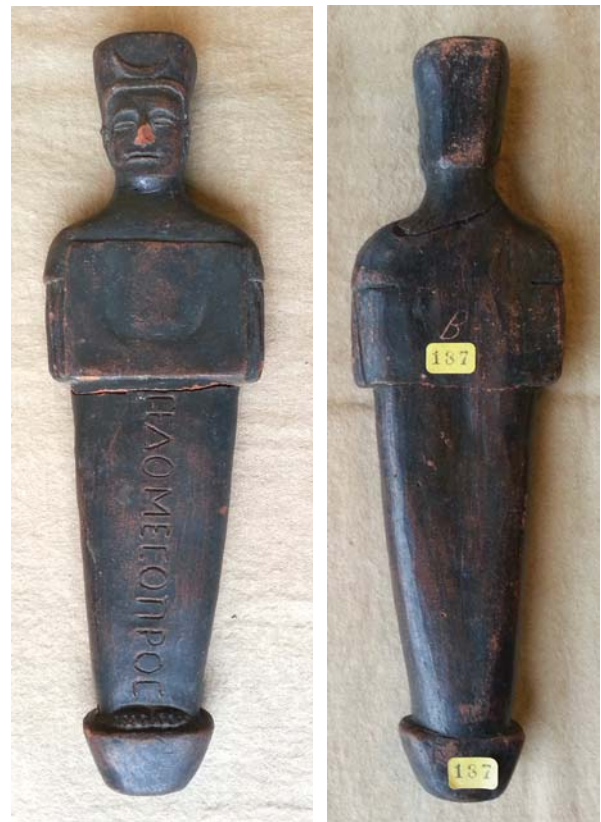
Fig. 7 – Figura osiriaca de tipo F con inscripción conservada en la Biblioteca Nacional de Portugal (BNP-187).

Bibliografía: Inédita, pero dibujada por José de Cornide en su Viaje a Portugal (ALMAGRO-GORBEA, 2003, p. 349, n.º F148A).