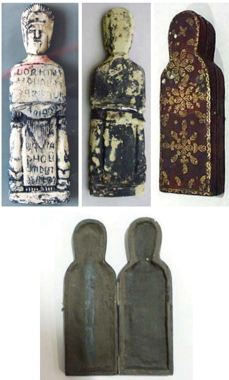
Fig. 3 – Deidad femenina de tipo C del Museu Nacional Soares dos Reis con su estuche de época.

Por su parte posterior, la figura es mucho más simple y queda totalmente lisa, aunque se distinguen las distintas partes de su cuerpo. La espalda ofrece en su centro un pequeño recuadro cuadrangular, apenas perceptible, con dos incisiones laterales que son la prolongación de la línea del cinturón de la cara delantera. La parte inferior es rectangular y destaca entre las columnas laterales y el plinto bajo sobre el que se apoya la figura.