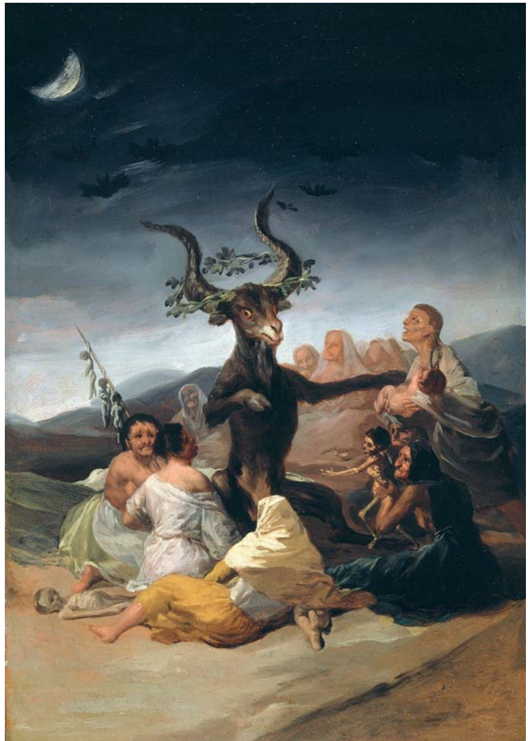
Fig. 12 – Aquelarre , por Francisco de Goya, Museo Lázaro Galdiano, Madrid.

Esta divinidad capriforme se ha relacionado con la noticia transmitida por Herodoto (II,46) de que en el nomo de Mendes, en el Bajo Egipto, se adoraba a una antigua divinidad con cuerpo humano y patas y cabeza