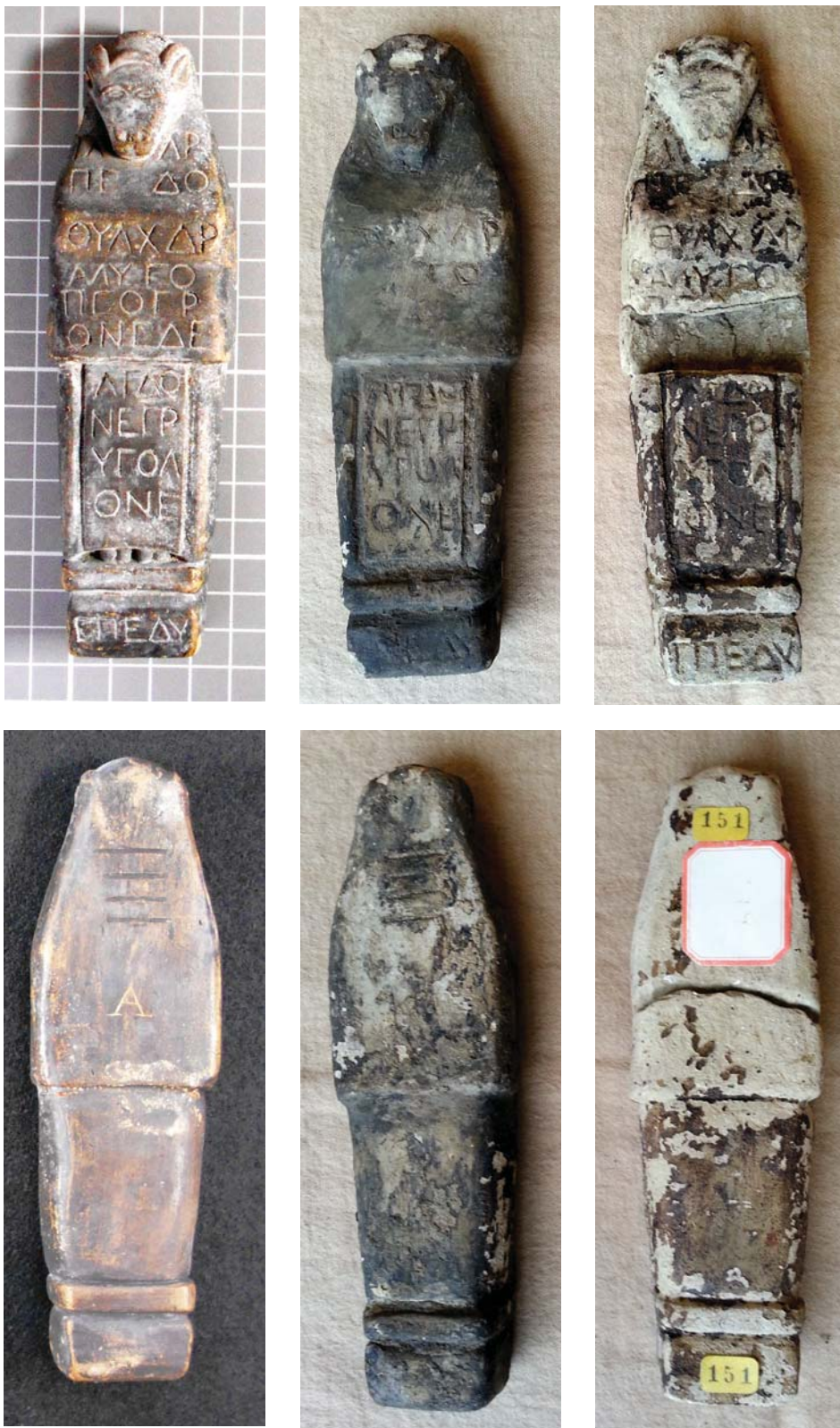
Fig. 1 – Ídolos de terracota de tipo A: 1, Academia das Ciências-1 ; 2, Biblioteca Nacional de Portugal (BNP-147) ; 3, Biblioteca Nacional de Portugal (BNP-151) .