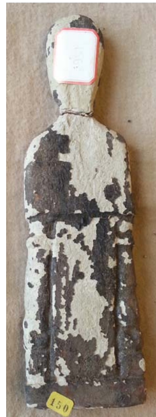
Fig. 2 – Deidad feminina de tipo B: 1, Biblioteca Nacional de Portugal (BNP-189); 2, Academia das Ciencias-2; 3: Biblioteca Nacional de Portugal (BNP-149); 4, Biblioteca Nacional de Portugal (BNP-150).