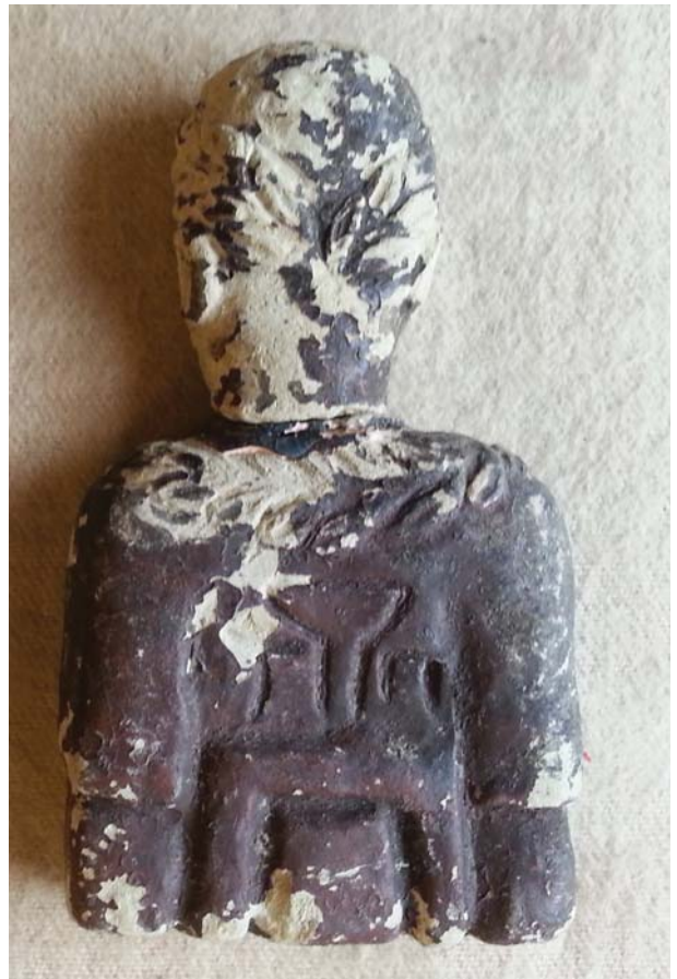
Fig. 9 – Figuras “a la romana”: 1, Biblioteca Nacional de Portugal (BNP-153); 2, Biblioteca Nacional de Portugal (BNP-154).