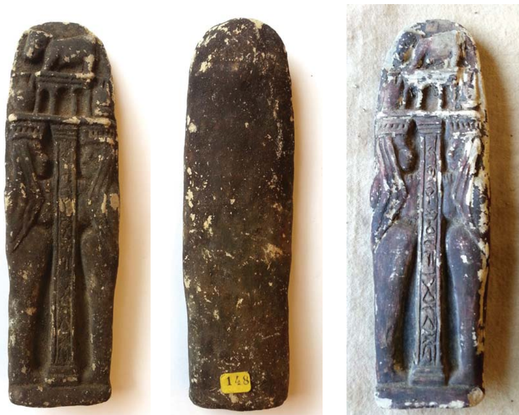
Fig. 8 – Plaquetas con figuras isíacas de tipo G: 1, Biblioteca Nacional de Portugal (BNP-148); 2, Biblioteca Nacional de Portugal (BNP-152).

Dimensiones: Altura: 161 mm. Anchura máxima: 47 mm. Grosor máximo (en la base): 16 mm.