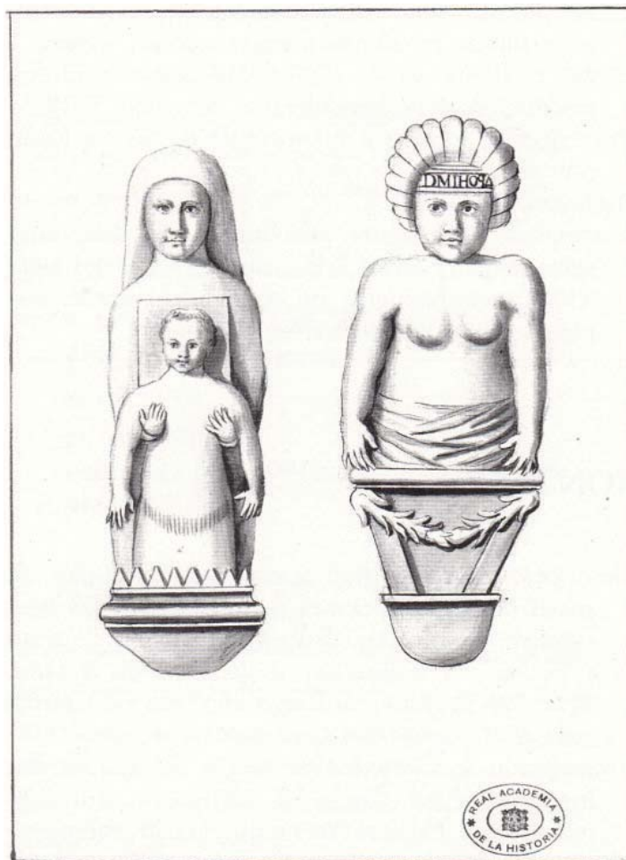
Fig. 5 – Dibujo por J. de Cornide de la figura anterior conservado en la Real Academia de la Historia , Madrid.

9A – Dibujo conservado en la Real Academia de la Historia , Madrid, de una figura falsa con inscripción de la Biblioteca Nacional de Portugal (BNP-188) (Fig. 5)